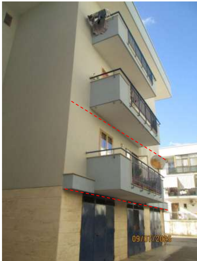
Foto n. 04 : Prospetto Sud ed Ovest, con delimitazione dell'affaccio dell'appartamento