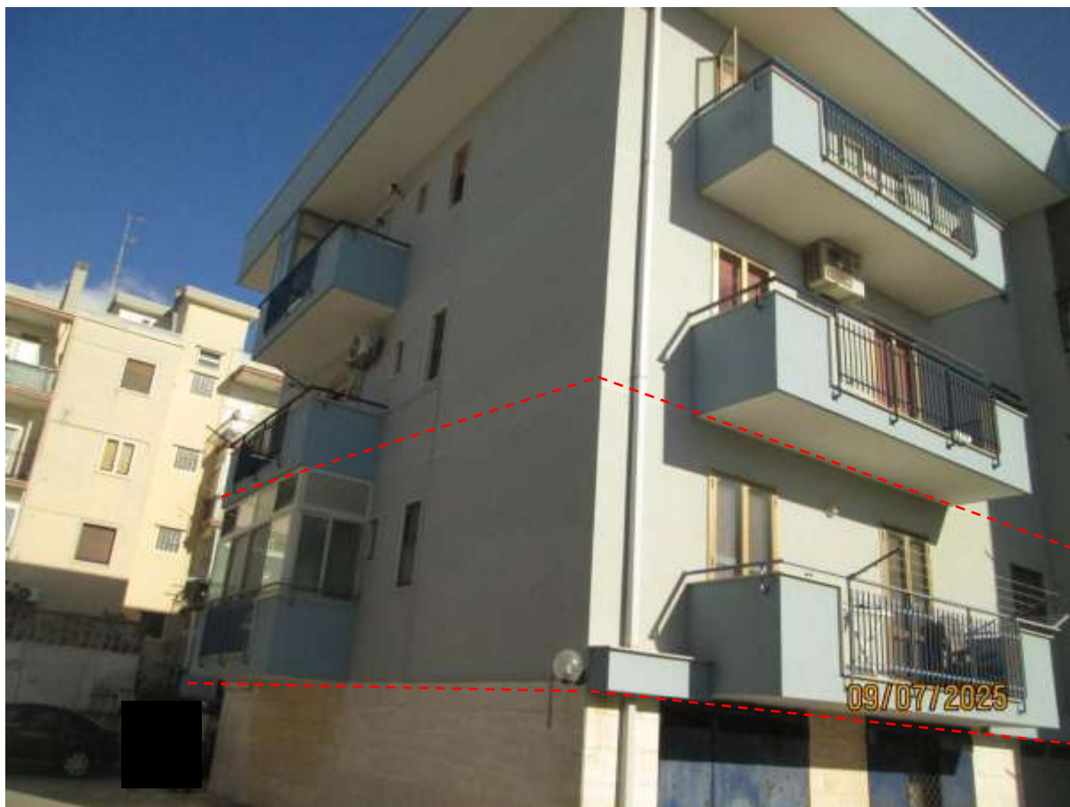
Foto n. 03: Prospetti Nord ed Est del fabbricato condominiale con delimitazione degli affacci dell'appartamento