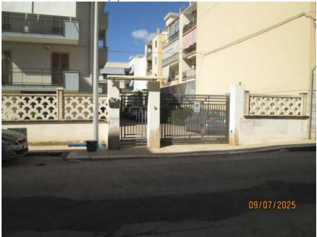
Foto n. 02: Cancelli carrabile e pedonale al civico 13 su Via Guerrieri a Mola di Bari