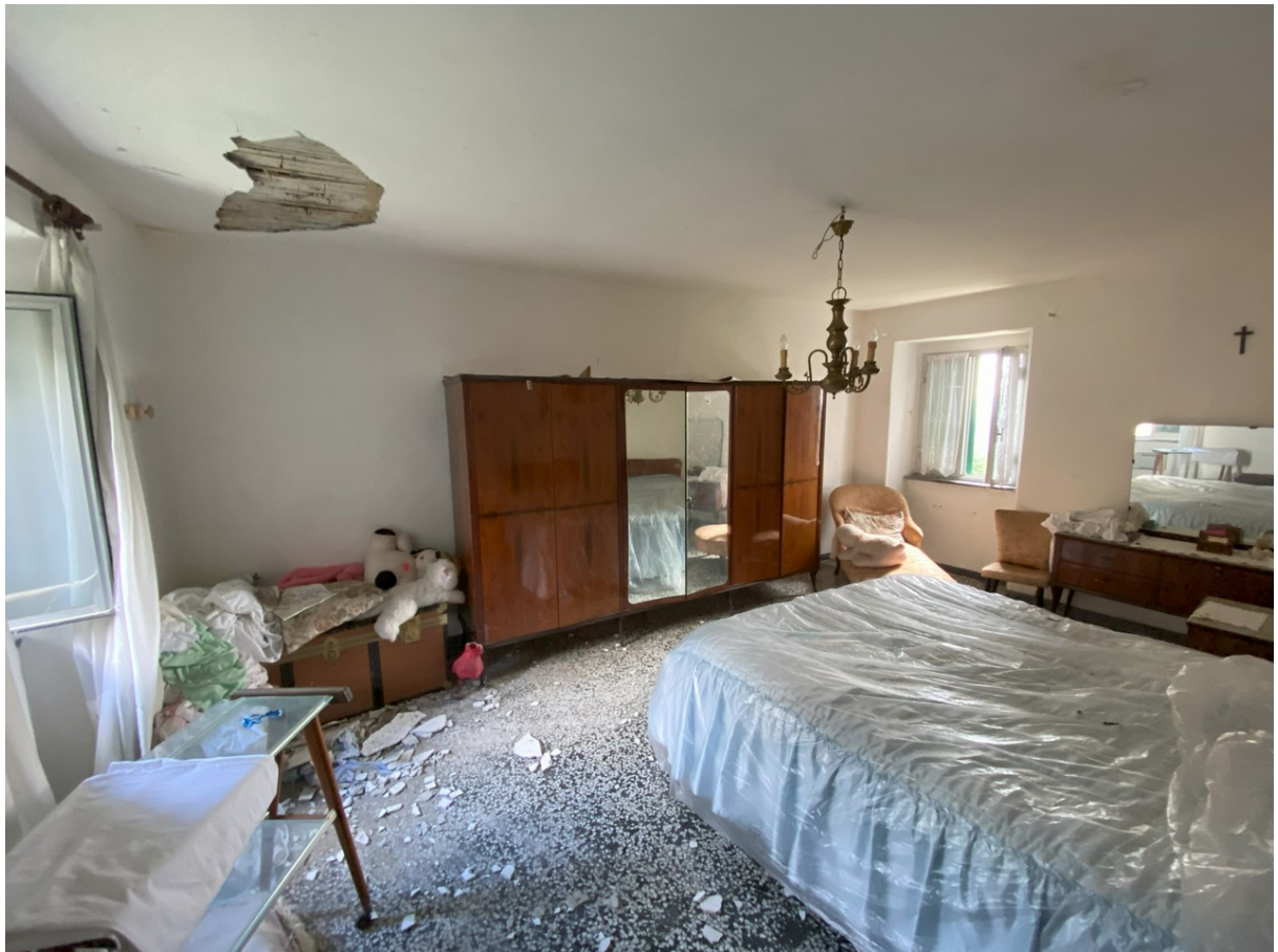
Foto 11 – la porzione al P1 con l'infiltrazione dal tetto di copertura