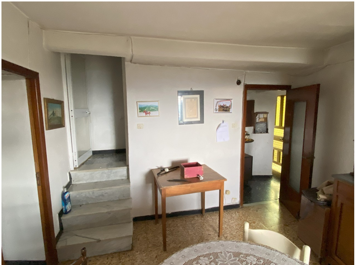
Foto 8 – la porzione al PT con la scala di accesso al piano superiore