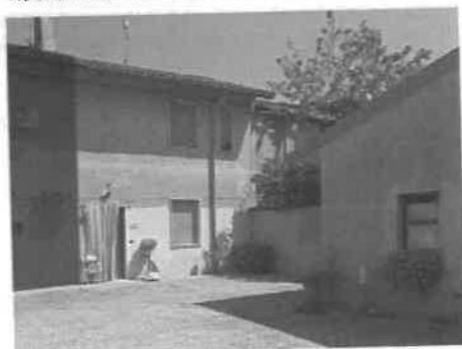
VISTA DELL'ABITAZIONE DAL CORTILE COMUNE