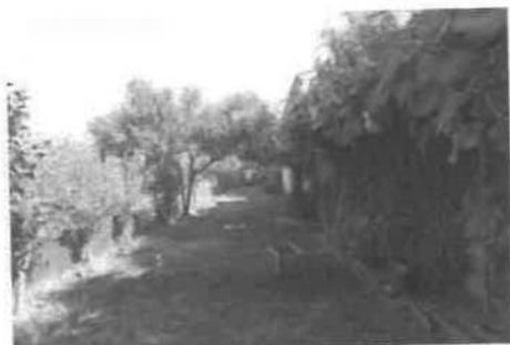
VISTA DEL BROLO VERSO NORD