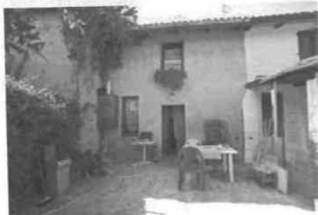
VISTA DEL BROLO VERSO L'ABITAZIONE