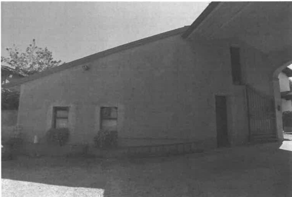
VISTA AUTORIMESSA, RIPOSTIGLIO E LEGNAIA