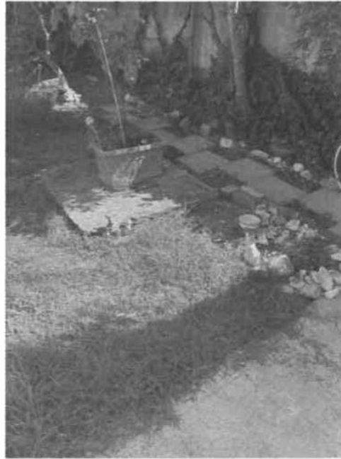
FOSSA SETTICA COLLEGATA CON LA FOGNATURA