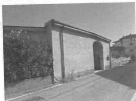
VISTA DELL'ANDRONE DI ACCESSO AL COMPENDIO