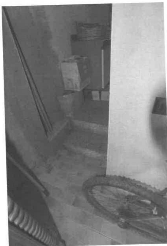
PASSAGGIO TRA AUTORIMESSA E RIPOSTIGLIO ESTERNO