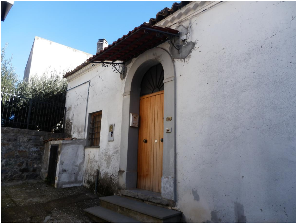
Foto 15 - superfetazioni illegittime: box esterno e pensilina (Corpo A)