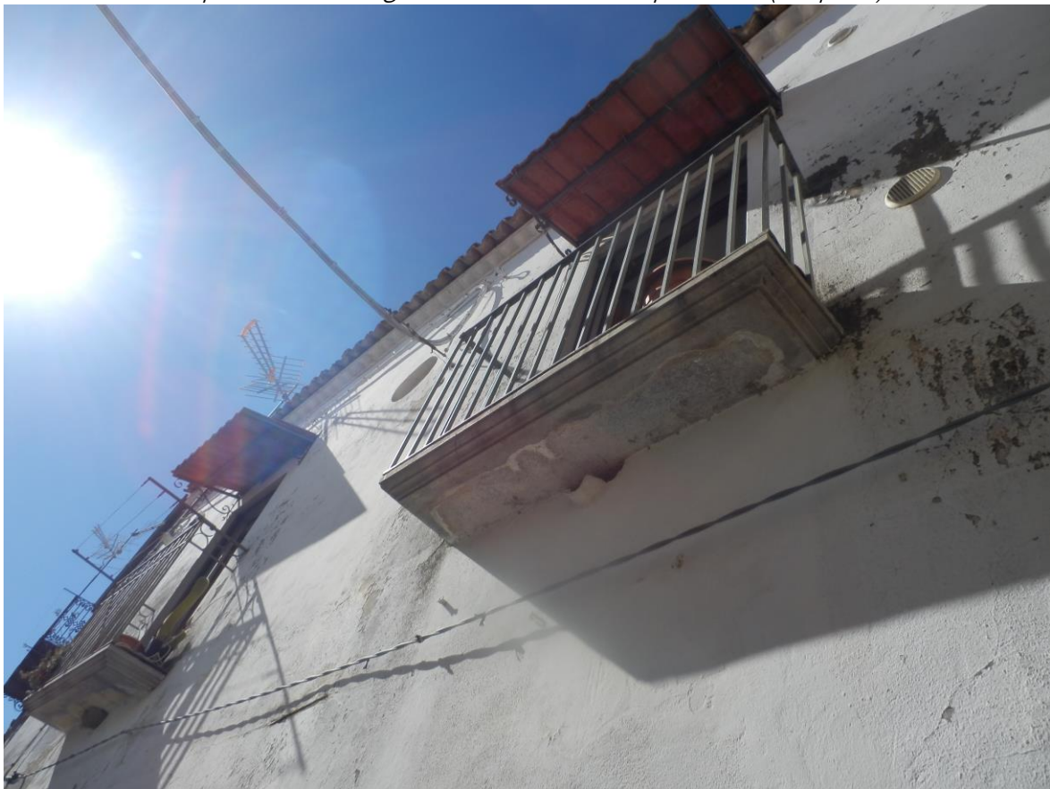
Foto 16 - superfetazioni illegittime: pensiline sui balconcini (Corpo A)