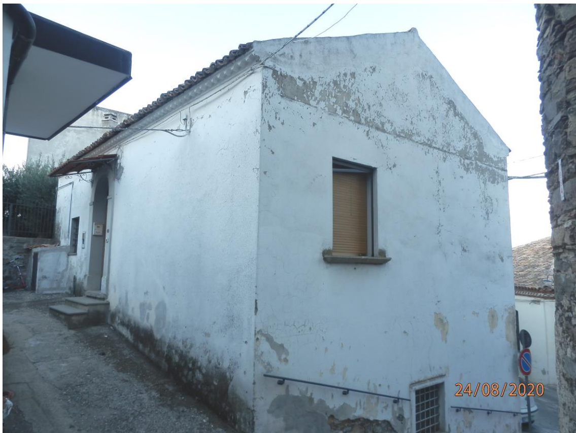
Foto 2 - vista dell'edificio dalla discesa di via Cirillo