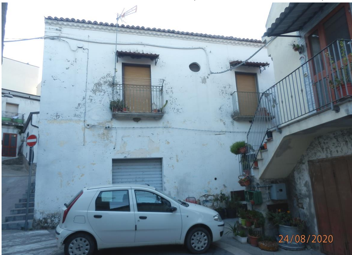
Foto 1 - vista dell'edificio da via dei Caduti

DOCUMENTAZIONE FOTOGRAFICA (24/08/2020 e 16/02/2021)