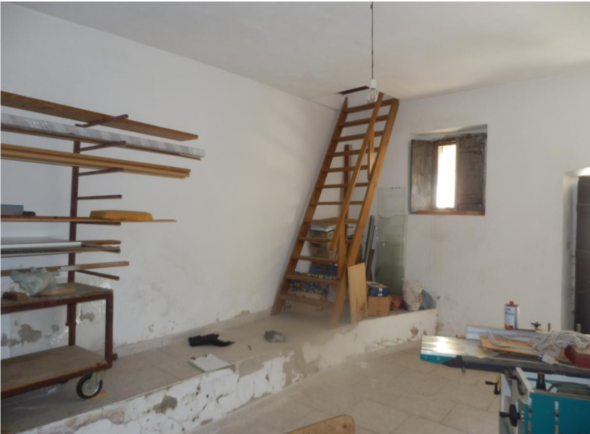
Foto 14 - scala di collegamento dalla cantina (Corpo B) all'abitazione (Corpo A)