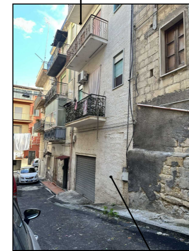
Ingresso CLUSO Via Formia 2