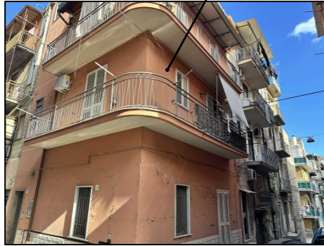
Angolo Via Tevere-Via Bovio