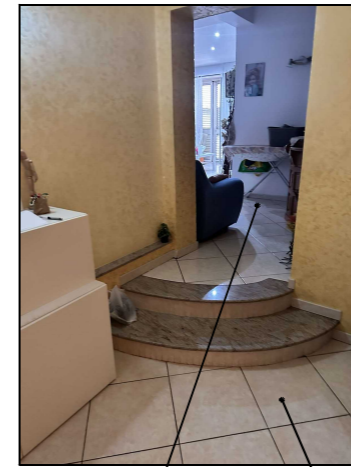
Interno/Comunicazione Via Tevere-Via Formia

Via Formia 2 Fg. 78 Part. 814 Sub. 3 P.2. Cat. A/4 Vani 3,5 IMMOBILE 2