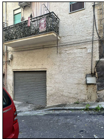
Ingresso Via Formia 4

Ingresso Via Formia 4 Fg. 78 Part. 814 Sub. 1 P.T. Cat. C/6 Mq. 57 IMMOBILE 1