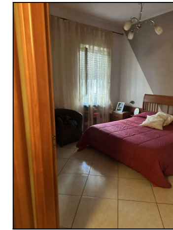
Interno Via Formia