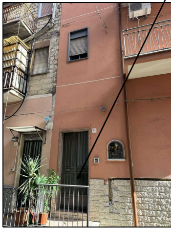
Ingresso Via Tevere 13

Via Tevere 13 Fg. 78 Part. 1040 Sub. 2 P.1. Cat. A/4 Vani 3-IMMOBILE 1