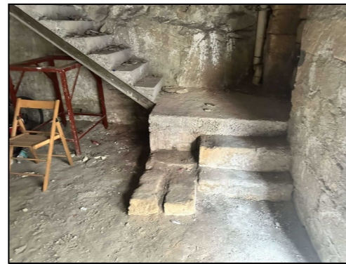
Ingresso Via Formia 4