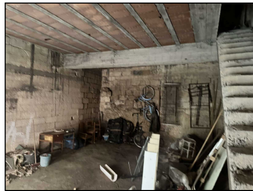
Interno Via Formia 4