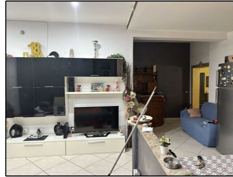
Interno Via Tevere-Via Bovio

Via Formia 2 Fg. 78 Part. 814 Sub. 3 P.2. Cat. A/4 Vani 3,5 IMMOBILE 2