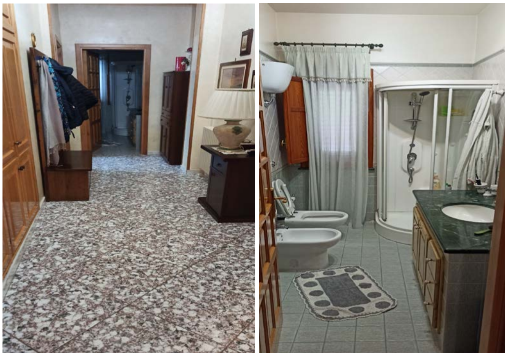
Foto n.6 / 7 – Visuale corridoio / disimpegno che permettere di giungere ai vani cucina e w.c. adiacente