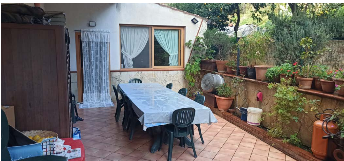
Foto n. 14 – Terrazzino posto sul retro del fabbricato con annesso corpo di fabbrica oggetto di istanza di sanatoria ai sensi della legge 724/94 n. 003501 del 31.03.1995.

Salita che permette di giungere al terrazzino posto sul retro del fabbricato.