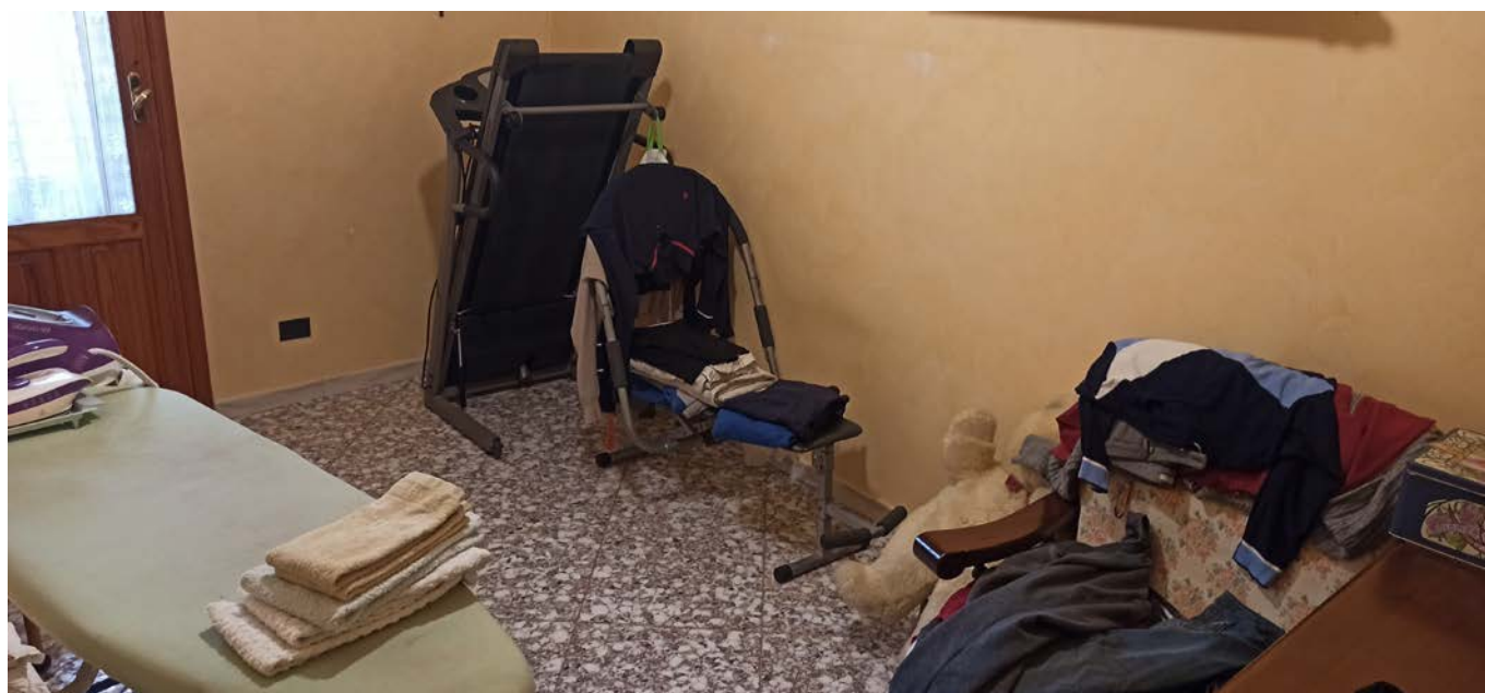
Foto n.10 / 11 / 12 – Vani letto / ripostiglio presenti nella zona notte