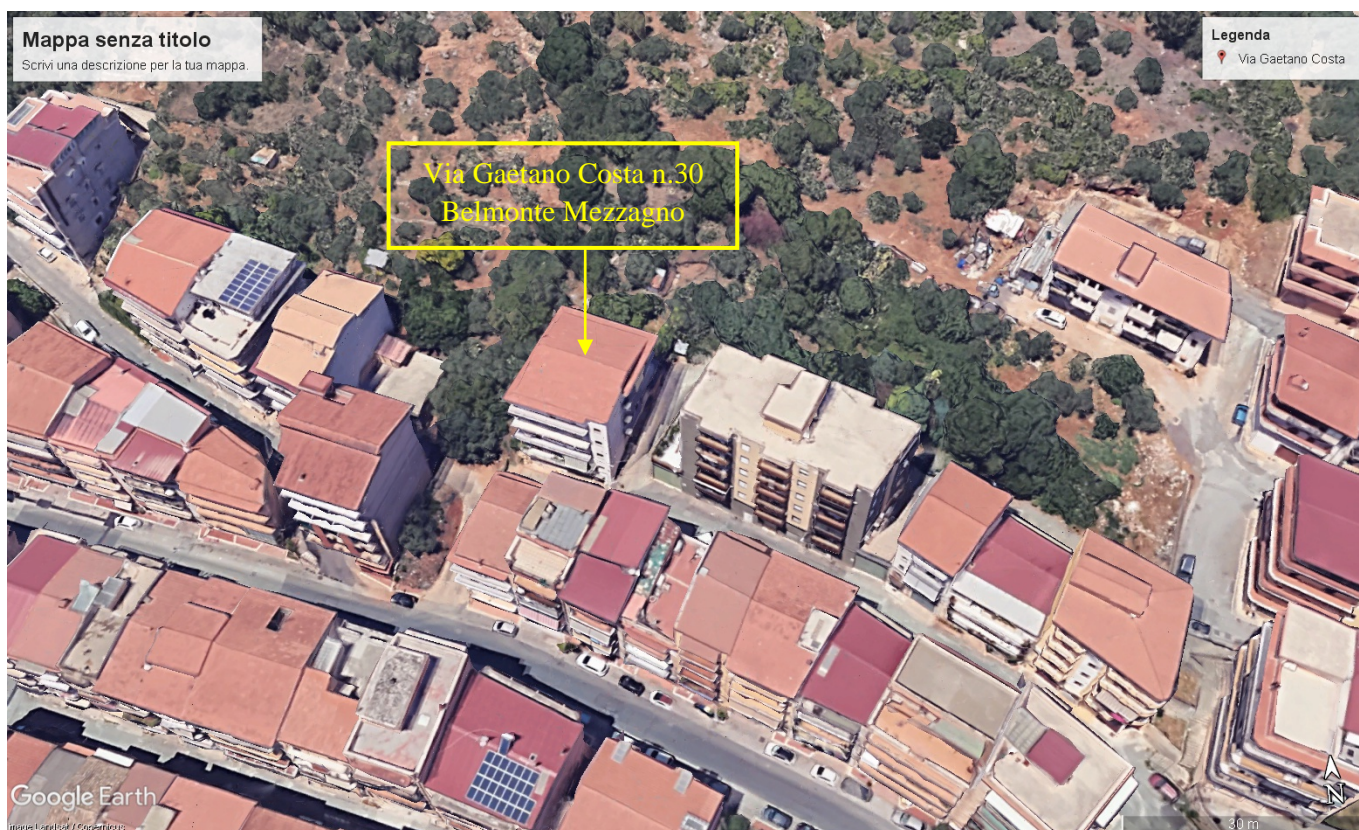
Foto Aerea 2