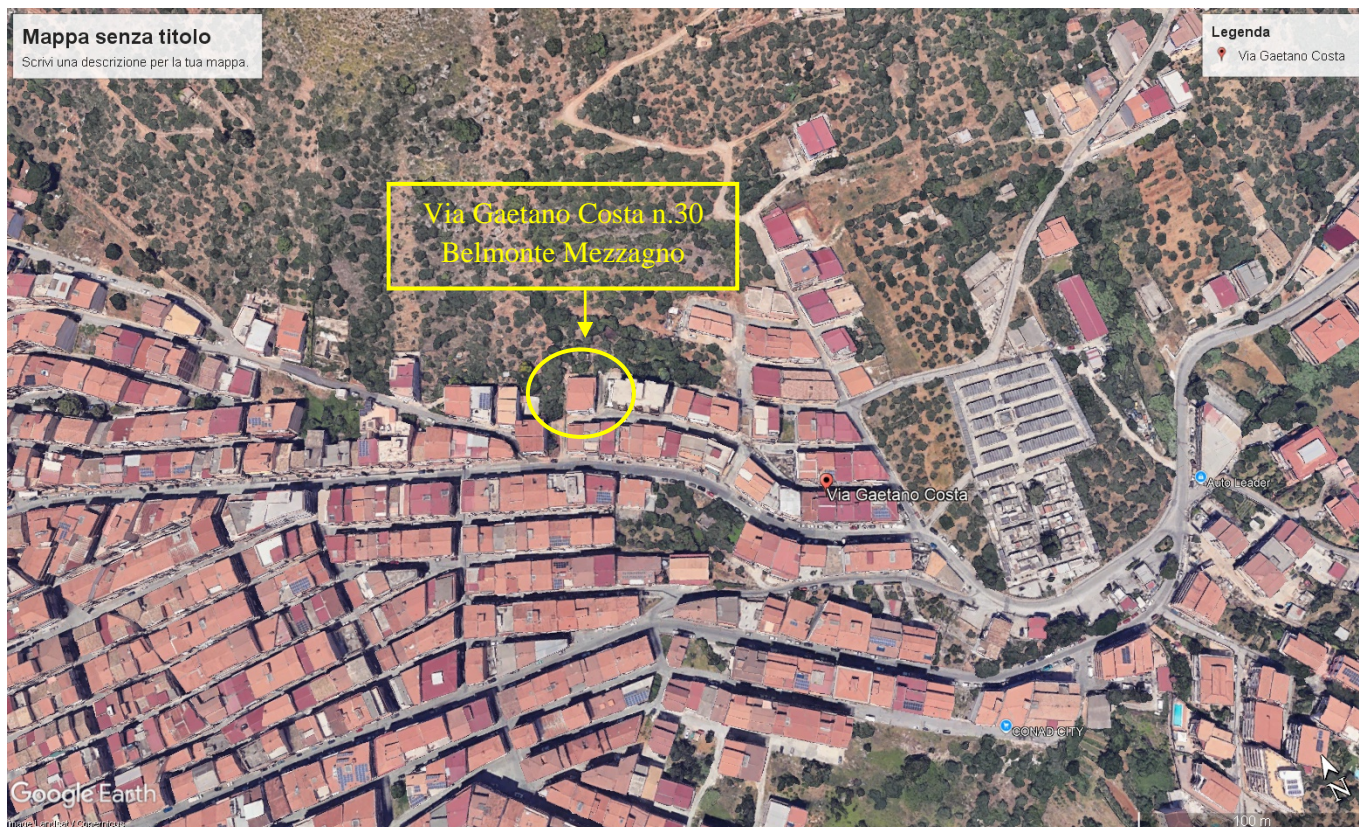
Foto Aerea 1