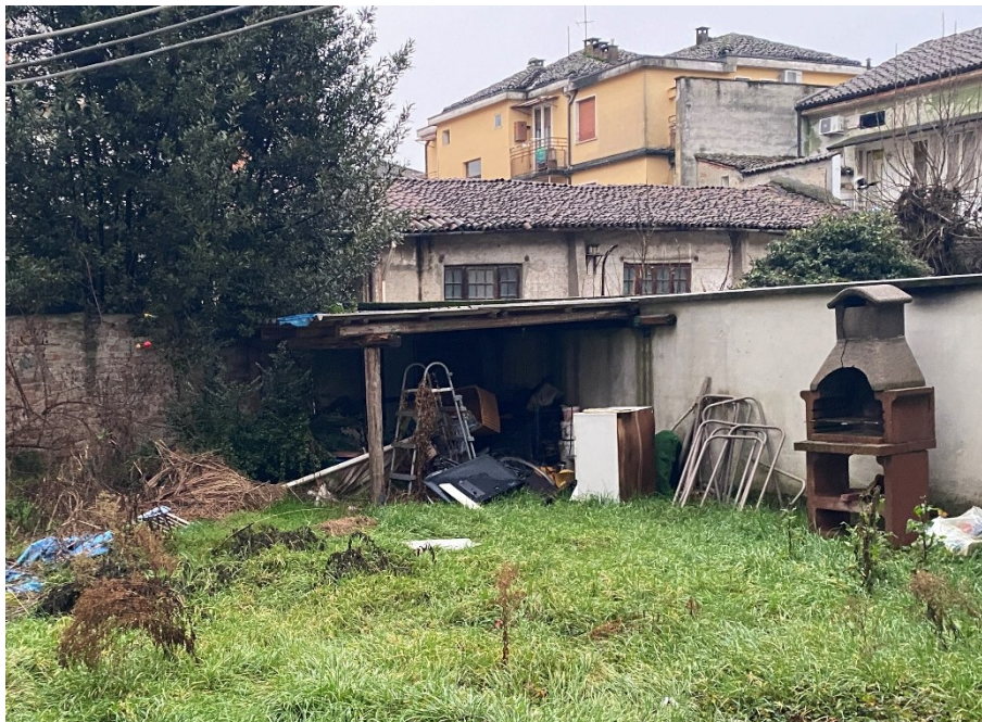
Foto 1 - Portico

L'immobile oggetto di stima presenta un portico in legno realizzato in assenza di titolo edilizio (Foto 1).