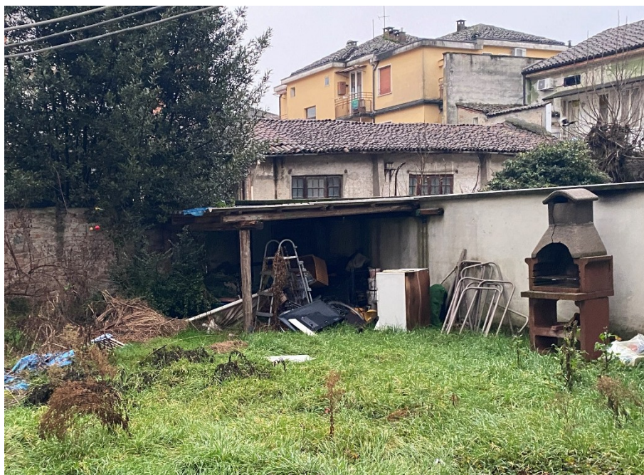
Foto 2 - Rifiuti