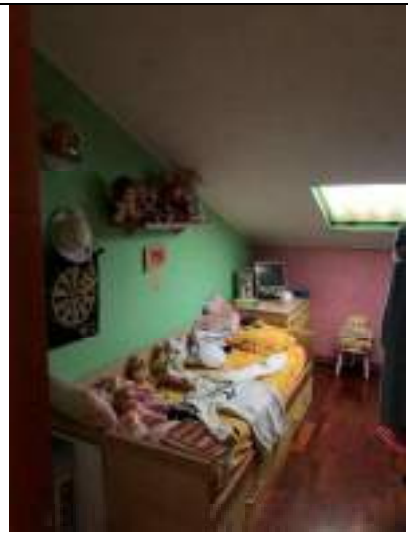
Vista della seconda camera da letto