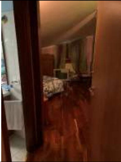
Vista dell'ingresso alla camera da letto