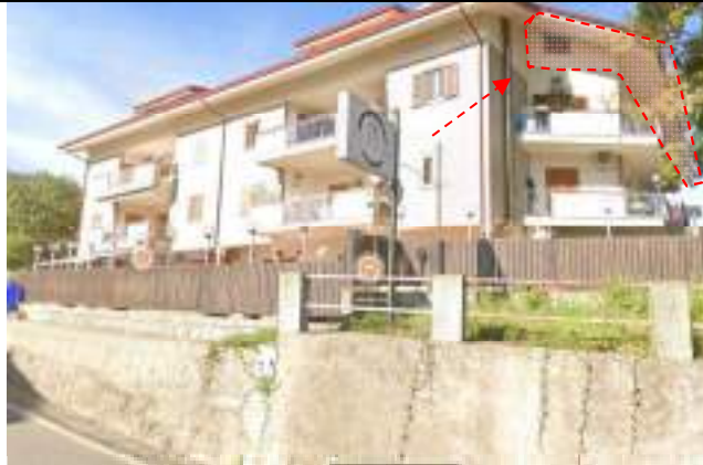
Vista dello stabile da [redacted] i – fronte SUD