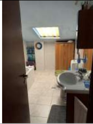
Vista del bagno