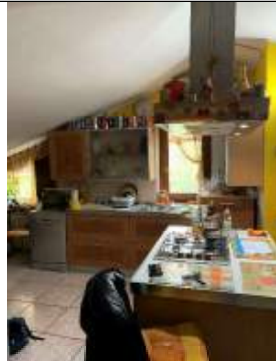
Vista della zona giorno - cucina