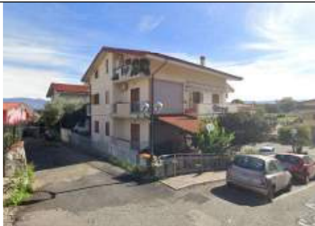
Vista dello stabile da [redacted] – fronte OVEST