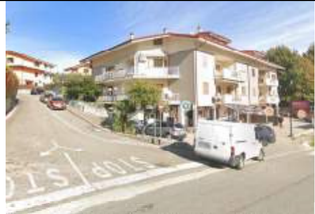
Vista dello stabile da via Morroni incrocio [redacted] – fronte OVEST