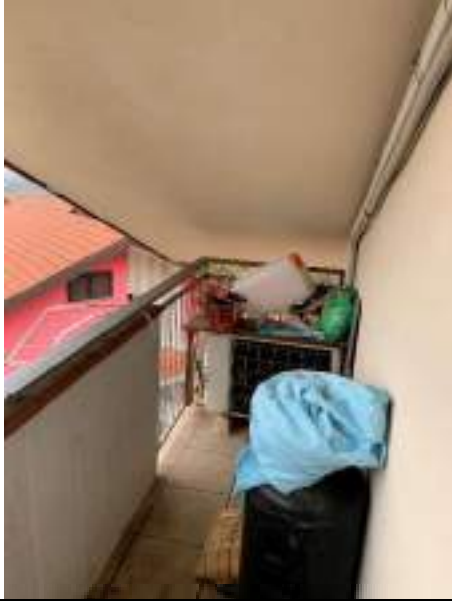
Vista del balcone