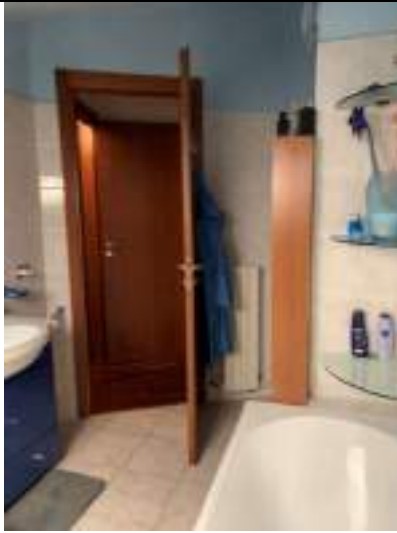
Vista del bagno