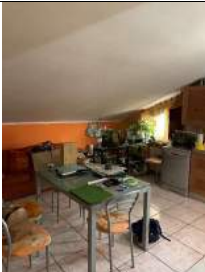
Vista della zona giorno - cucina