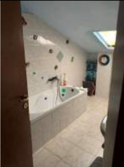
Vista del bagno