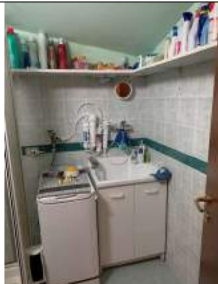
Vista del locale di servizio