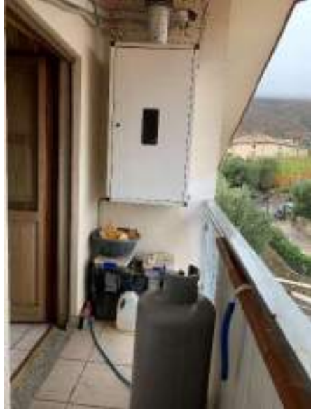
Vista del balcone