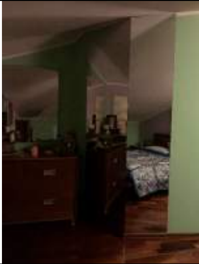
Vista della prima camera da letto