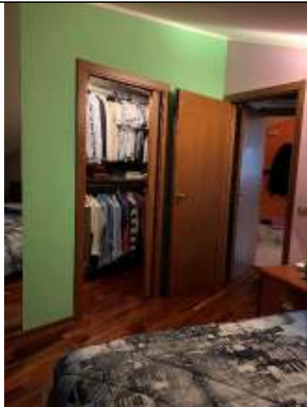
Vista della prima camera da letto