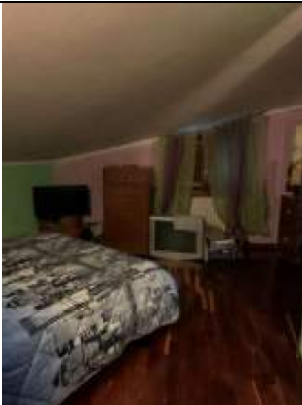
Vista della prima camera da letto