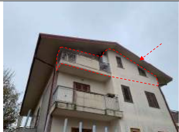
Vista dell'immobile dalla corte interna – fronte NORD