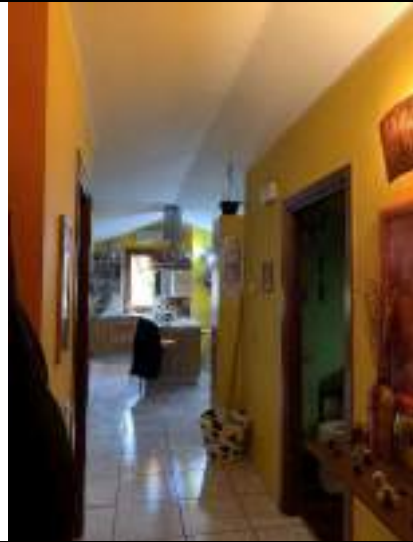
Vista del disimpegno