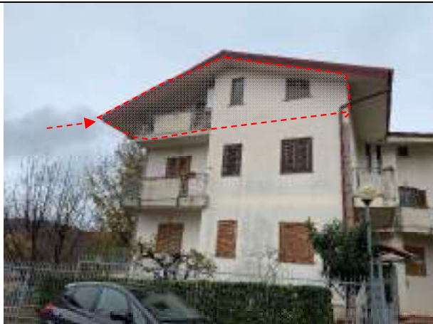
Vista dell'immobile dalla corte interna – fronte NORD