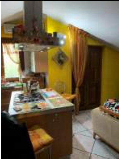
Vista della zona giorno - cucina