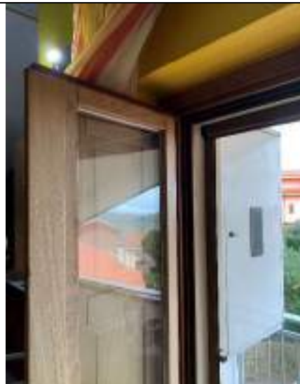
Vista degli infissi esterni