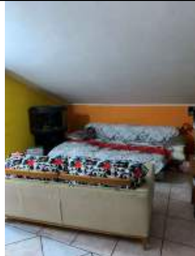
Vista della zona giorno - soggiorno