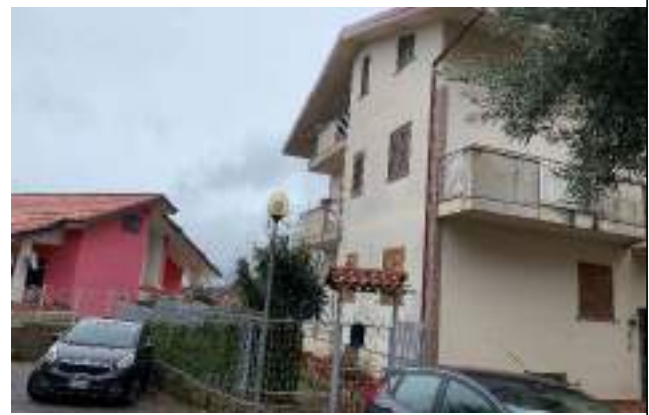
Vista dell'immobile dalla corte interna – fronte NORD