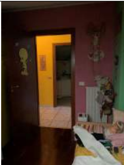
Vista della seconda camera da letto