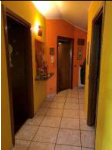
Vista del disimpegno