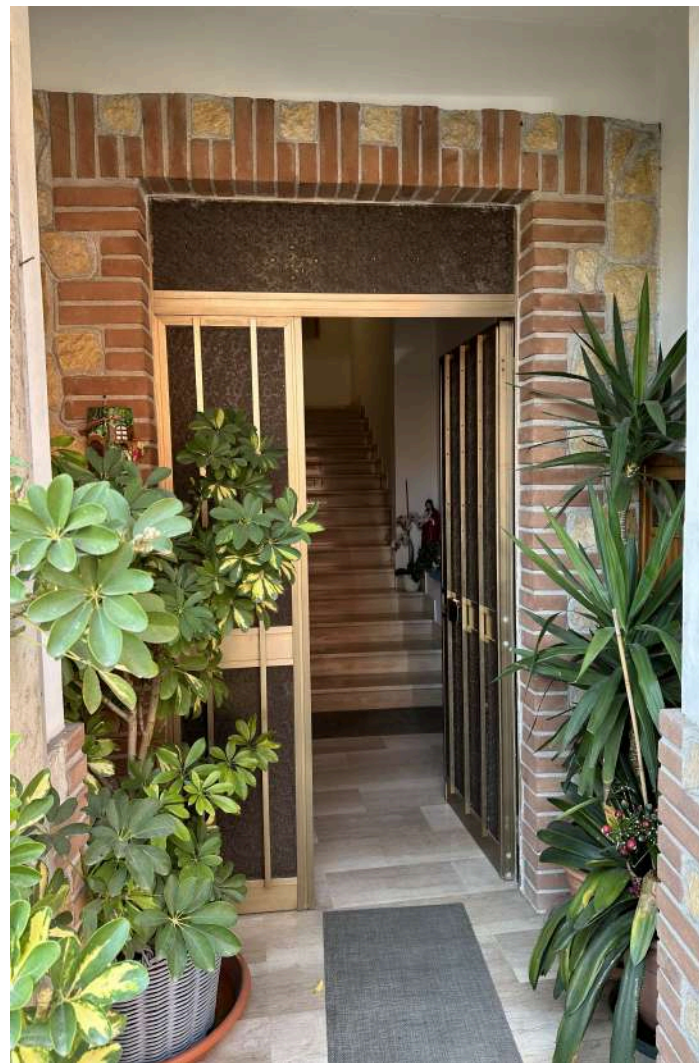
L'INGRESSO SU STRADA