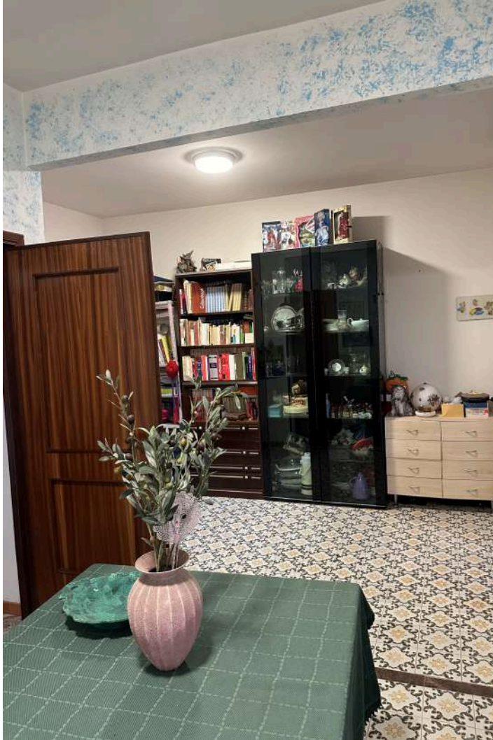
SALA - PRANZO