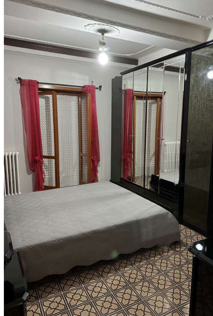
CAMERA DA LETTO 2