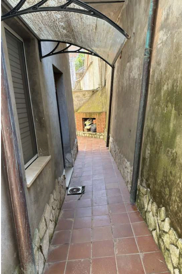
IL CORTILE INTERNO