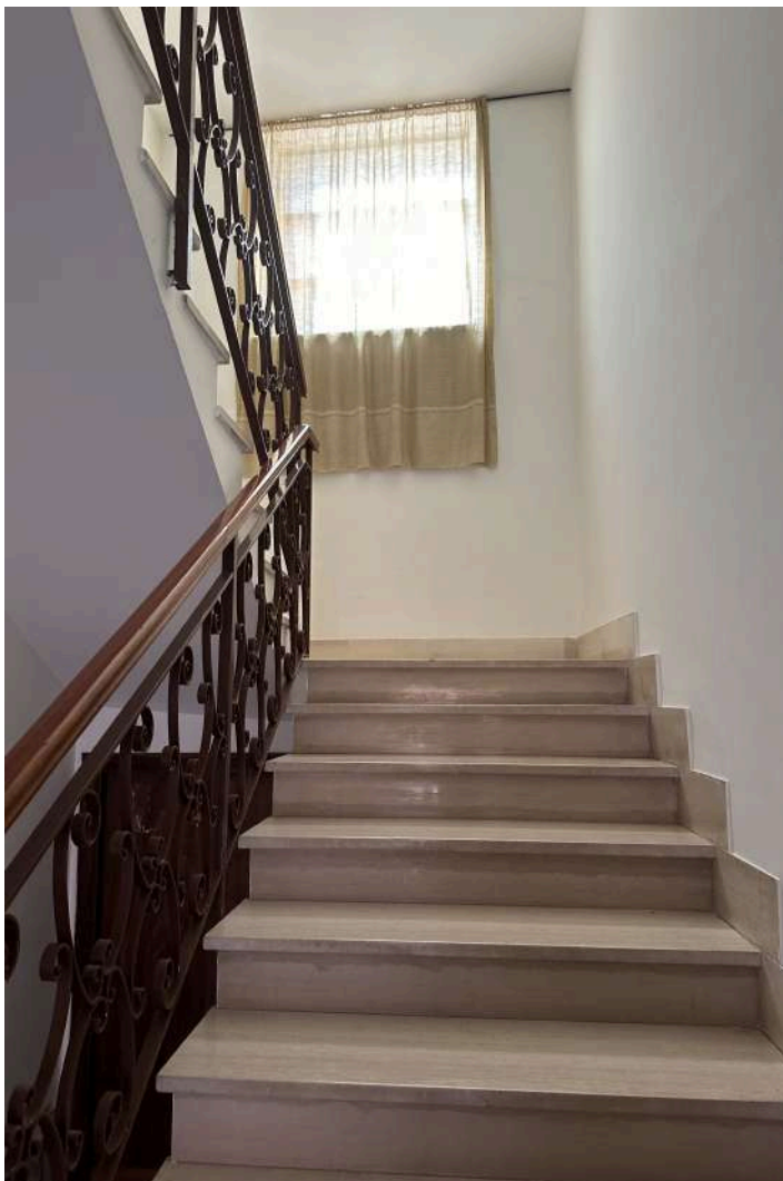
LA SCALA COMUNE DI ACCESSO ALL'IMMOBILE