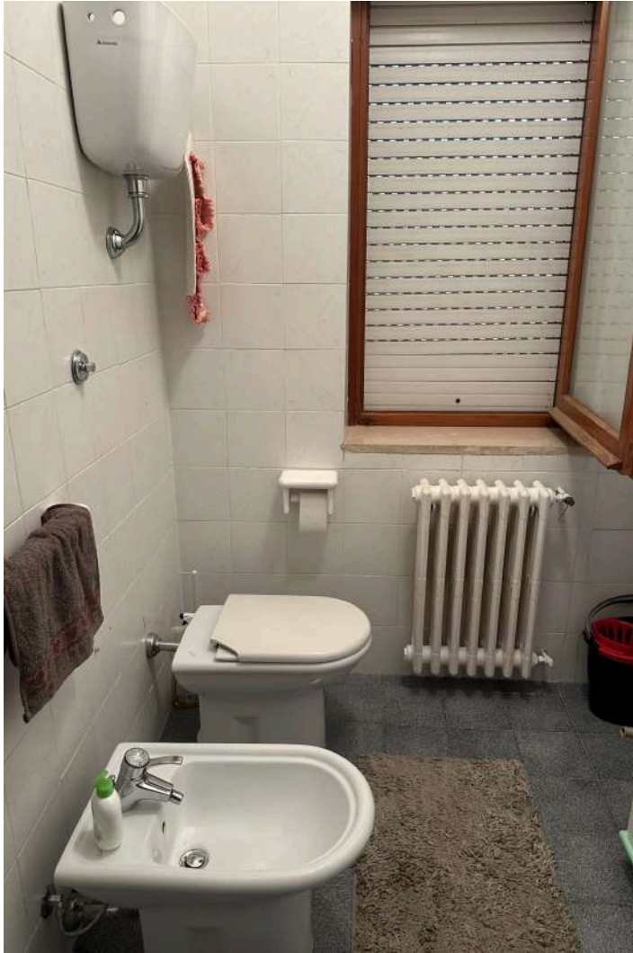
I SANITARI DEL BAGNO