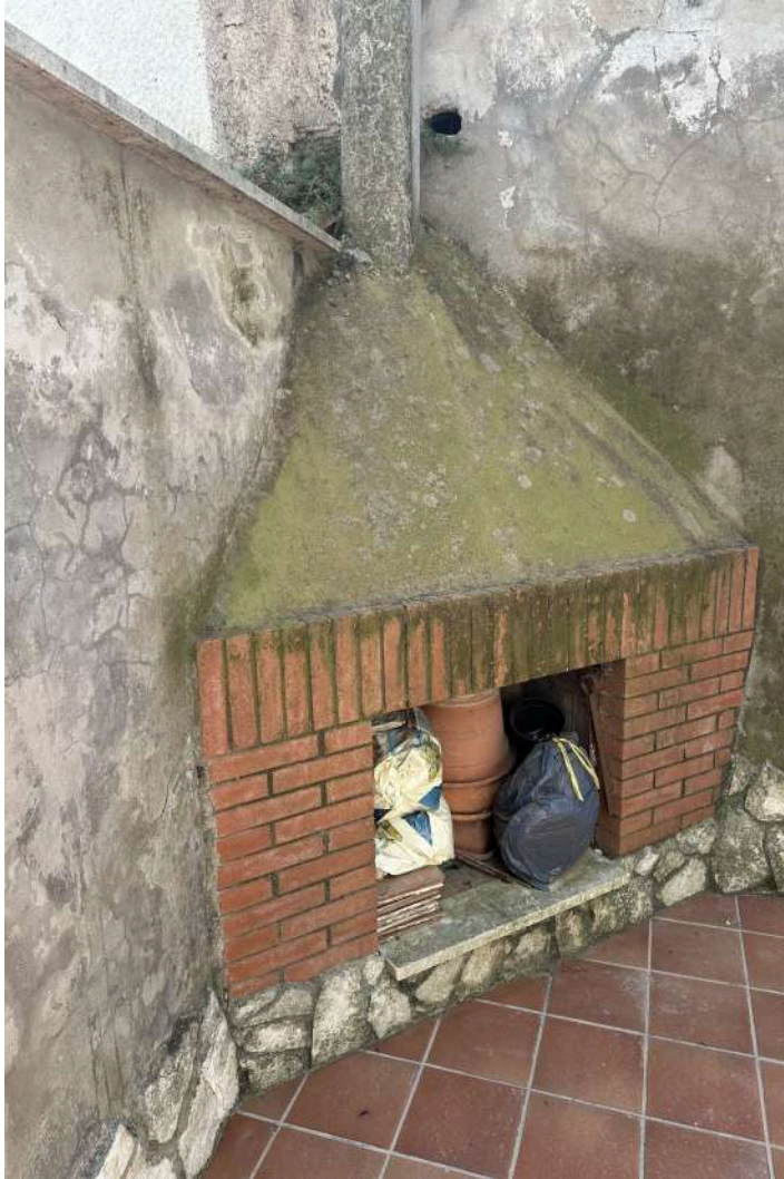
IL CAMINO NEL CORTILE INTERNO