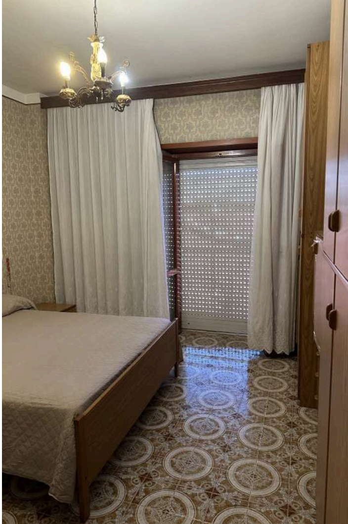
CAMERA DA LETTO 1