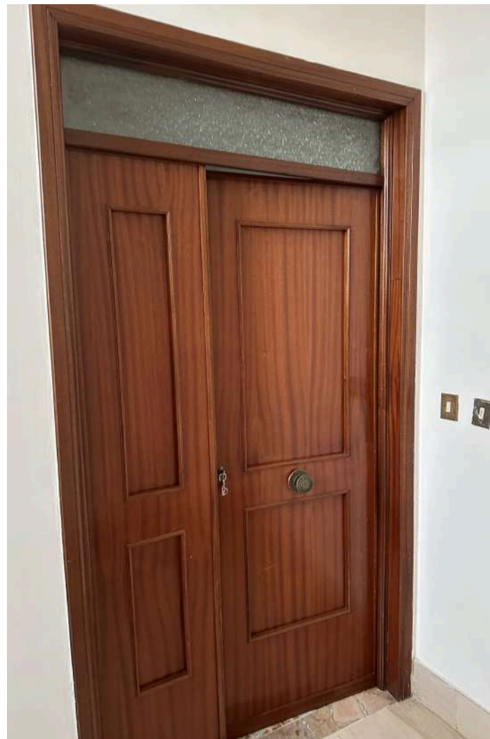
L'INGRESSO SU PIANEROTTOLO