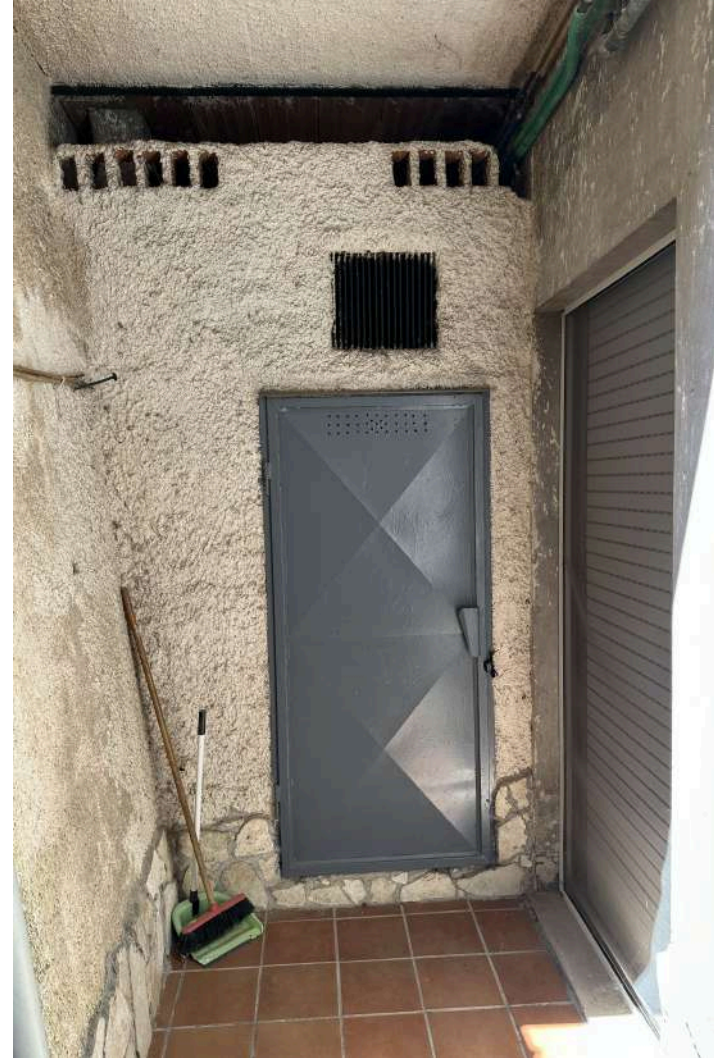
IL LOCALE DEPOSITO DA SANARE