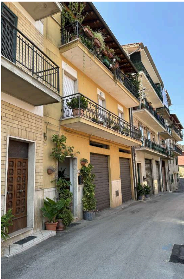
IL PROSPETTO SU STRADA