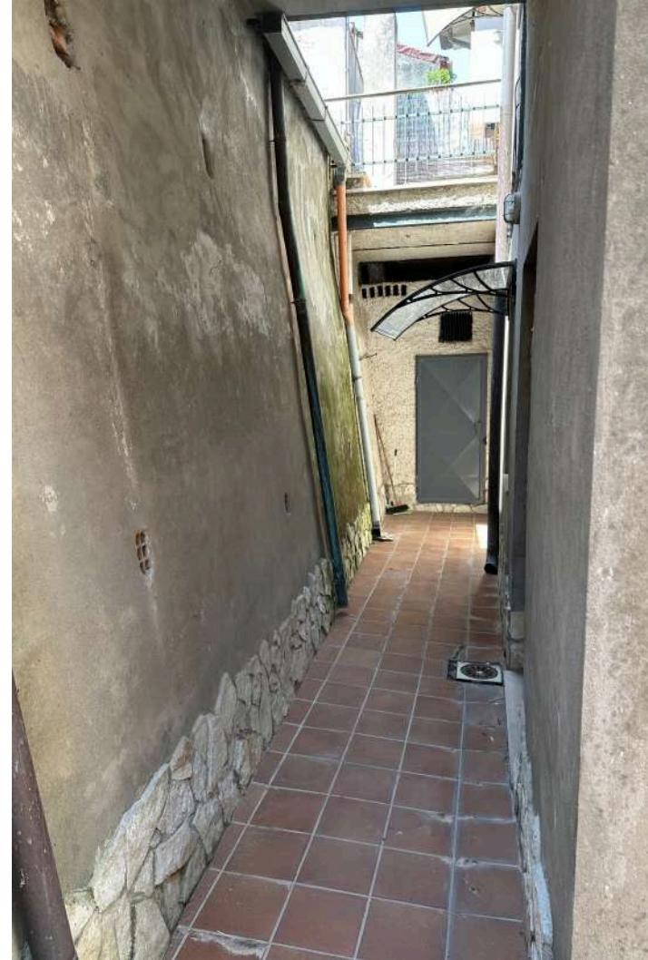
IL CORTILE INTERNO