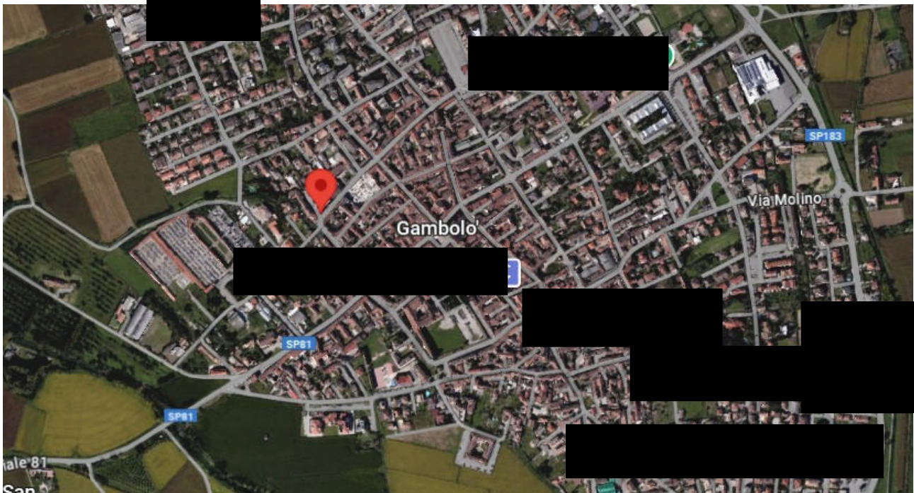
Vista aerea con indicazione dell'immobile – Gambolò - via Fiume 27

Viale A. Necchi 4 27100 Pavia Tel. 3392772355 e-mail nverdi2@gmail.com P.IVA 01806320188