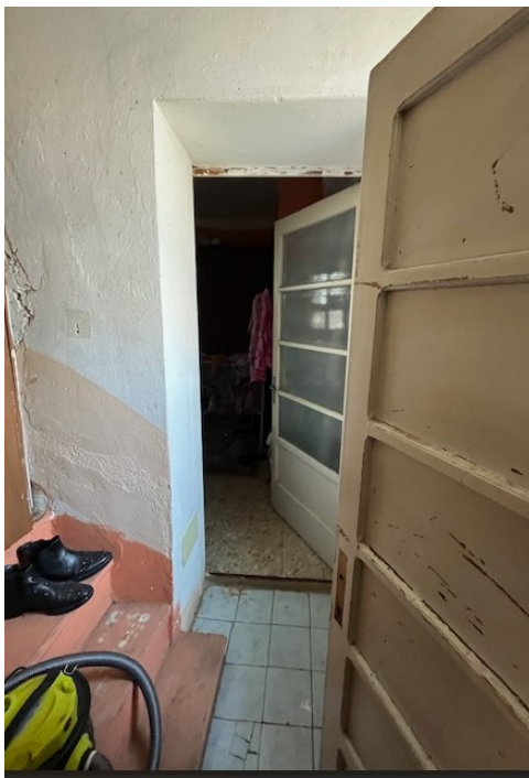
Disimpegno in lato nord tra le due camere

Viale A. Necchi 4 27100 Pavia Tel. 3392772355 e-mail nverdi2@gmail.com P.IVA 01806320188