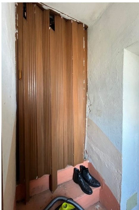
Porta di accesso al sottotetto non accessibile