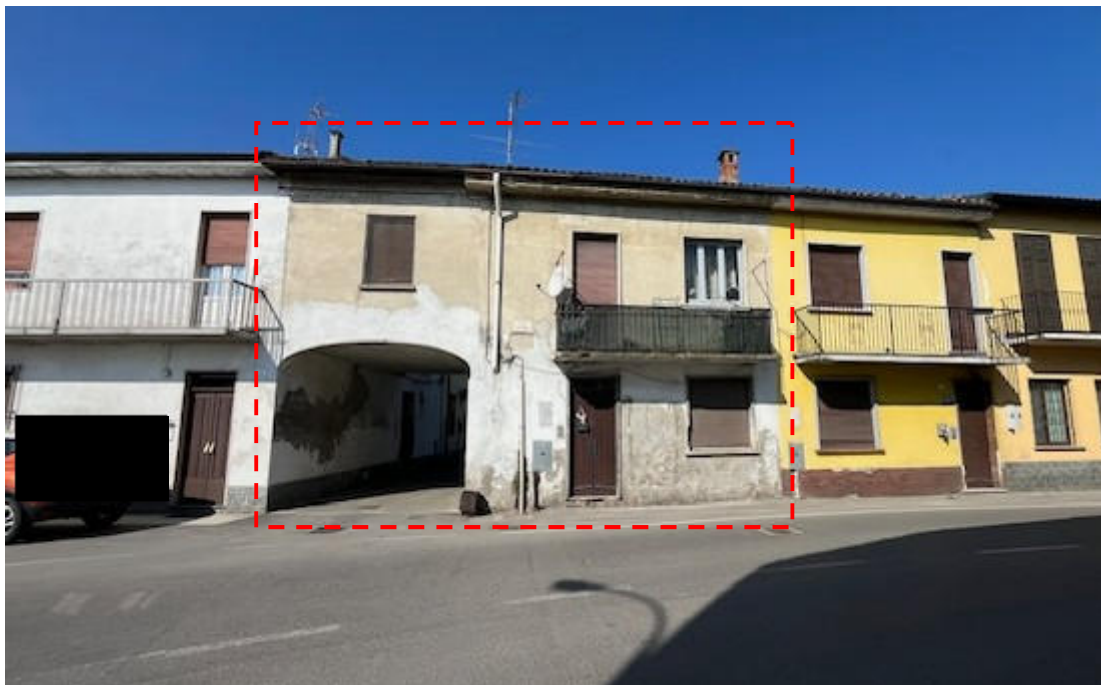
Vista dell'immobile da via Fiume - lato sud