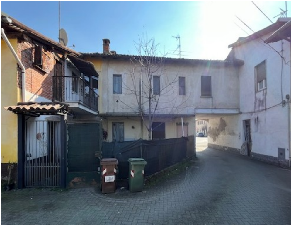
Vista dell'immobile dal cortile comune - lato nord

Viale A. Necchi 4 27100 Pavia Tel. 3392772355 e-mail nverdi2@gmail.com P.IVA 01806320188