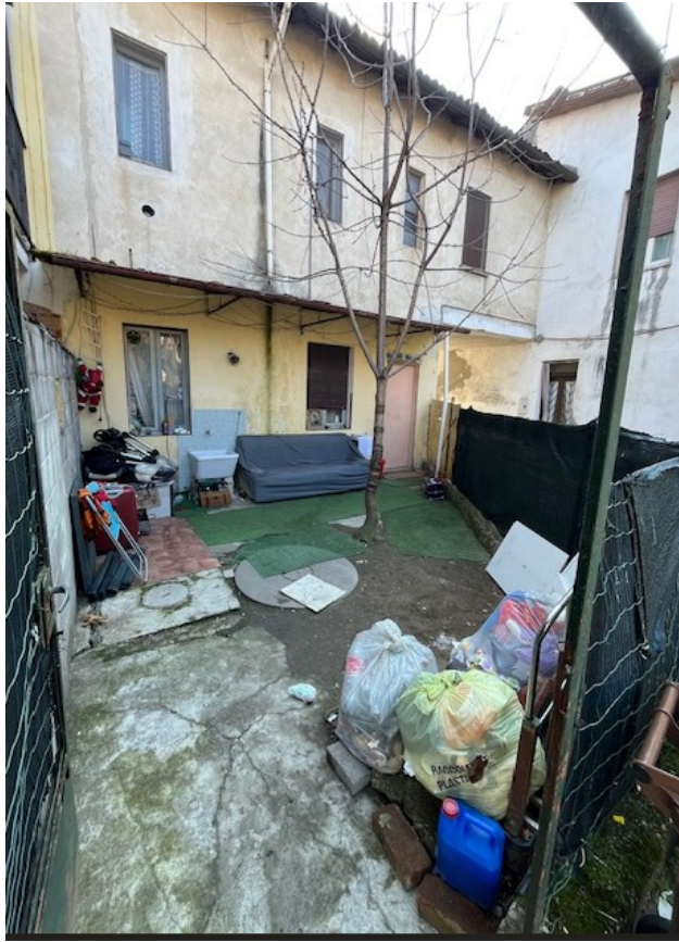
Cortile di pertinenza dell'abitazione – lato nord

Viale A. Necchi 4 27100 Pavia Tel. 3392772355 e-mail nverdi2@gmail.com P.IVA 01806320188