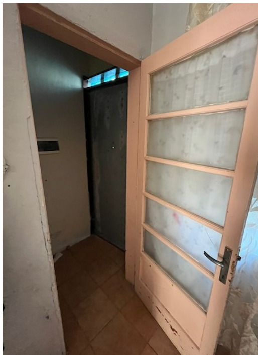
Disimpegno con porta di uscita verso il cortile nord

Viale A. Necchi 4 27100 Pavia Tel. 3392772355 e-mail nverdi2@gmail.com P.IVA 01806320188