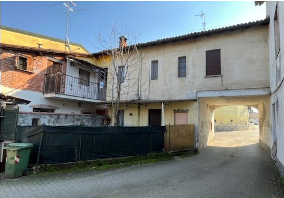
Vista dell'immobile dal cortile comune - lato nord