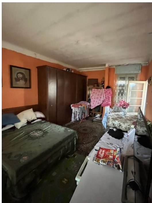
Camera in lato ovest