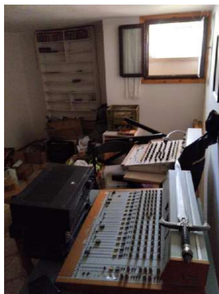
Locale rialzato p. interrato sub 2