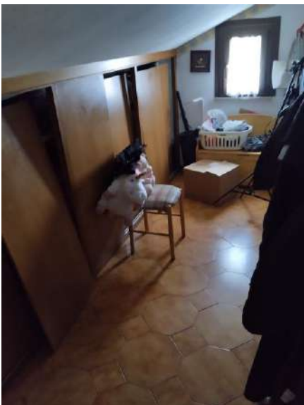
ripostiglio-guardaroba p. primo sub 1