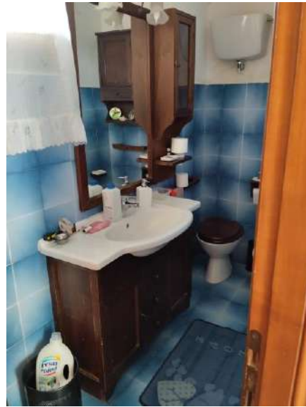
Bagno piano primo sub 1