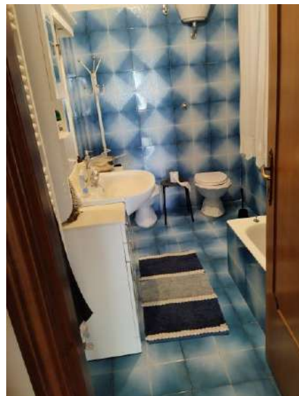
Bagno 2^ camera p. primo sub 1