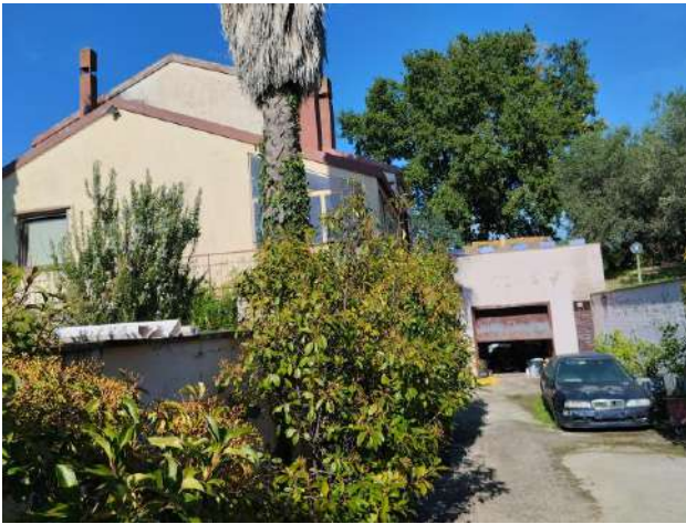
Garage p. interrato sub 2