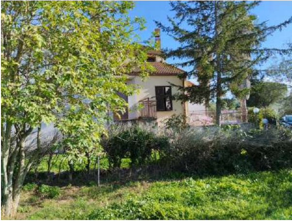
Accesso lato ovest sub 1