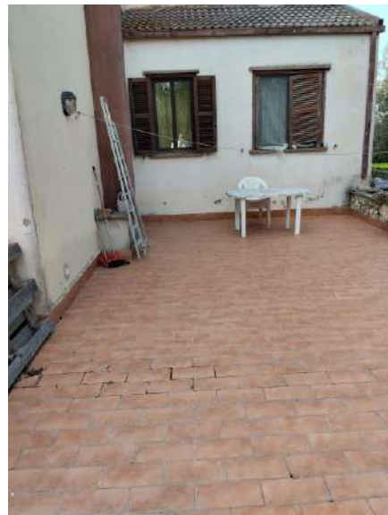
Terrazzo p. terra sub 2