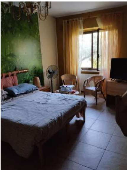
Camera p. terra sub 2