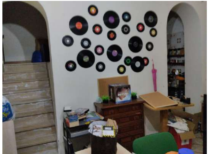
Scala accesso ambienti rialzati p. interrato sub 2