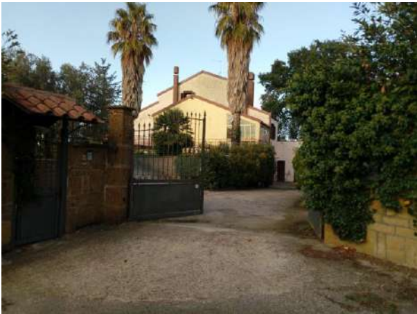
Ingresso immobili esegutati da strada Felcete