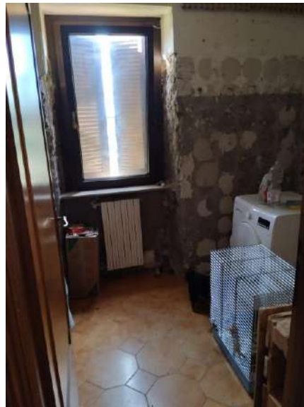
Bagno p. terra sub 1