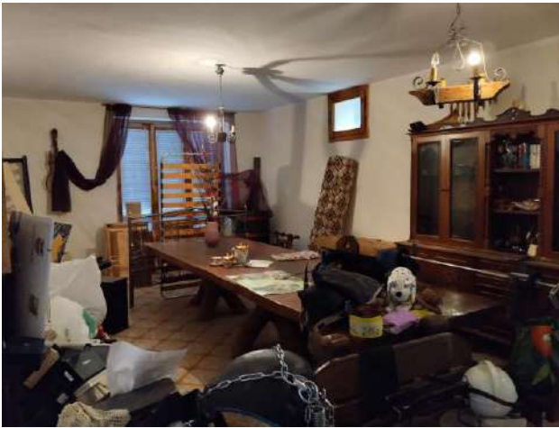
1° locale p. interrato sub 2