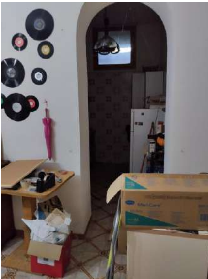
Ambiente con accesso 2° locale p. int. sub 2