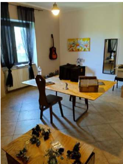
Sala p. terra sub 1