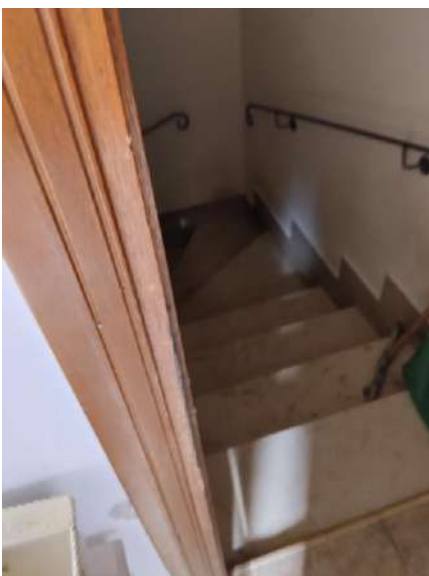
Scala accesso interrato sub 2