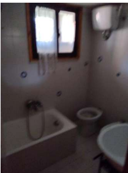
Bagno rialzato p. interrato sub 2