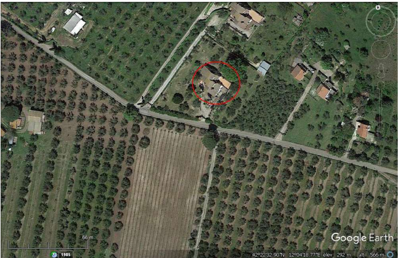
Individuazione compendio edilizio pignorato e terreno di pertinenza