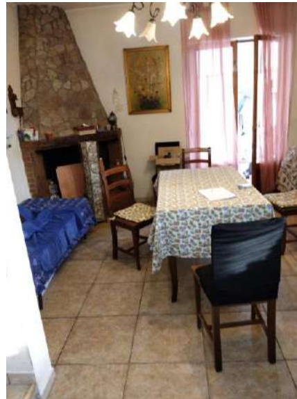
Cucina p. terra sub 2