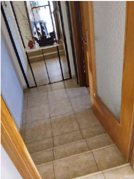
Accesso al bagno al p. terra sub 1