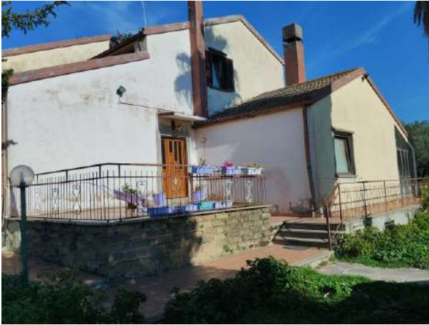
Accesso lato sud sub 2