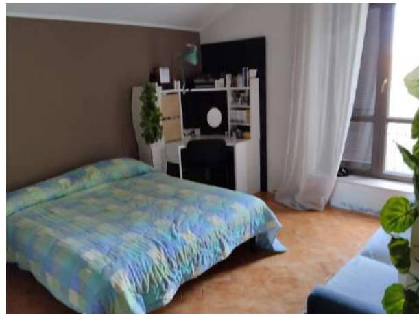
2^ camera p. primo sub 1