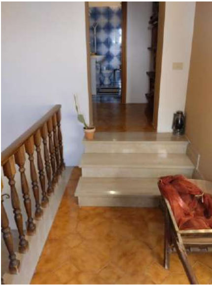
Disimpegno p. primo sub 1