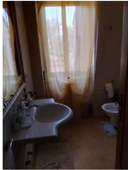
Bagno p. terra sub 2