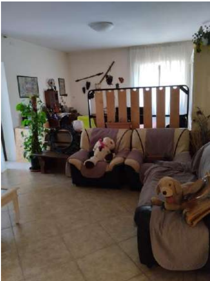
Salone p. terra sub 2