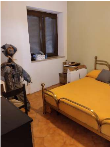
1^ Camera p. primo sub 1