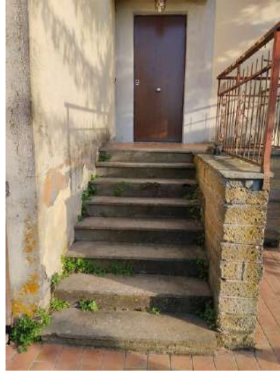
Ingresso sub 1