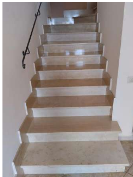
Scala accesso p. primo sub 1