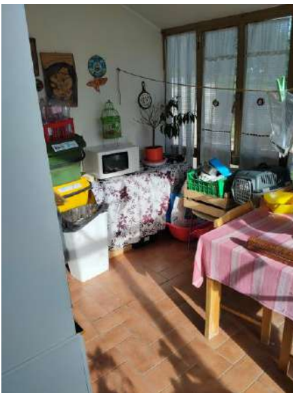
Veranda chiusa p. terra sub 2