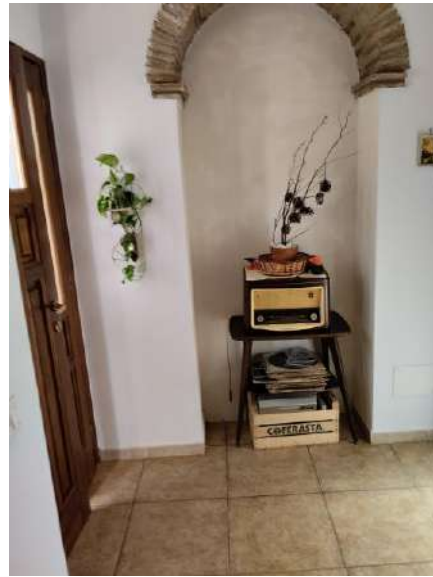
Ingresso p. terra sub 2