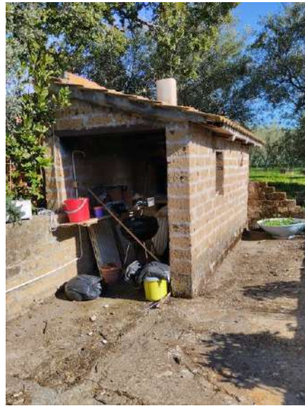
Ricovero attrezzi – forno non colpito dal pignoramento