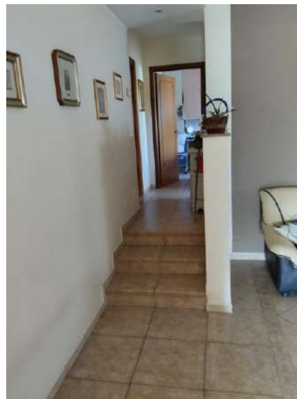
Dal salone verso camere p. terra sub 2