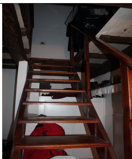
PARTICOLARE SCALA DI ACCESSO AL SOPPALCO