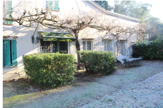
PARTICOLARE PROSPETTO SUD OVE POSTO L'IMMOBILE LOTTO 1