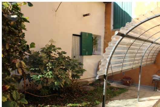
PARTICOLARE DELL'ACCESSO ALLA CENTRALE TERMICA, AUTONOMO RISPETTO ALL'APPARTAMENTO E DA CORTE RECINTATA A BENEFICIO ESCLUSIVO DI ALTRI SOGGETTI