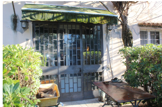
PORTONE DI INGRESSO ALL'APPARTAMENTO