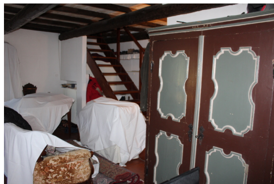
SOGGIORNO E SCALA