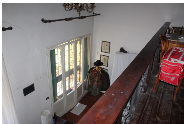
VISTA DAL SOPPALCO VERSO IL SOGGIORNO