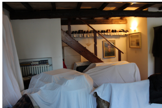
SOGGIORNO. SI NOTA SUL FONDO LA SCALA DI ACCESSO AL SOPPALCO ADIBITO A CAMERA DA LETTO