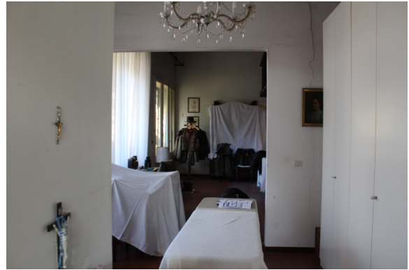
VISTA DEL SOGGIORNO