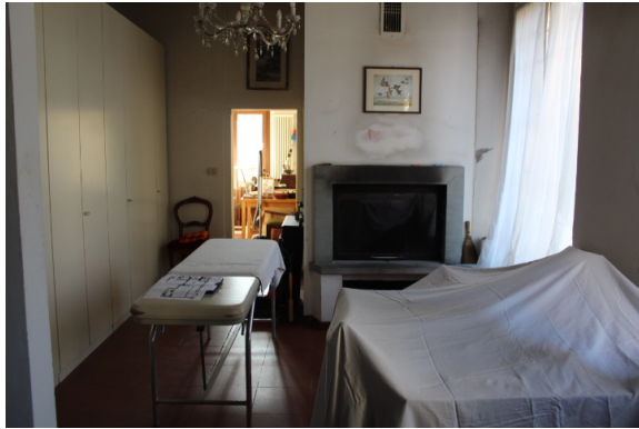
PARTICOLARE DEL CAMINO NEL SOGGIORNO