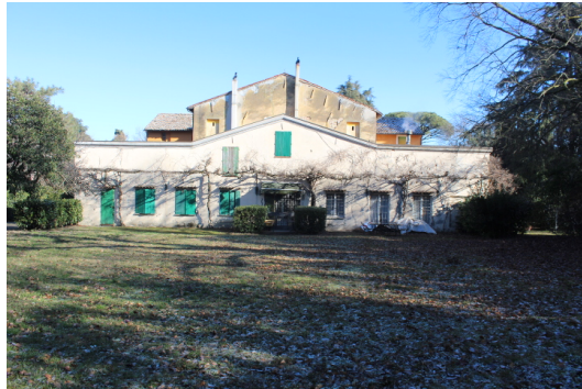
PROSPETTO SUD DI VILLA MERENDA (ove posto l'immobile del Lotto 2)

(si omettono le foto degli esterni in quanto già inserite sopra)