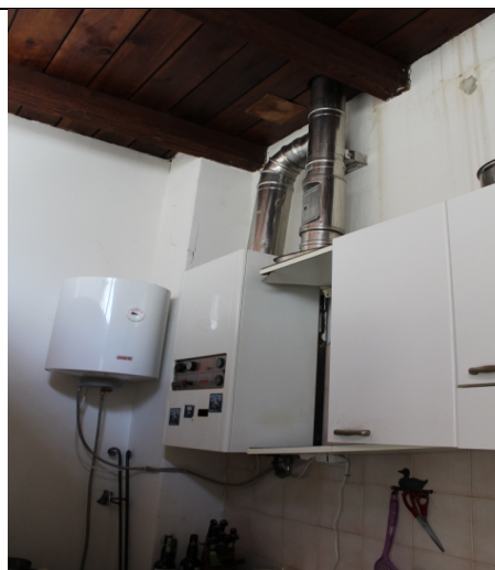
PARTICOLARE CANNA DI ESPULSIONE FUMI DELLA CALDAIA. SI NOTANO INFILTRAZIONI D'ACQUA DAL SOFFITTO