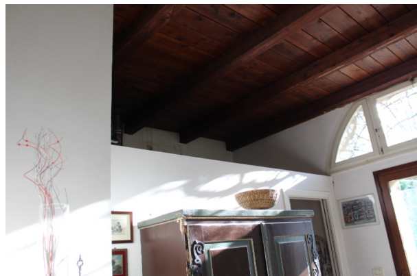
PARTICOLARE DEL SOFFITTO ZONA PRANZO