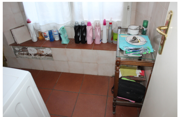
PARTICOLARE DI MATTONELLE STACCATE