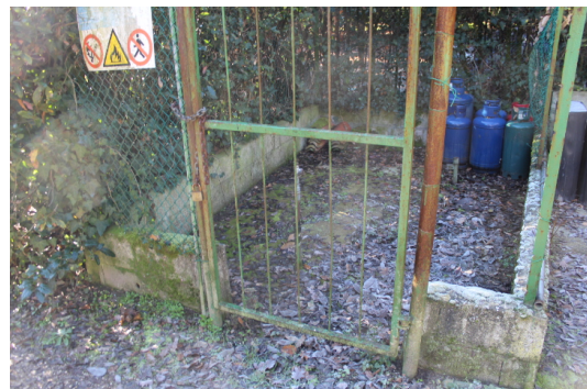
PARTICOLARE DEPOSITO INTERRATO DEL GPL POSTO IN ALTRA PROPRIETA'