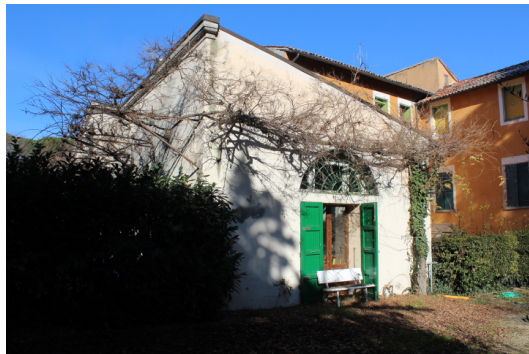
PARTICOLARE PROSPETTO EST; PORTA DELLA ZONA PRANZO