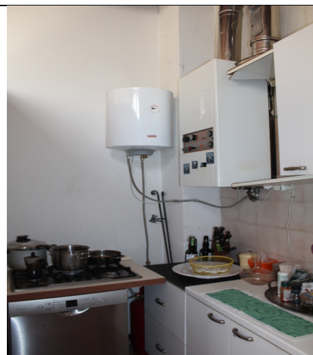
CUCINA; PARTICOLARE BOILER E CALDAIA NON FUNZIONANTE