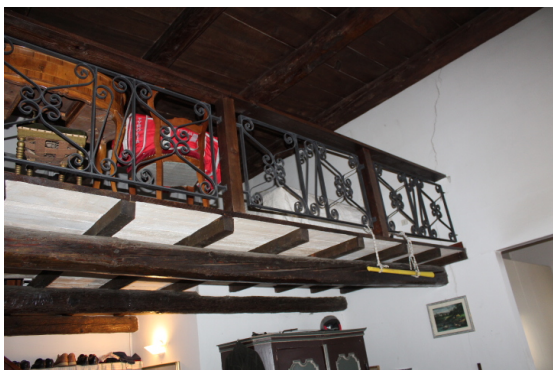
VISTA DEL SOPPALCO