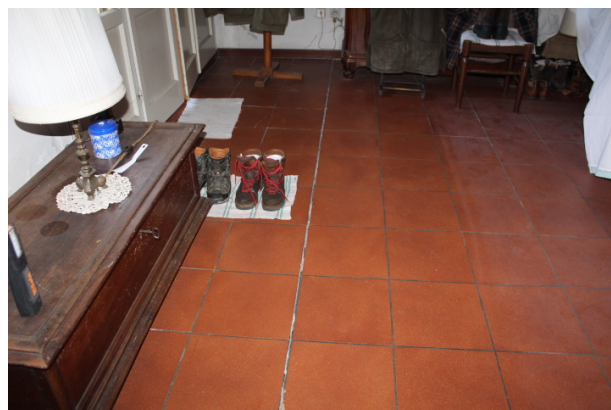
PARTICOLARE DELLA PAVIMENTAZIONE