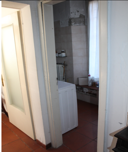
BAGNO – SI NOTANO SEGNI DI UMIDITA'