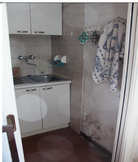
CUCINA; SI NOTANO SEGNI DI UMIDITA' ASCENDENTE