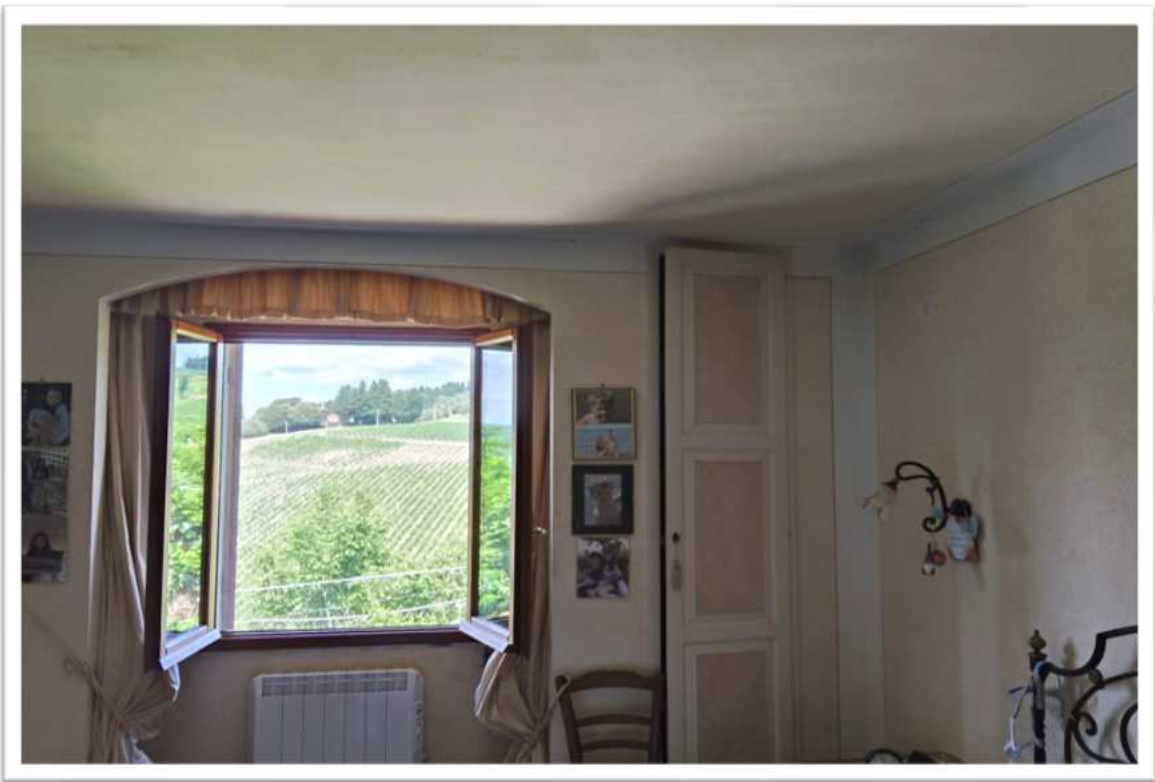
Foto n. 12 - camera da letto 9- foto del 04/06/2026