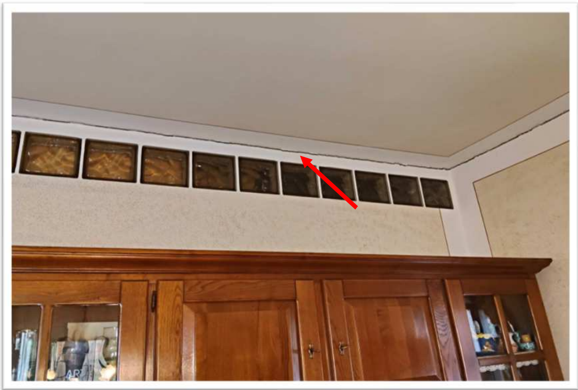
Foto n. 8 cucina particolare lesione - foto del 04/06/2026