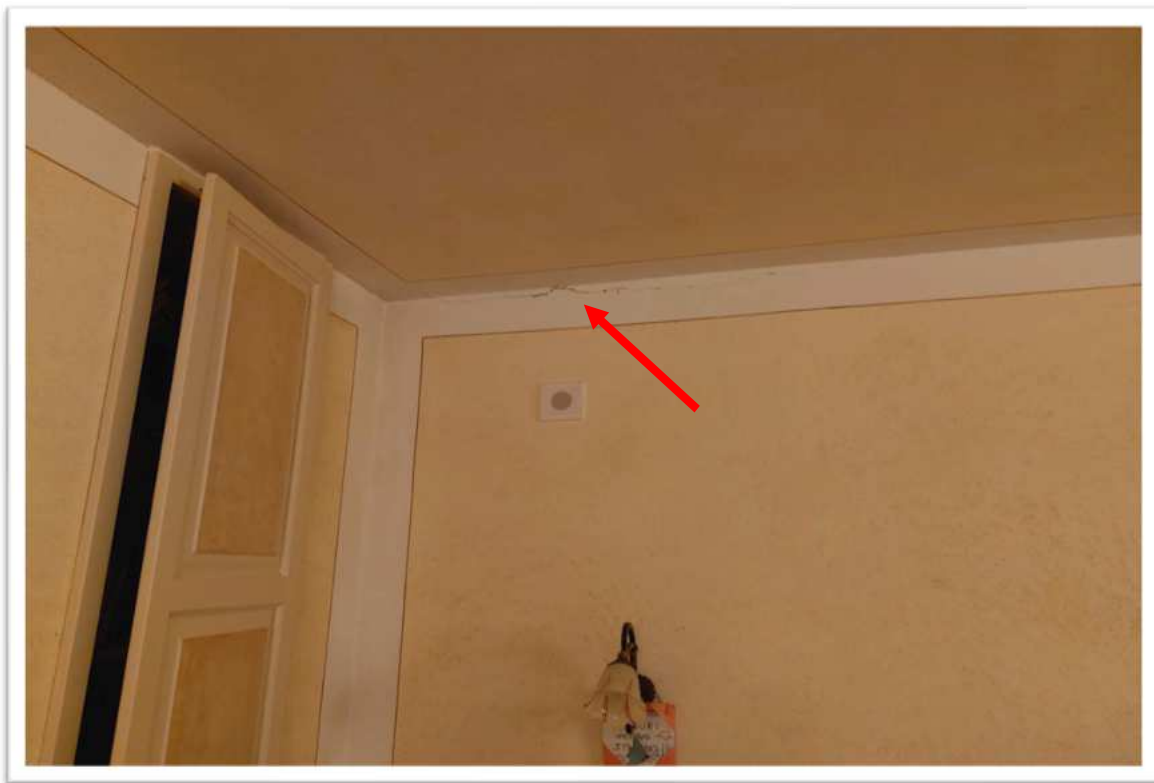
Foto n. 13 - particolare lesione camera da letto - foto allegata alla perizia consegnata a febbraio 2024