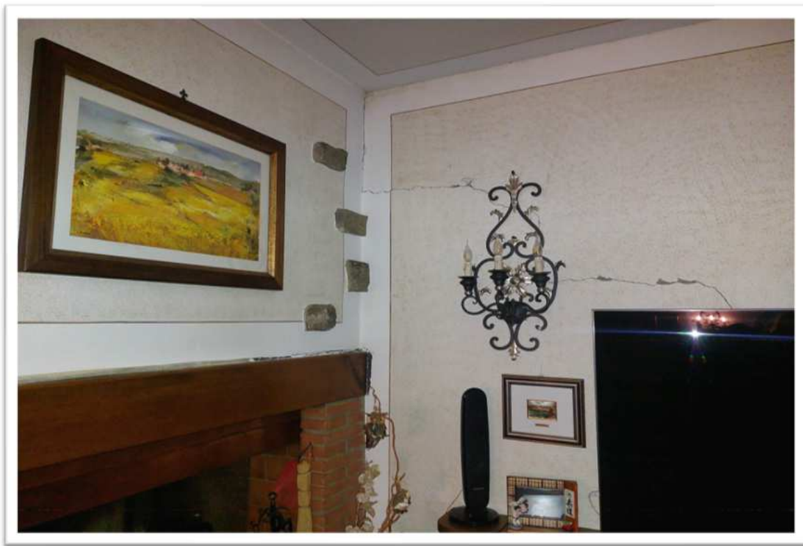
Foto n. 11 - particolare delle lesioni nel soggiorno 2 - foto allegata alla perizia consegnata a febbraio 2024