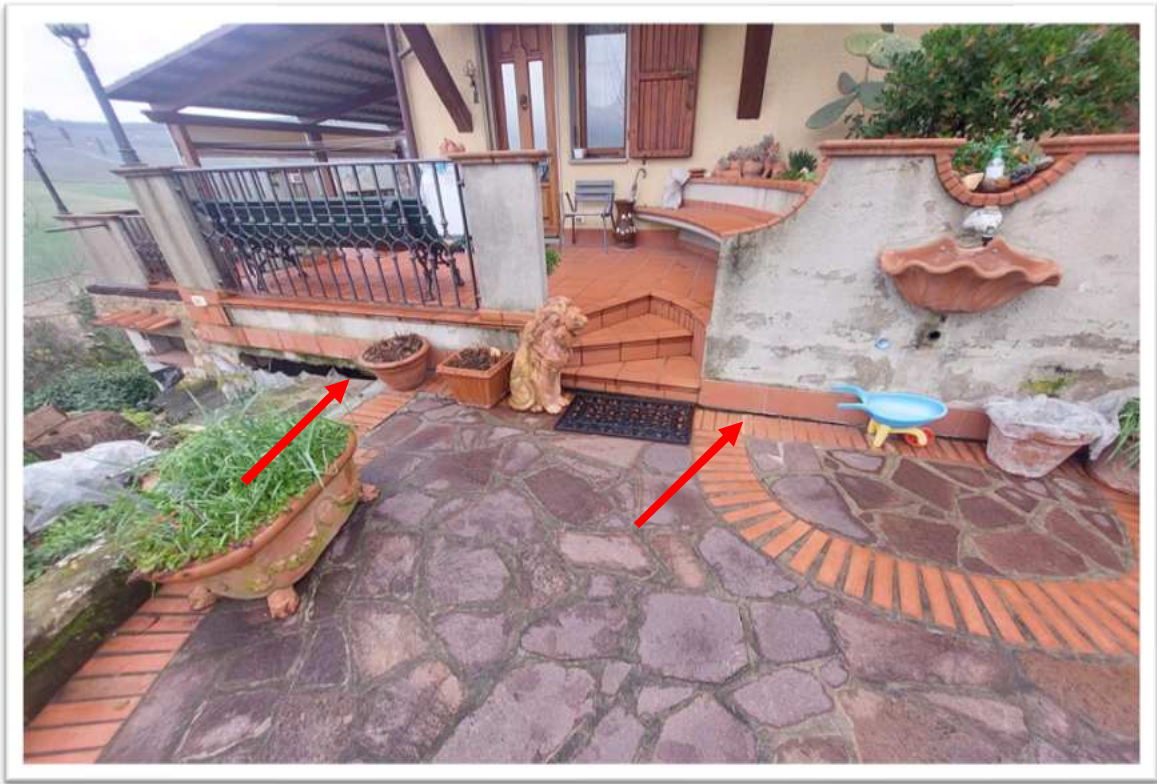
Foto n. 3 piazzale di ingresso - foto allegata alla perizia consegnata a febbraio 2024