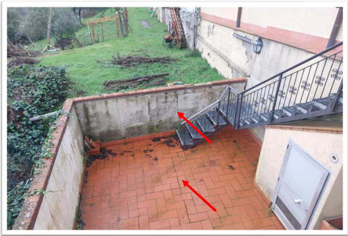
Foto n. 6 resede - foto allegata alla perizia consegnata a febbraio 2024