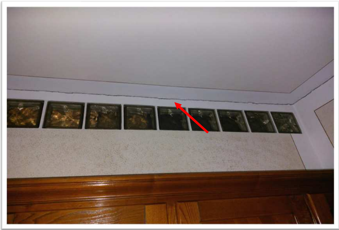
Foto n. 8 cucina particolare lesione - foto allegata alla perizia consegnata a febbraio 2024