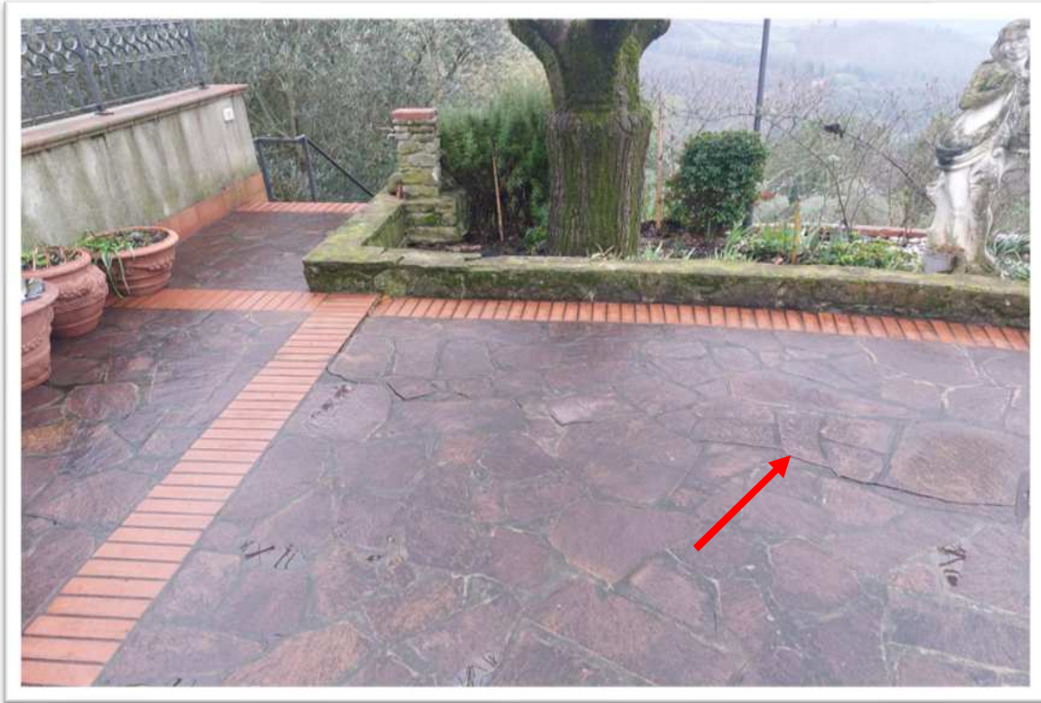
Foto n. 1 - piazzale di ingresso – foto allegata alla perizia consegnata a febbraio 2024

Confronto tra le foto allegate alla perizia del febbraio 2024 e le foto attuali del 04-06-2026