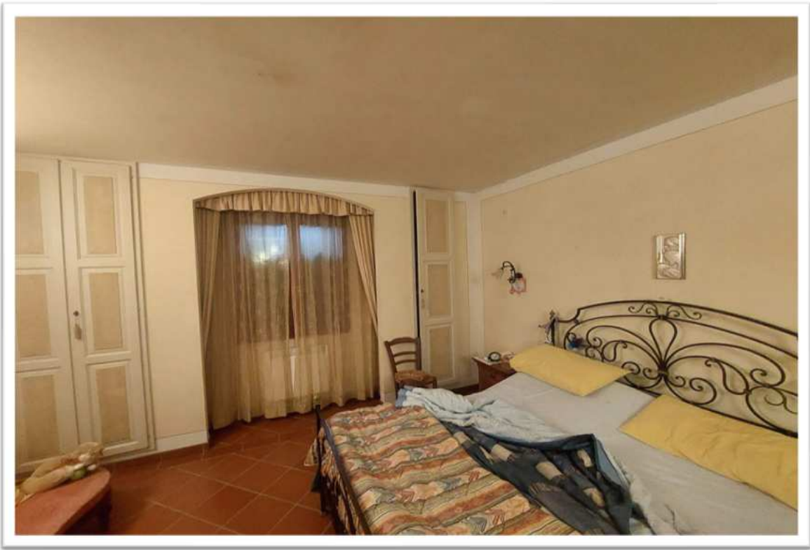
Foto n. 12 - camera da letto 9- foto allegata alla perizia consegnata a febbraio 2024