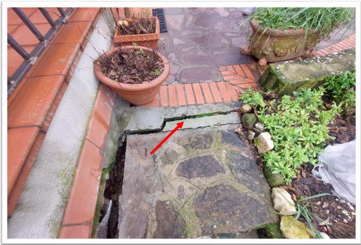
Foto n. 4 piazzale di ingresso - foto allegata alla perizia consegnata a febbraio 2024