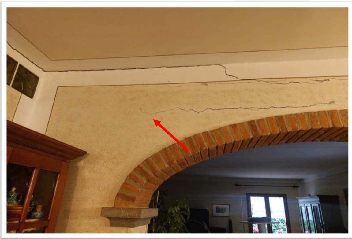
Foto n. 9 particolare delle lesioni sopra il passaggio al soggiorno 2 - - foto allegata alla perizia consegnata a febbraio 2024