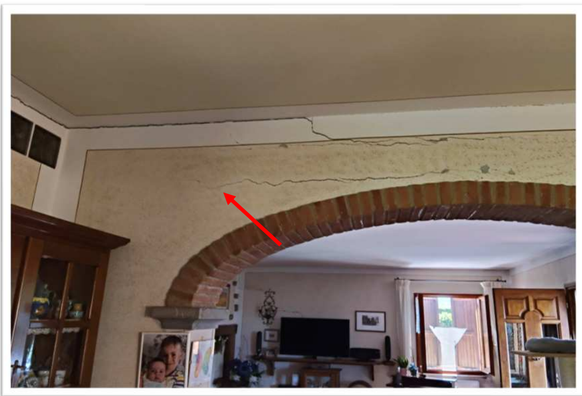
Foto n. 9 particolare delle lesioni sopra il passaggio al soggiorno 2 - foto del 04/06/2026