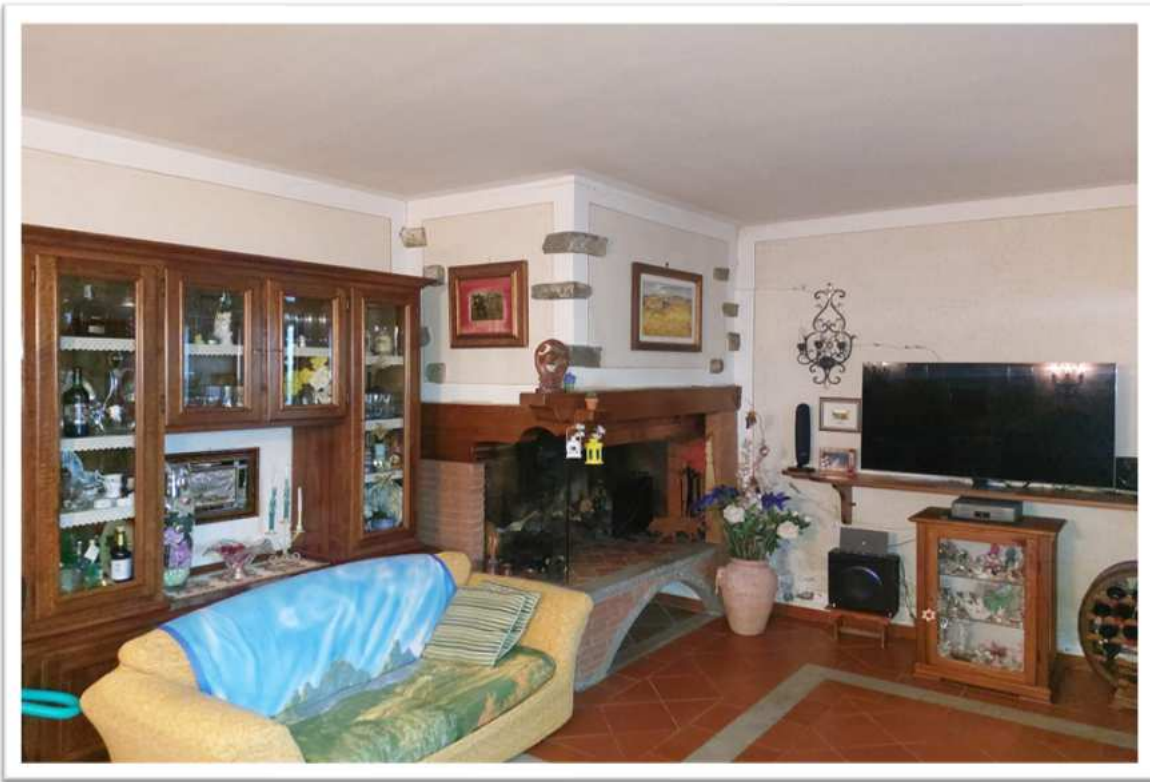
Foto n. 10 - soggiorno 2- foto allegata alla perizia consegnata a febbraio 2024