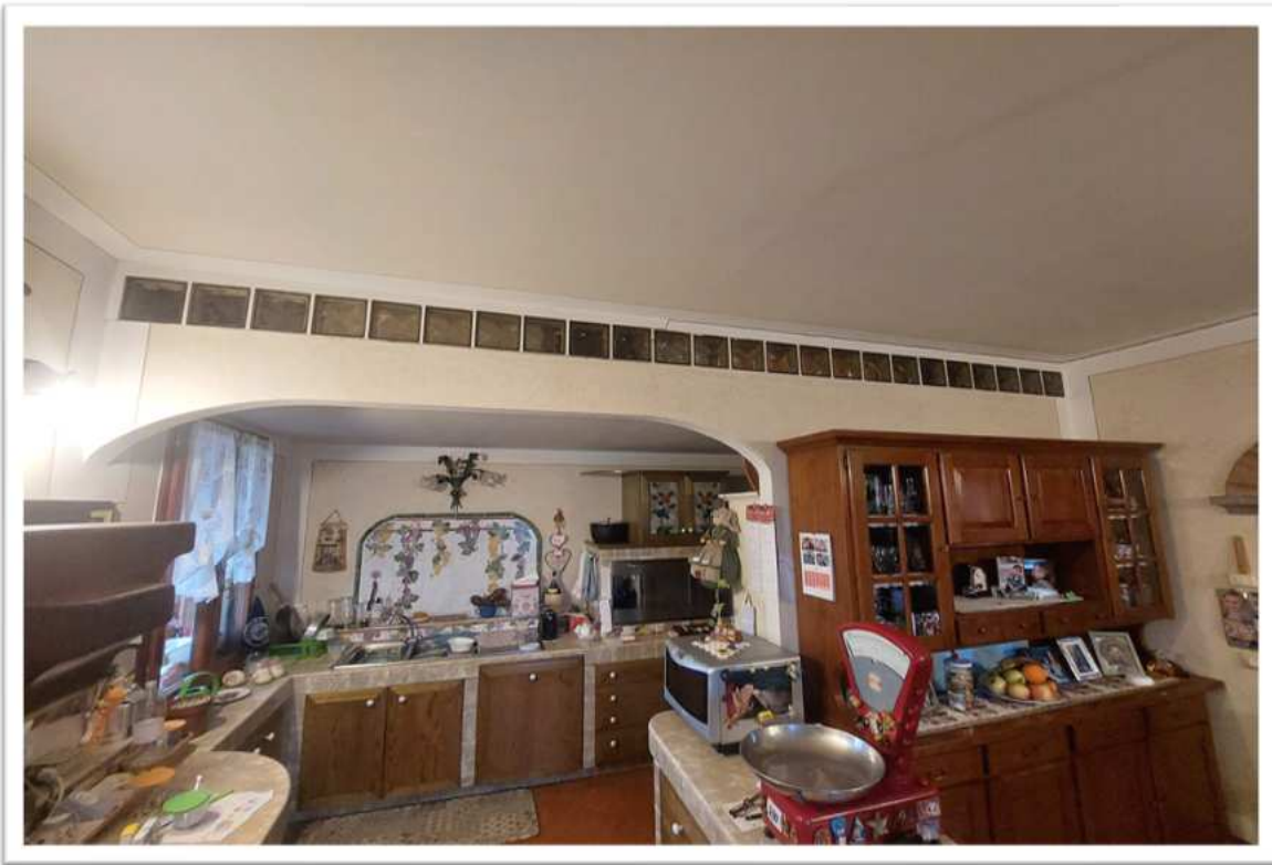
Foto n. 7 cucina - foto allegata alla perizia consegnata a febbraio 2024