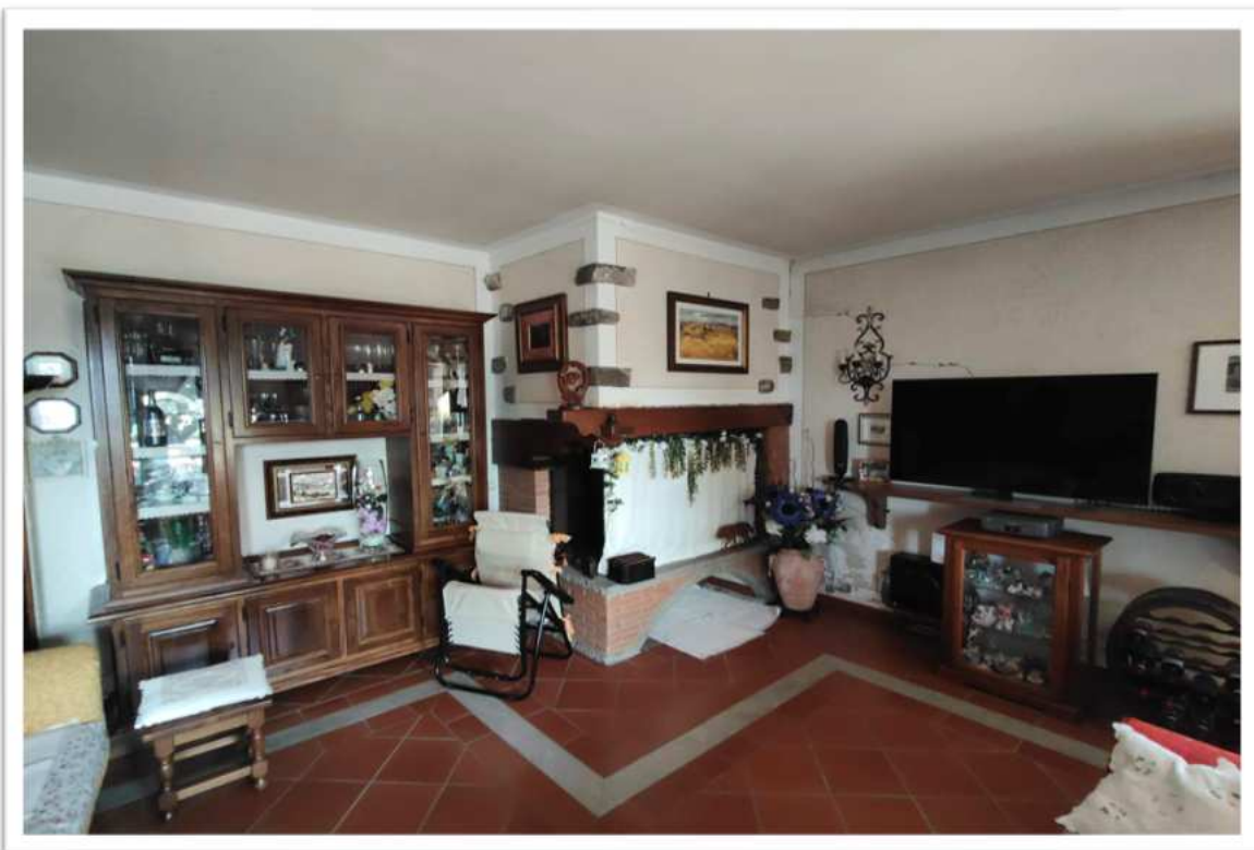
Foto n. 10 - soggiorno 2- foto del 04/06/2026