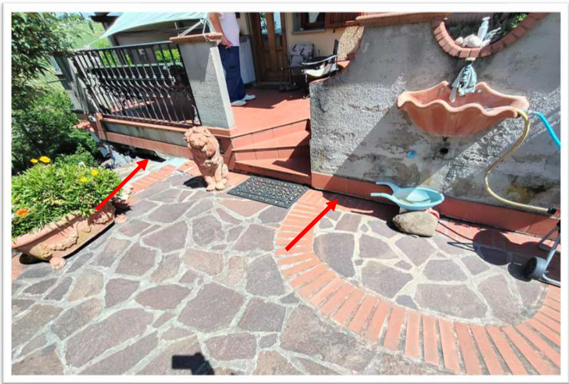
Foto n. 3 piazzale di ingresso - foto del 04/06/2026