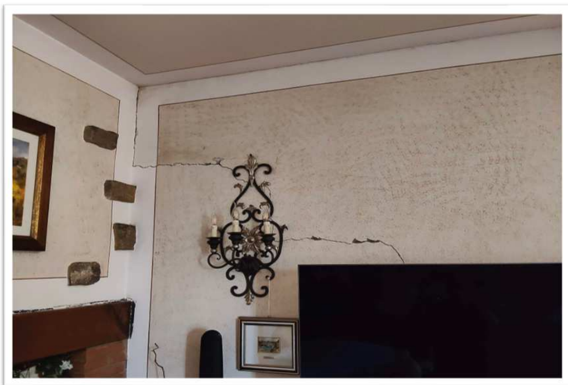
Foto n. 11 - particolare delle lesioni nel soggiorno 2 - foto del 04/06/2026