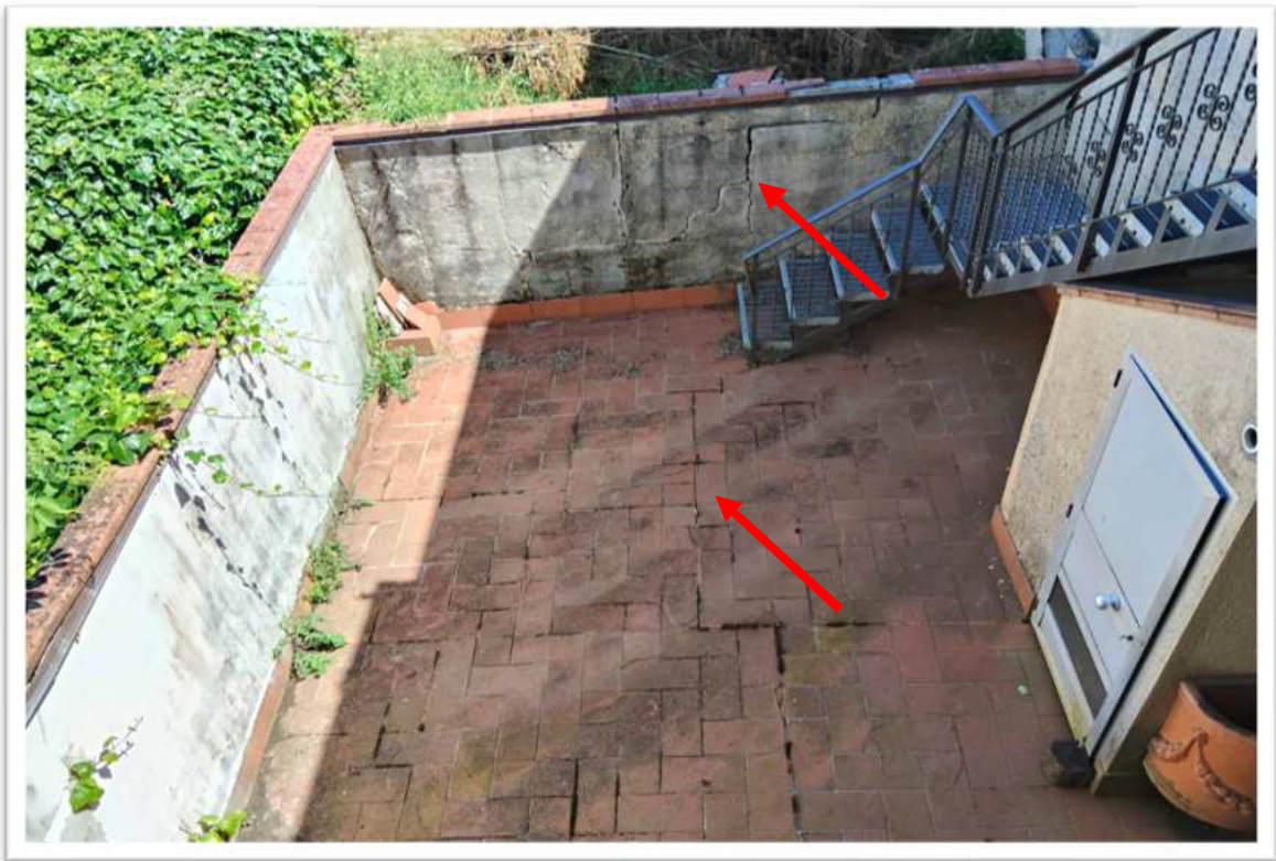
Foto n. 6 resede - foto del 04/06/2026