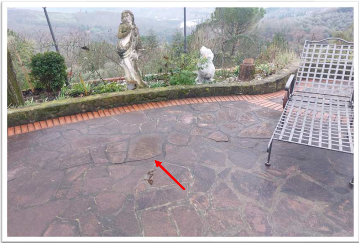
Foto n. 2 piazzale di ingresso - foto allegata alla perizia consegnata a febbraio 2024