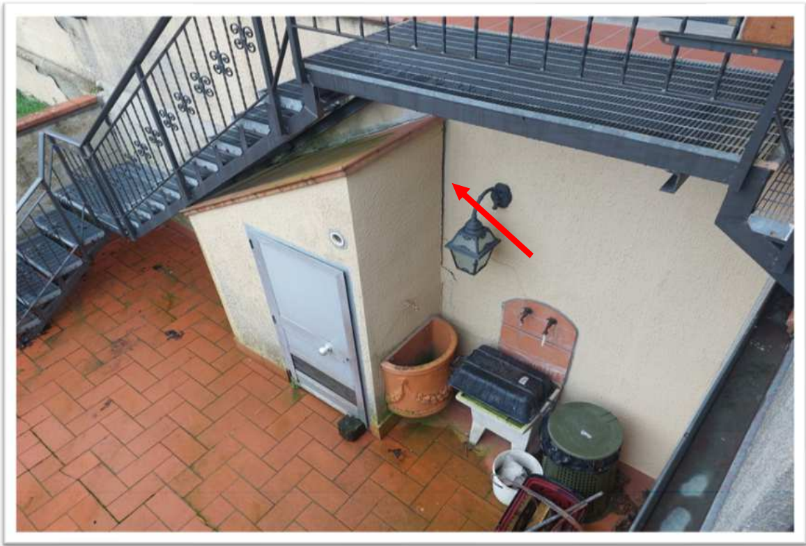
Foto n. 5 resede comparsa di lesioni - foto allegata alla perizia consegnata a febbraio 2024