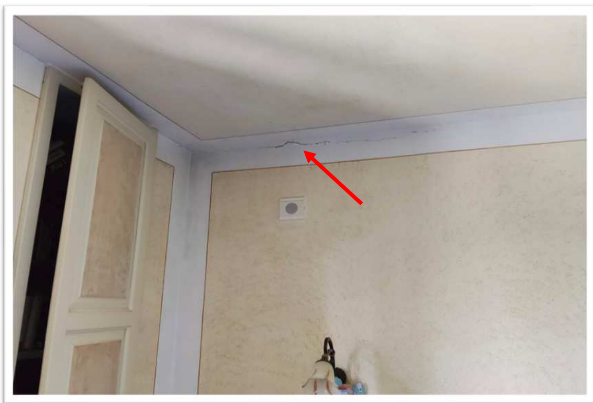
Foto n. 13 - particolare lesione camera da letto - foto del 04/06/2026