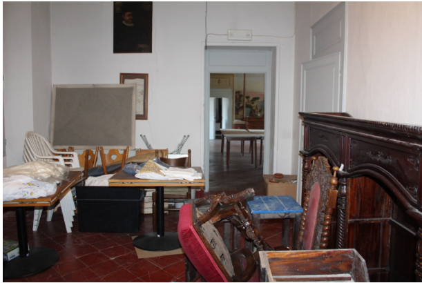
SALA RISTORANTE 3