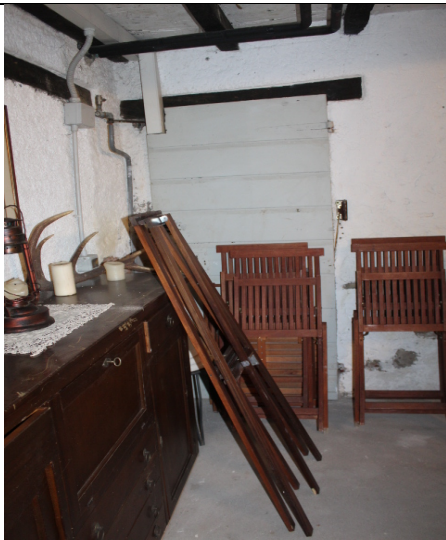
SALETTA ADIACENTE AL VANO CANTINETTA\TAVERNA