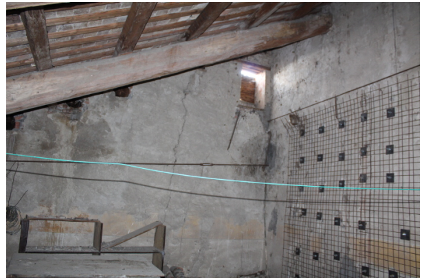
PARTICOLARE DEL MEDESIMO RINFORZO SULL'ALTRO LATO DELLA MURATURA