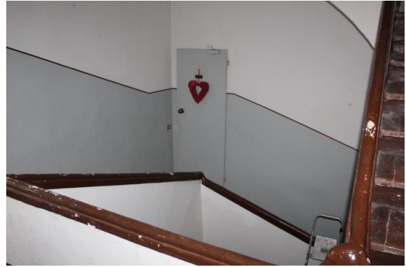
VISTA DELL'ACCESSO AL PRIMO AMMEZZATO