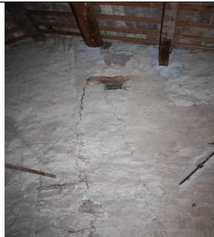
PARTICOLARE LESIONI ALLE MURATURE PORTANTI DEL COMPLESSO