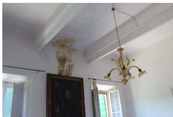
PARTICOLARE INFILTRAZIONI D'ACQUA DALLA COPERTURA