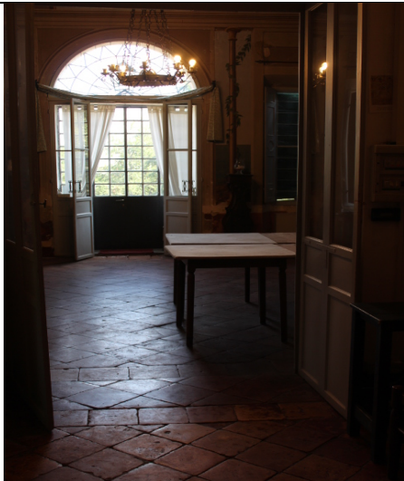
DISIMPEGNO – VISTA VERSO IL SALONE