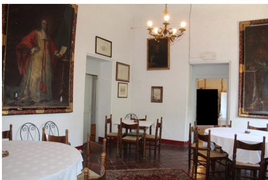
SALA RISTORANTE 2