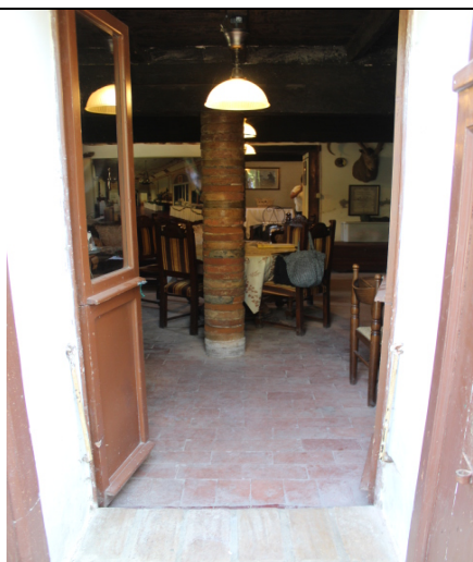
VANO TAVERNA\CANTINETTA CON ACCESSO DIRETTO DALLA CORTE COMUNE