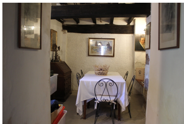
SALETTA ADIACENTE AL VANO CANTINETTA\TAVERNA