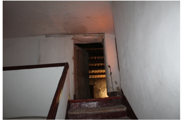
ARRIVO DELLA SCALA AL SECONDO PIANO (sottotetto)