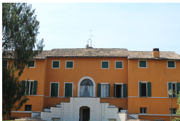
PARTICOLARE DELLA COPERTURA CHE NECESSITA DI INTERVENTI URGENTI, VISTE LE INFILTRAZIONI D'ACQUA