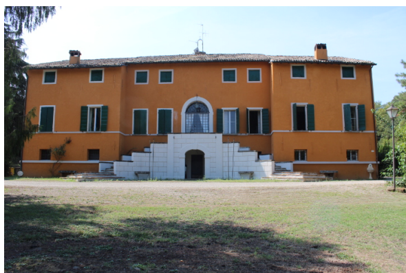
PROSPETTO PRINCIPALE VILLA MERENDA