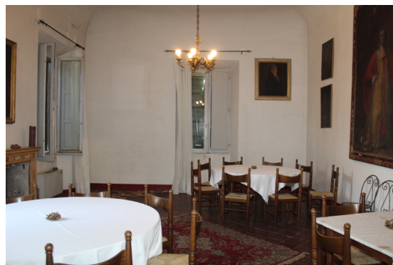
SALA RISTORANTE 2