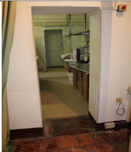
INGRESSO ALLA CUCINA