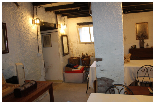
SALETTA ADIACENTE AL VANO CANTINETTA\TAVERNA