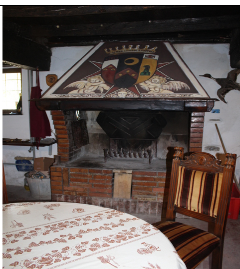
PARTICOLARE DEL CAMINO NEL VANO TAVERNA\CANTINETTA