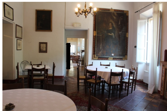
SALA RISTORANTE 2