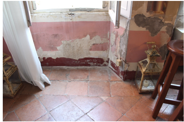
PARTICOLARE DEGLI AMMALORAMENTI MURARI