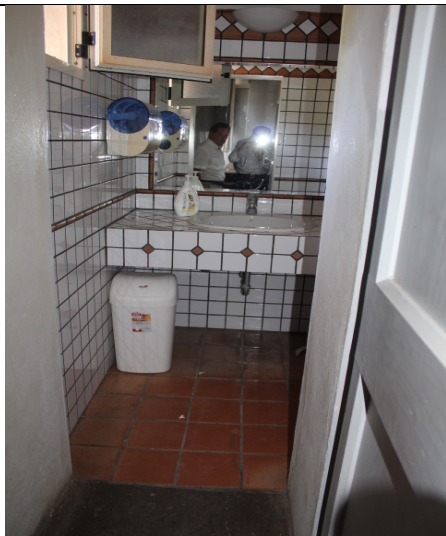
ANTIBAGNO DEL PRIMO AMMEZZATO