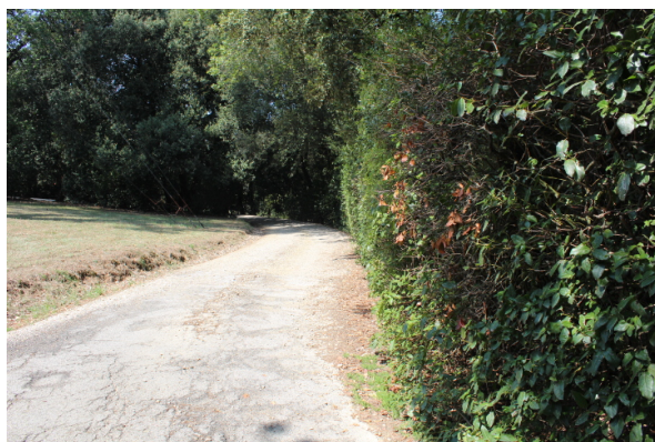
STRADELLO LATO DESTRO, RISPETTO ALL'ENTRATA, DI ARRIVO A VILLA MERENDA