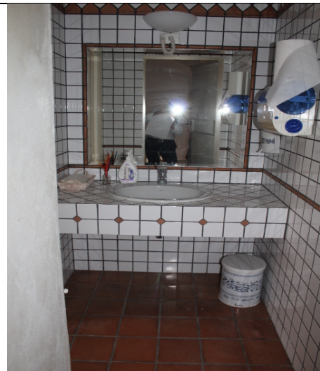
ANTIBAGNO SECONDO AMMEZZATO