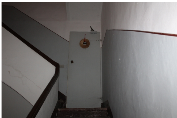
VISTA DELL'ACCESSO AL SECONDO AMMEZZATO