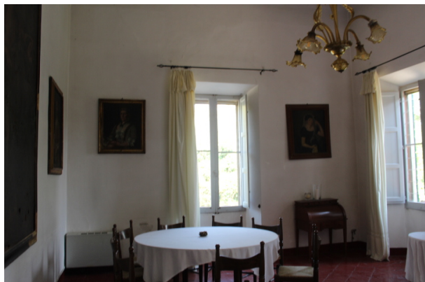
SALA RISTORANTE 1