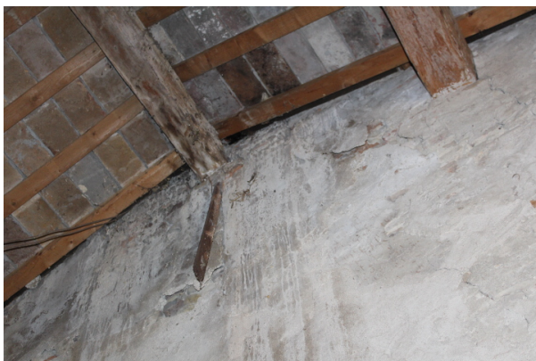
PARTICOLARE INFILTRAZIONI D'ACQUA DALLA COPERTURA