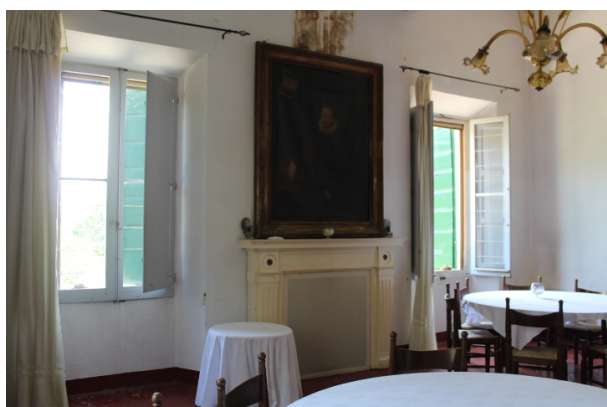
SALA RISTORANTE 1