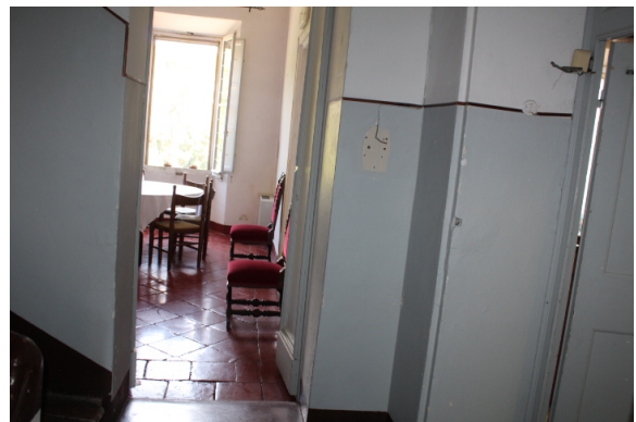
DAL VANO SCALA ALLA PRIMA SALA RISTORANTE