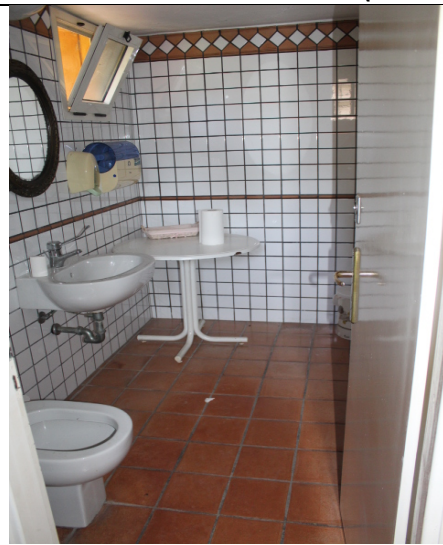
BAGNO DEL PRIMO AMMEZZATO