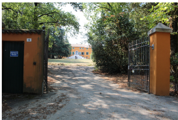
INGRESSO DA VIA LA FONTANA