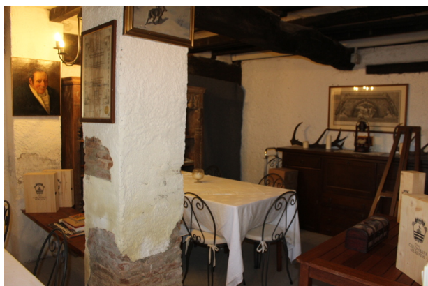
SALETTA ADIACENTE AL VANO CANTINETTA\TAVERNA