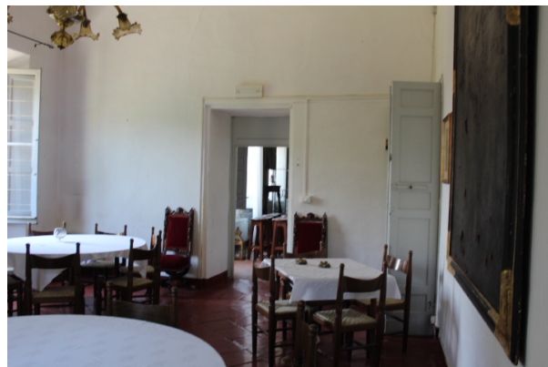
SALA RISTORANTE 1