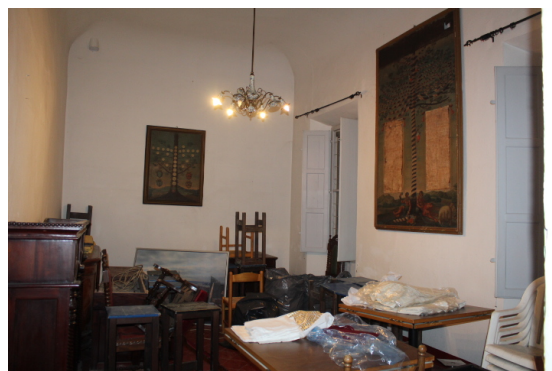
SALA RISTORANTE 3