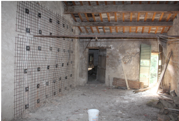
PARTICOLARE DEI RINFORZI STRUTTURALI ESEGUITI