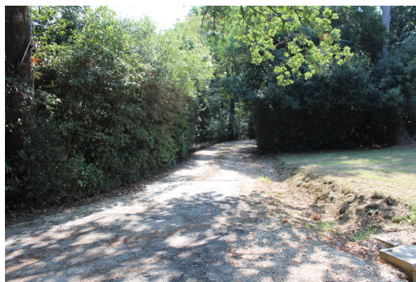
STRADELLO LATO SINISTRO, RISPETTO ALL'ENTRATA, DI ARRIVO A VILLA MERENDA