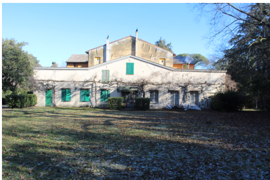
PROSPETTO SUD, RETRO DI VILLA MERENDA