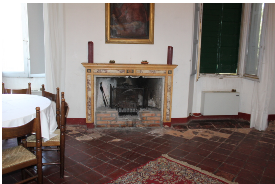
SALA RISTORANTE 2