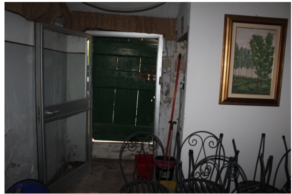
ACCESSO DALL'ESTERNO, COMUNICANTE CON IL VANO SCALA, ATTO A CONSENTIRE IL PASSAGGIO PER ACCEDERE AL PIANO SECONDO (sottotetto)