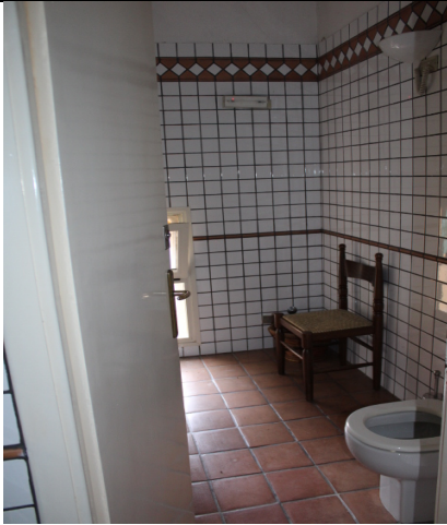
BAGNO SECONDO AMMEZZATO