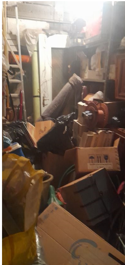
Foto 10 - Cantina