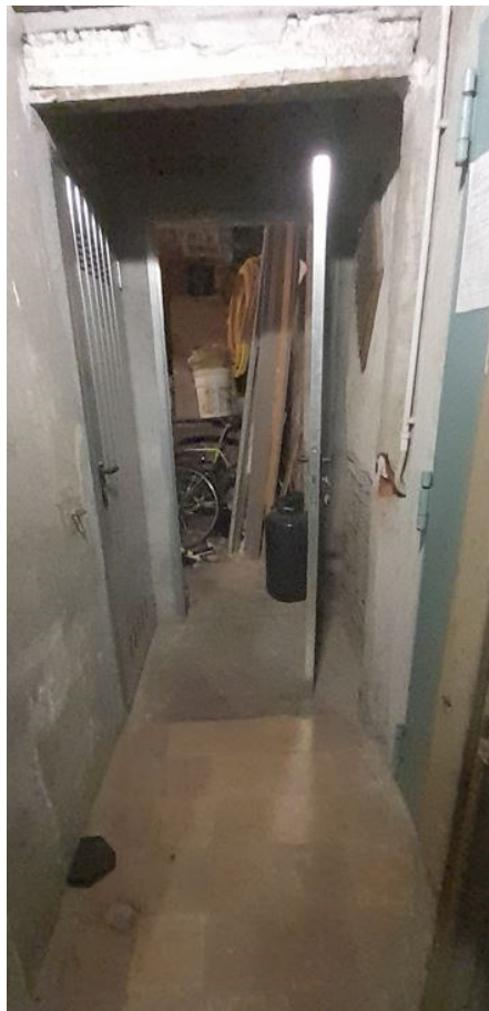
Foto 9 - Vista verso cantina