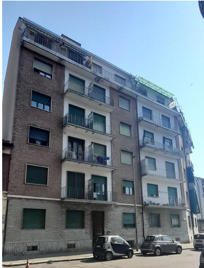
Foto 1- prospetto su strada