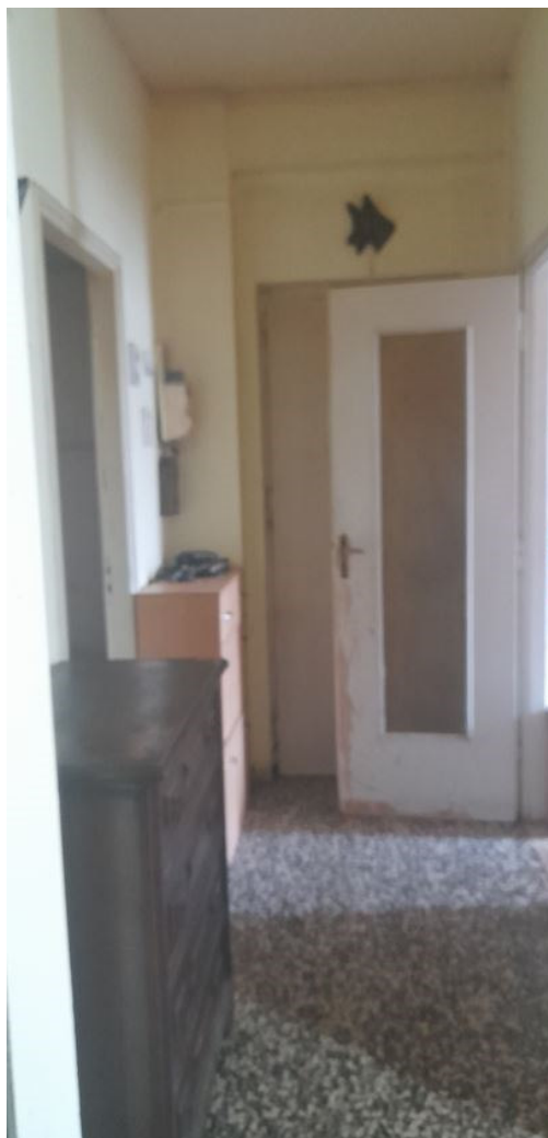
Foto 3 - corridoio