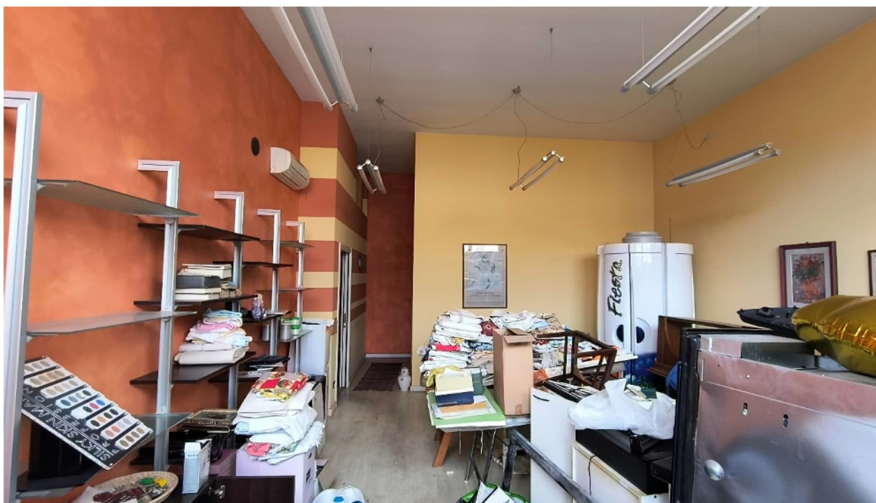
Vista primo locale artigianale