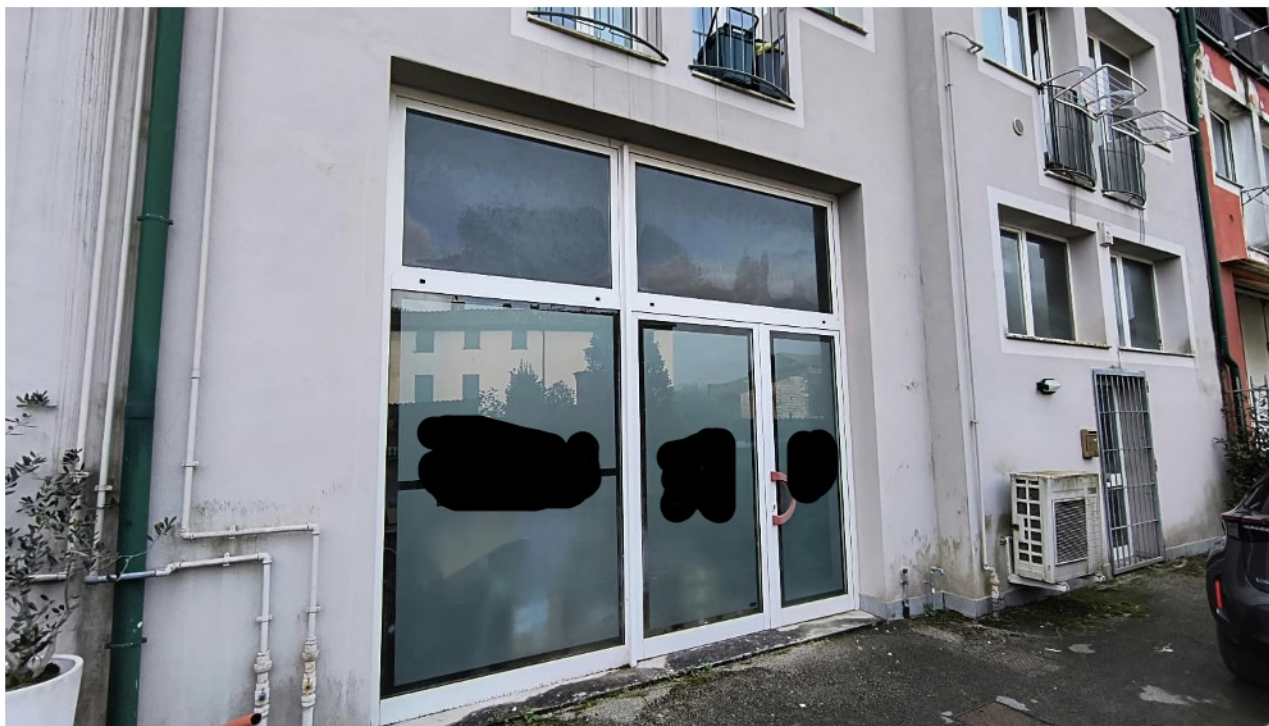
Vista prospetto immobile in oggetto