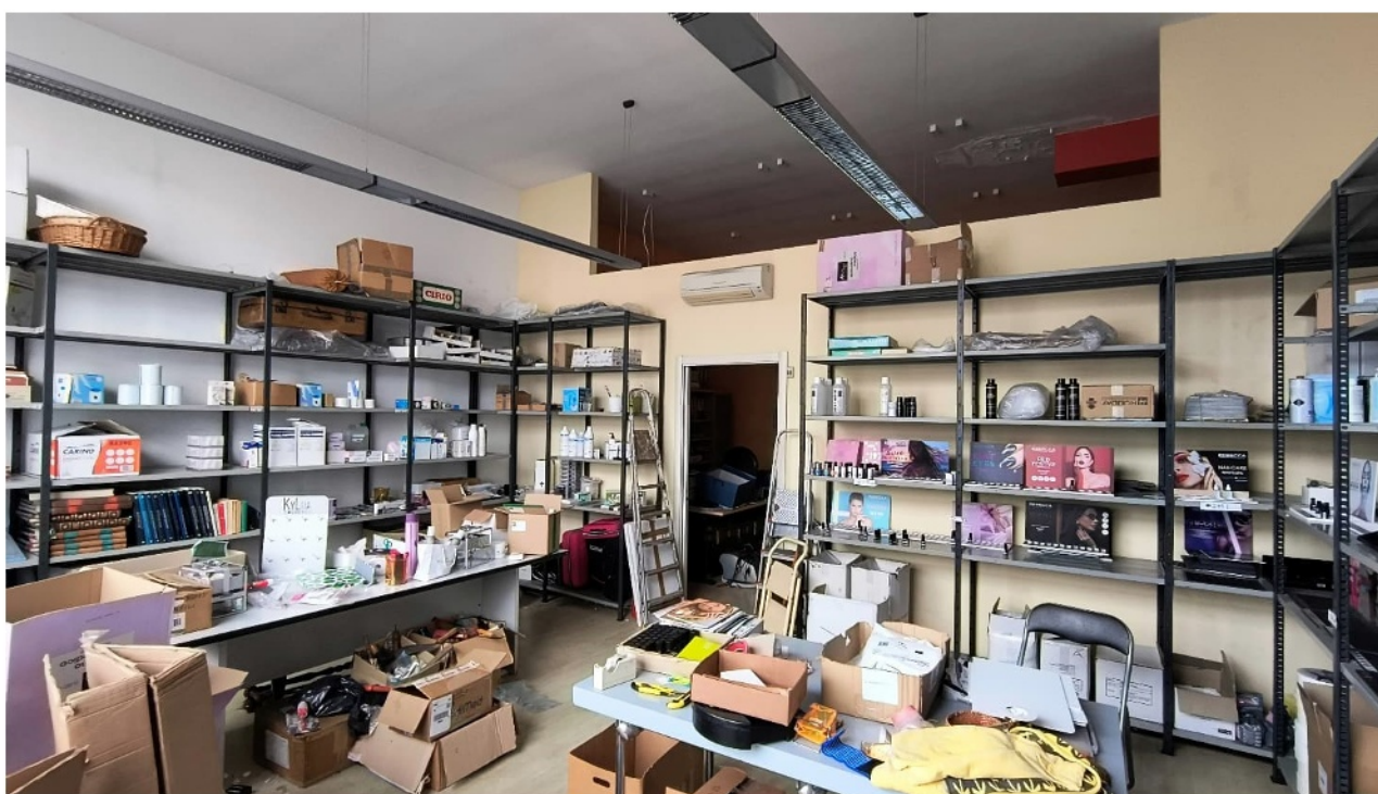
Vista secondo locale artigianale