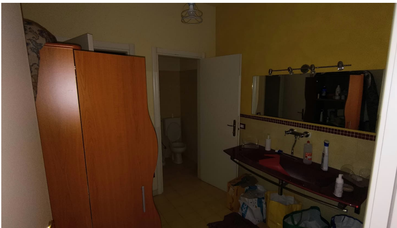
Vista locale accessori