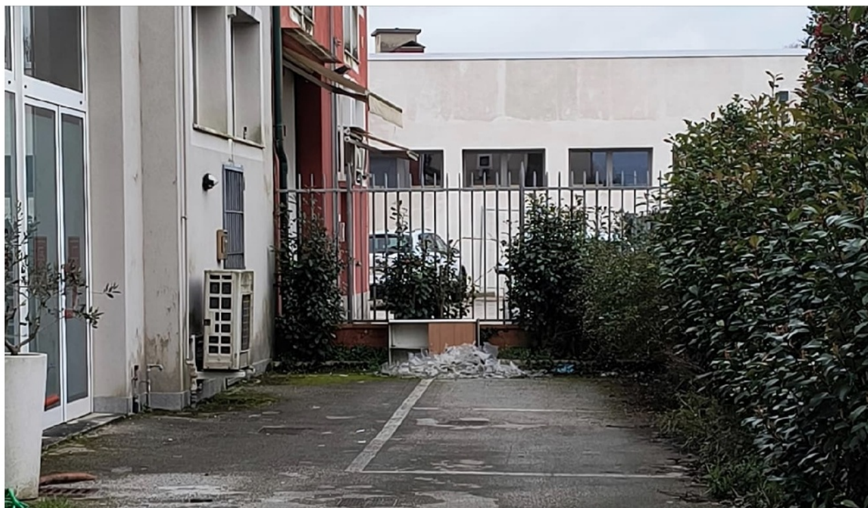
Vista della resede esterna