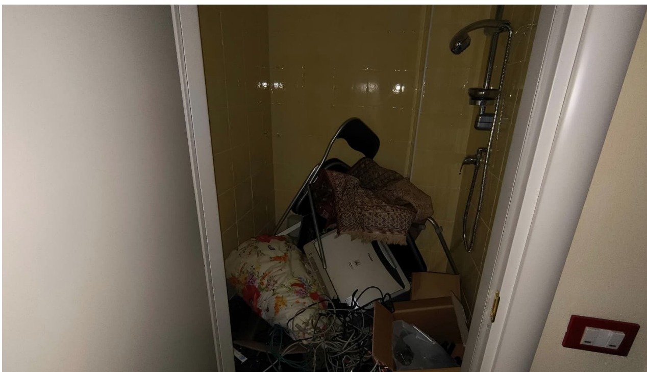
Vista locale doccia