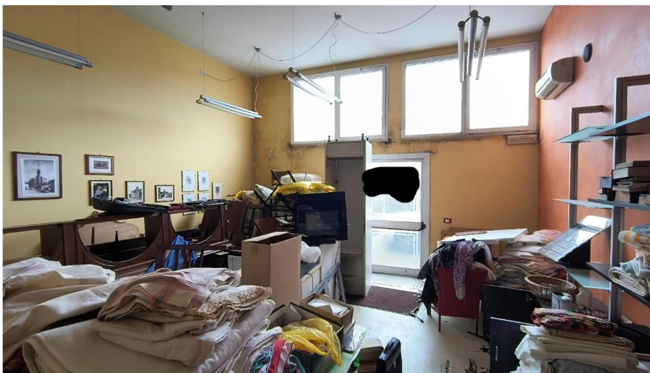
Vista primo locale artigianale