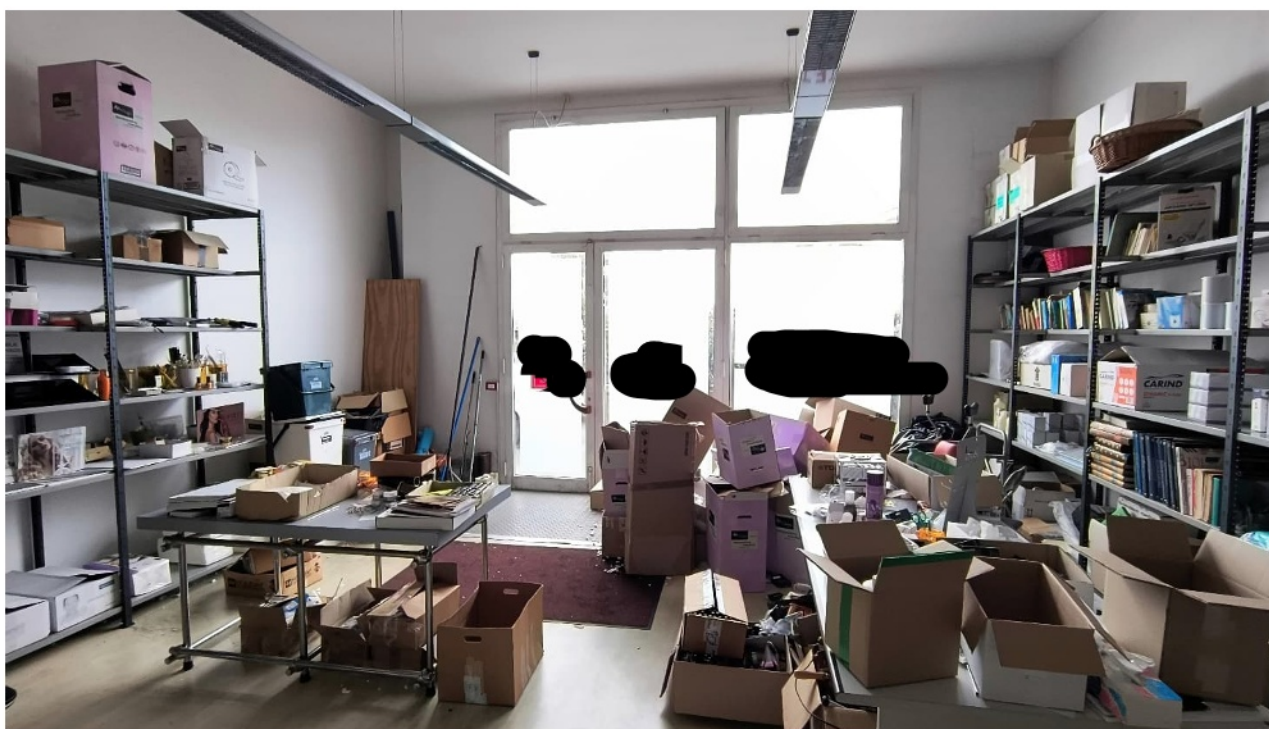
Vista secondo locale artigianale