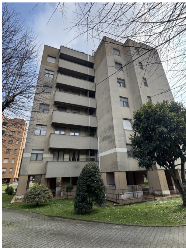
Foto 1: Prospetto del fabbricato nel quale è inserita l'unità immobiliare pignorata.