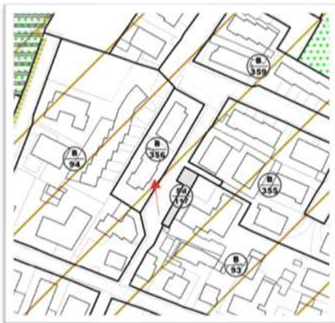
stralcio PI vigente

La destinazione d'uso prevalente è residenziale, come da art. 13 del Piano degli Interventi.