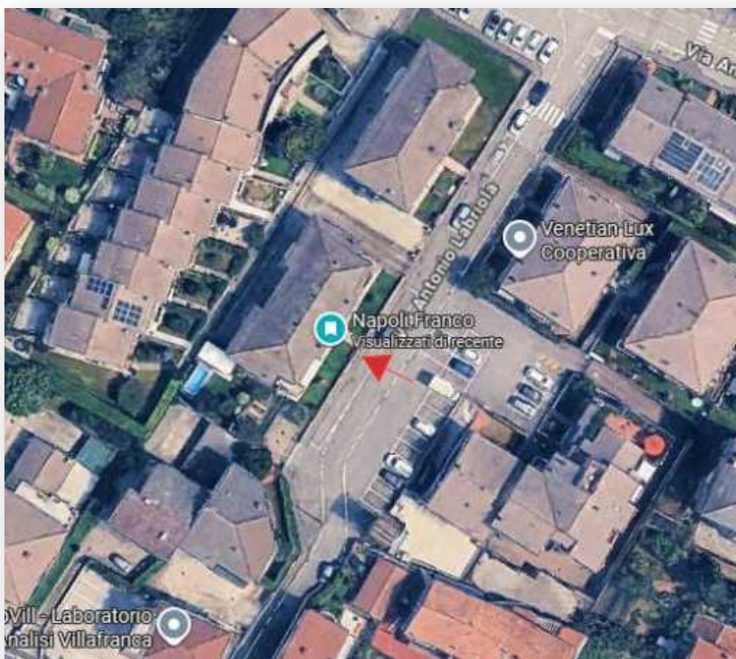
stralcio Google maps