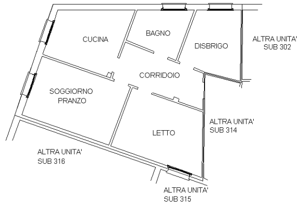
PIANTA PIANO PRIMO H = 3.00 mt