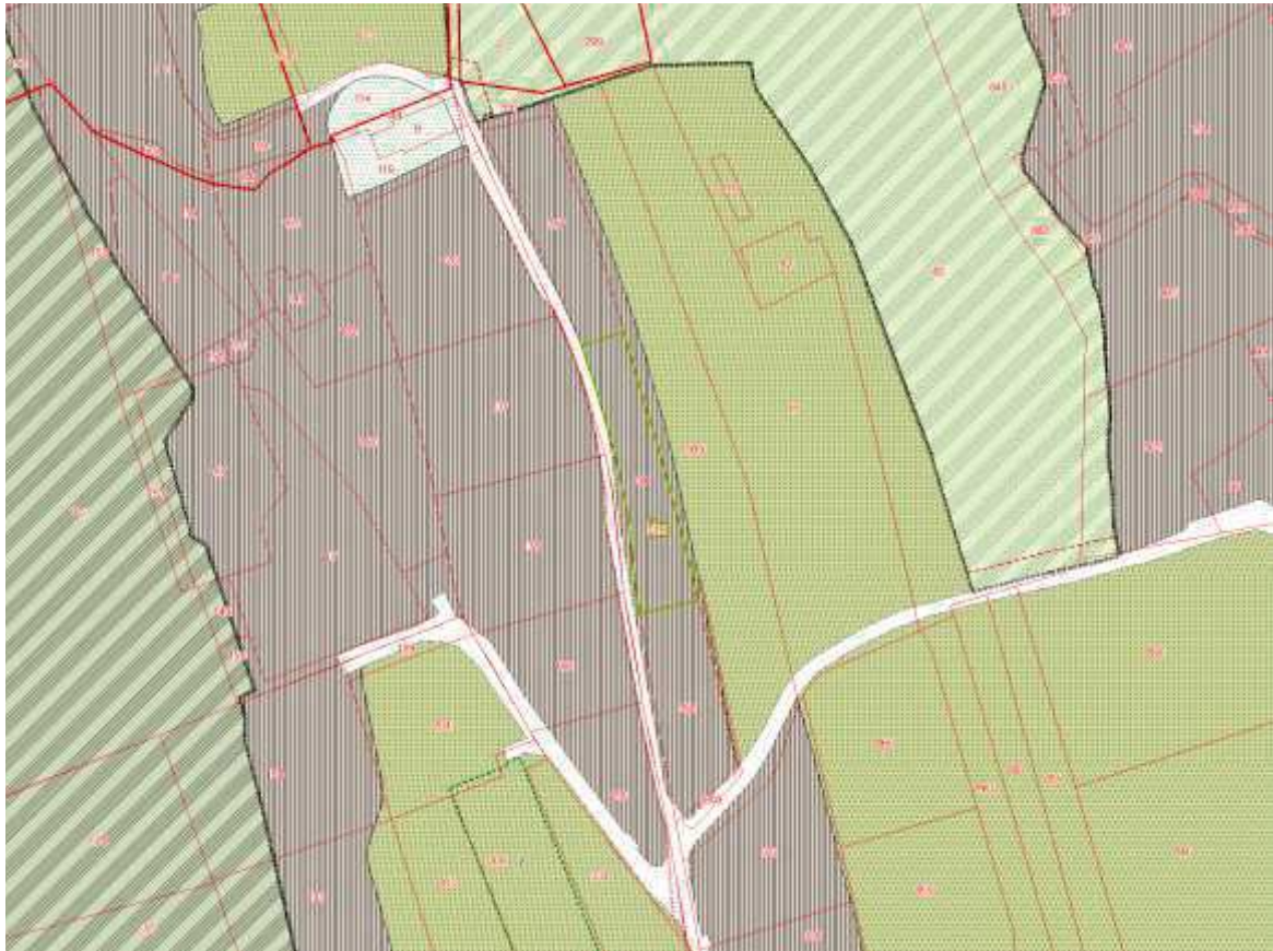
Estratto tavola di azzonamento del Piano delle Regole Foglio: 6 Mappale: 39