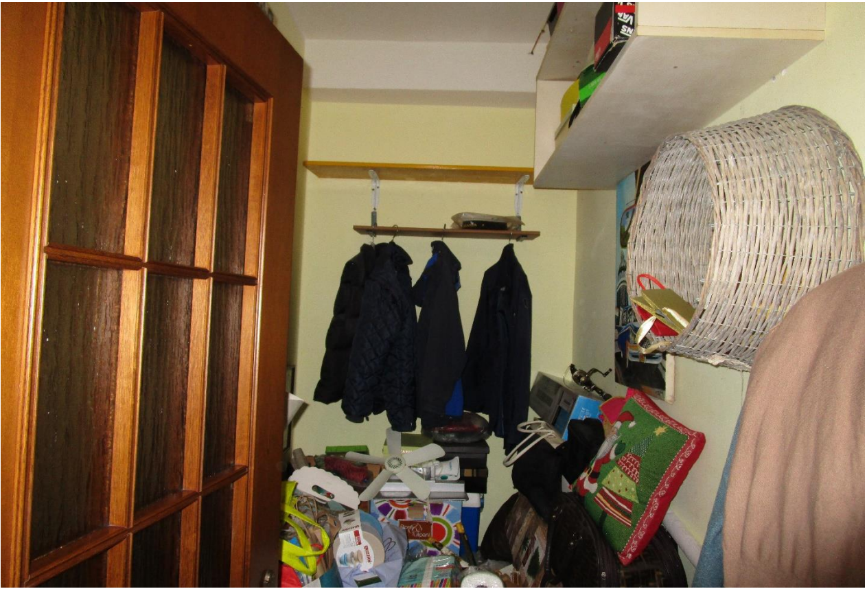
FOTO 22 - BALCONE