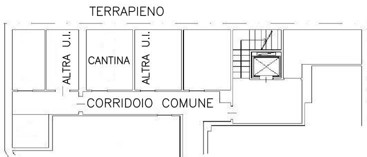
PIANO INTERRATO H=2.50