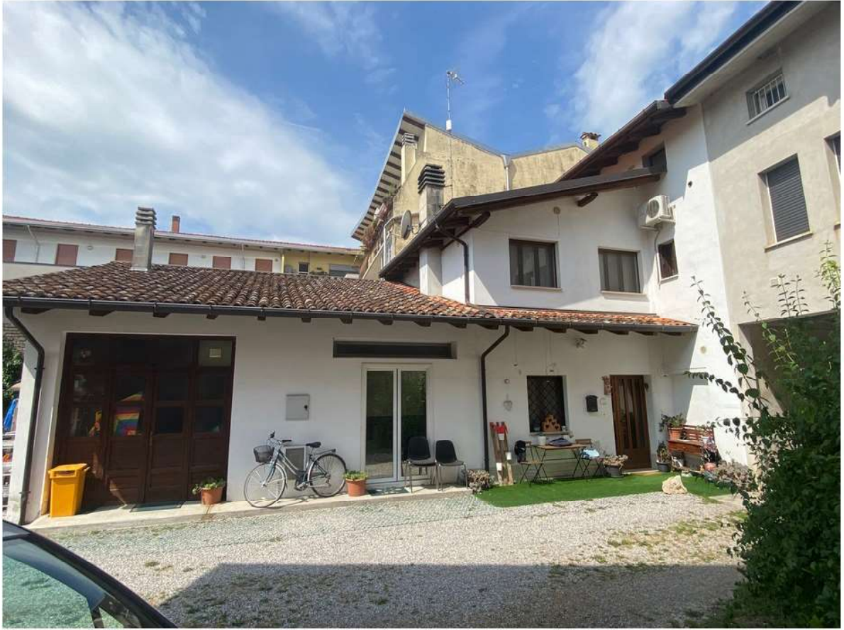
5. Prospetto principale su corte comune orientato a Nord Est