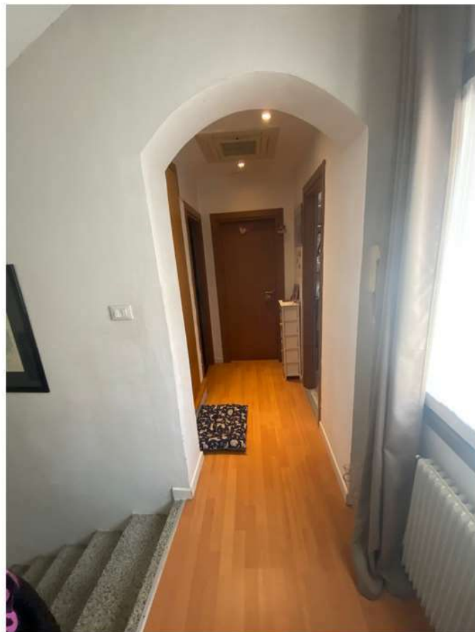
14. Corridoio di distribuzione al piano primo