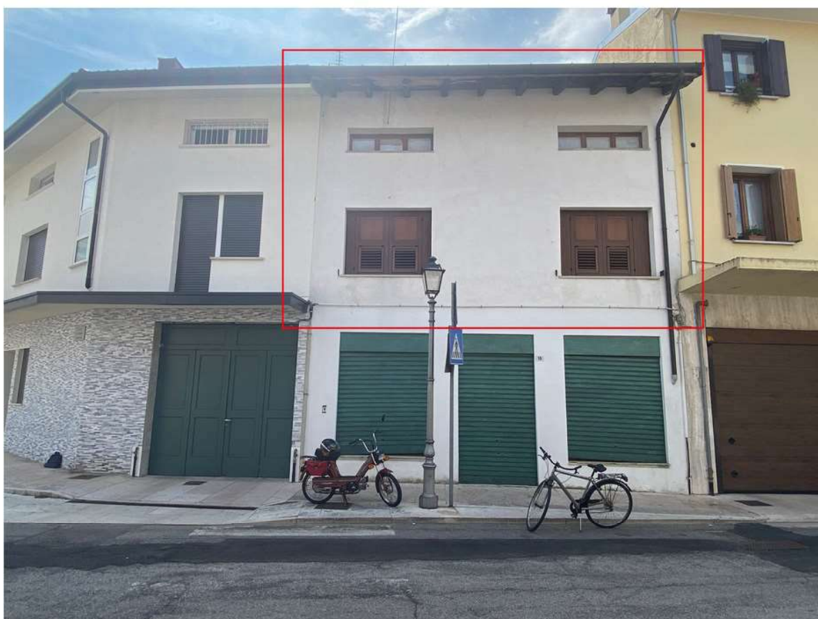
2. Prospetto su Piazza Vittorio Emanuele