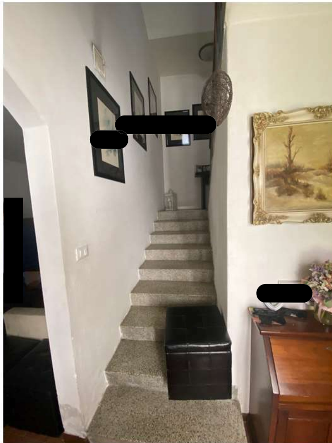
12. Scala di collegamento tra piano terra e piano prima, vista dall'ingresso