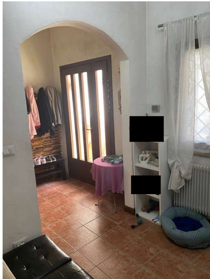
6. Piano terra, vista sull'ingresso