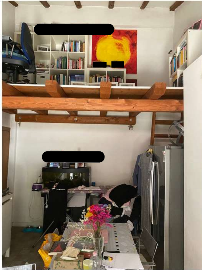
9. Cucina e particolare del soppalco