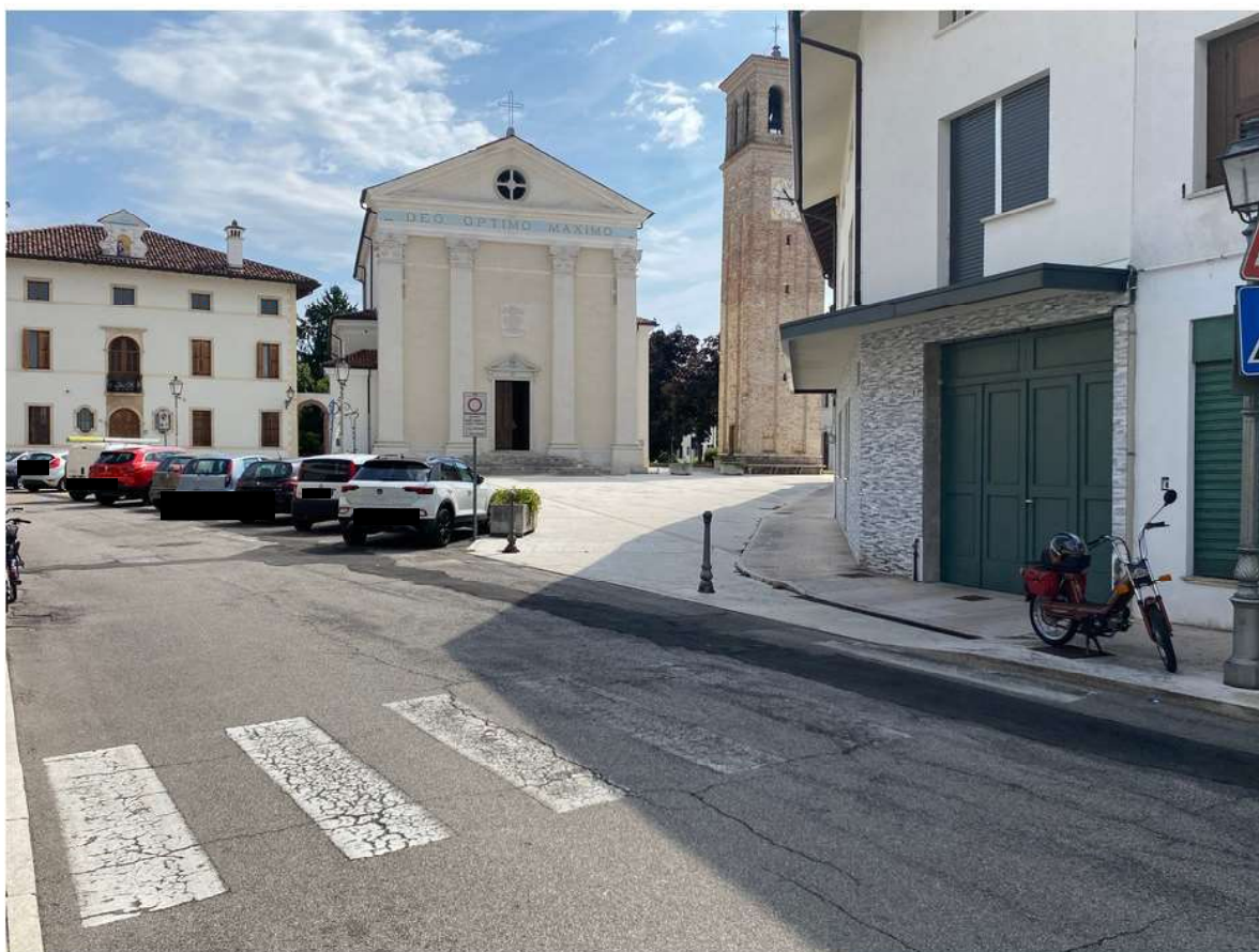
1. Vista su Piazza Vittorio Emanuele in direzione Ovest - Est