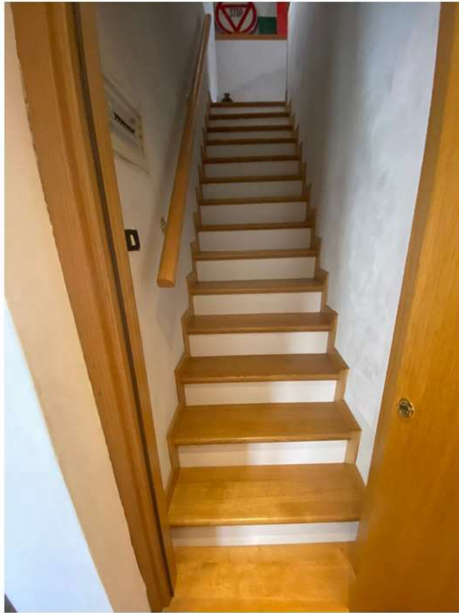
19. Scala di collegamento tra piano primo e soffitta