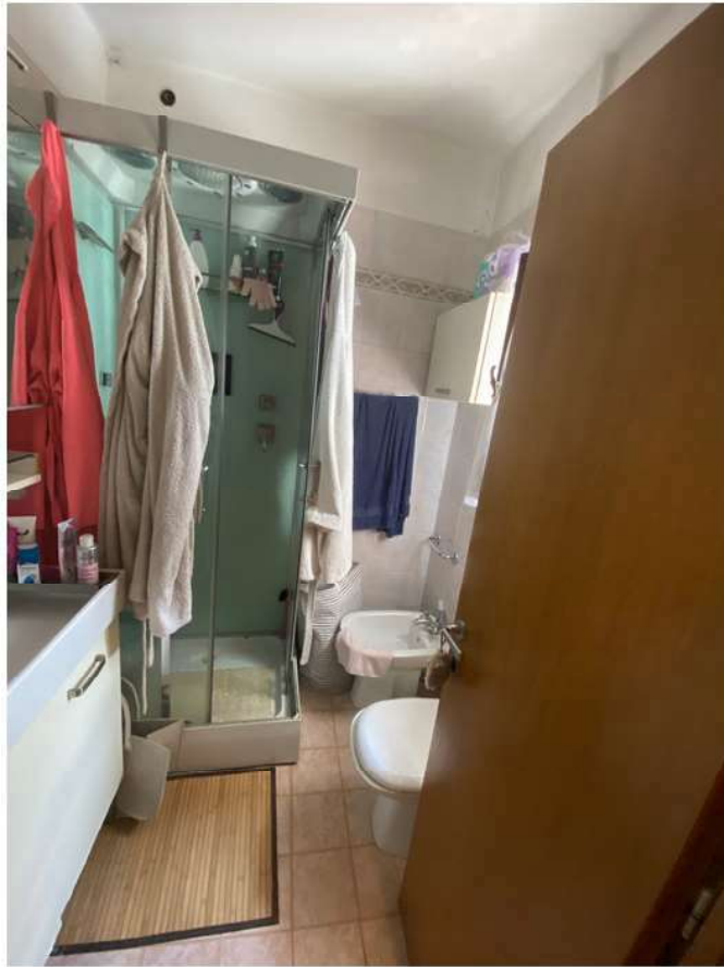
17. Bagno al piano primo