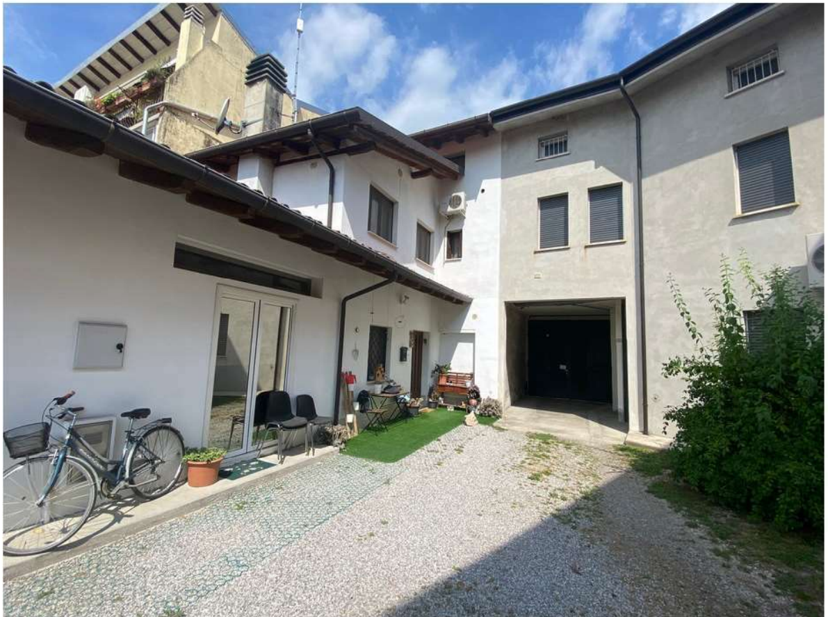
4. Corte comune e portico di ingresso alle proprietà