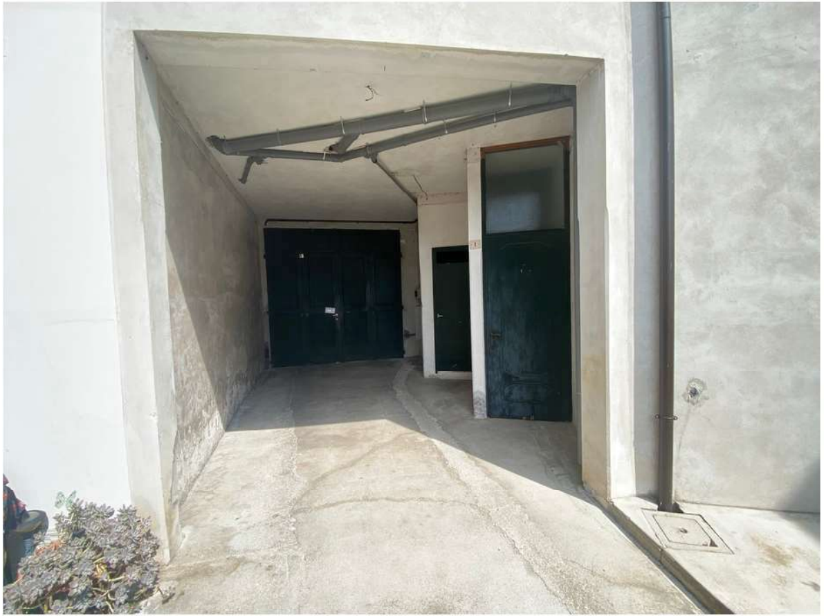
3. Portico d'accesso comune alle proprietà