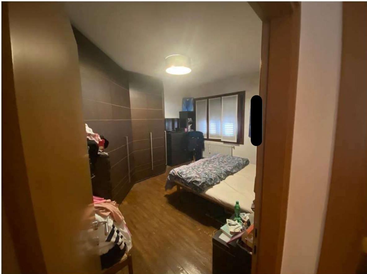
16. Camera matrimoniale al piano primo posizionata sull'angolo Sud Ovest del fabbricato