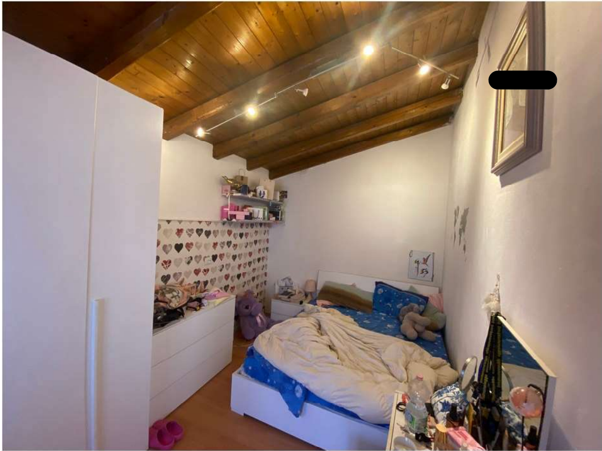
15. Camera al piano primo adiacente al vano scale e sulla porzione Sud Est del fabbricato