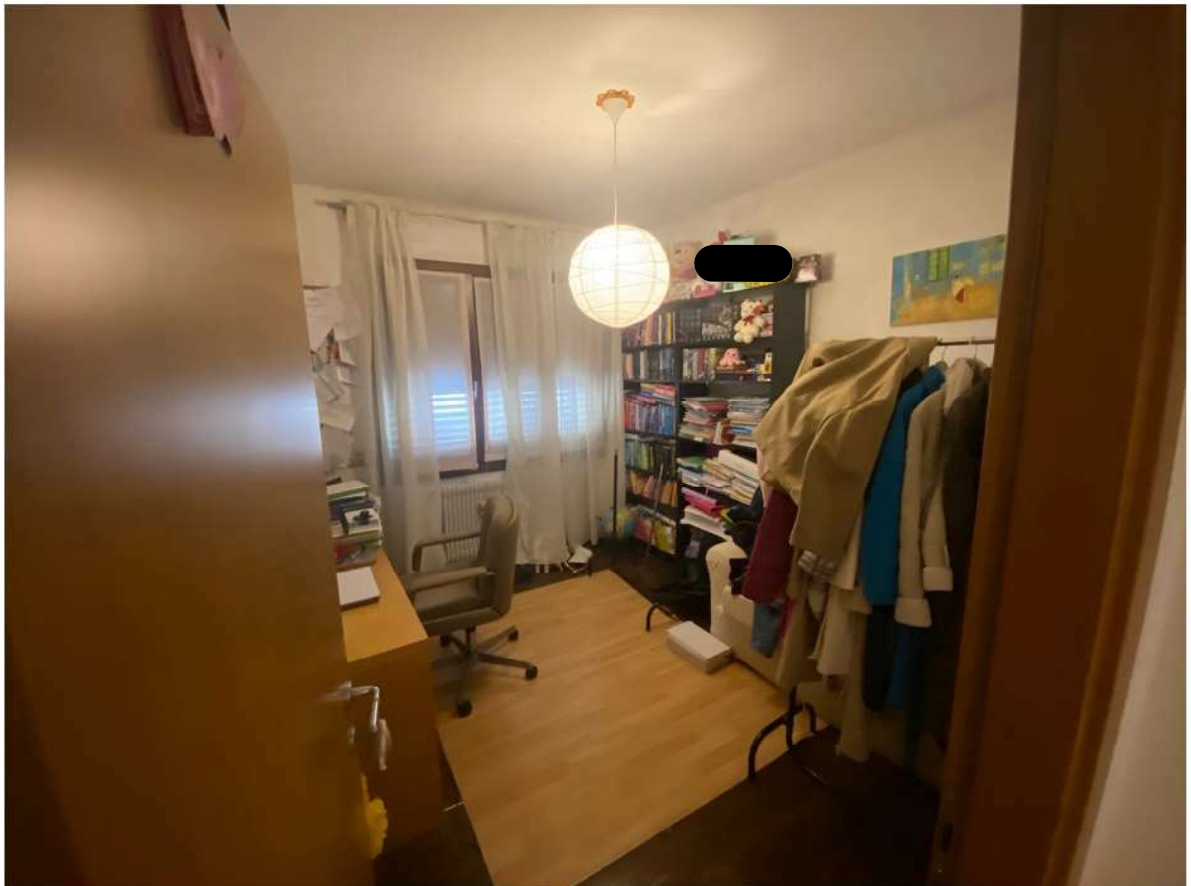
18. Camera insistente l'angolo Nord Est