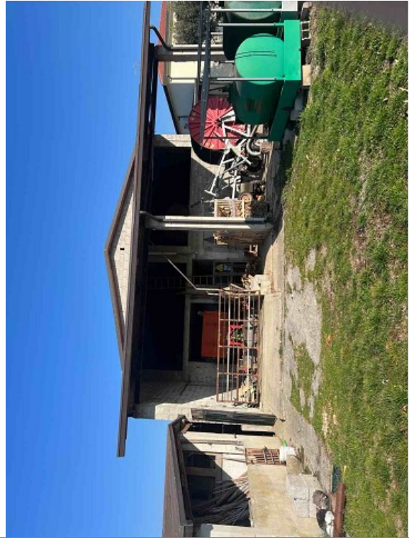
Vista ESTERNA/INTERNA ANNESSO RUSTICO