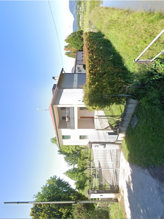
Vista ESTERNA ABITAZIONE (piano primo)