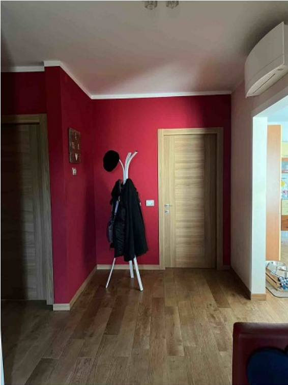
Vista INGRESSO APPARTAMENTO