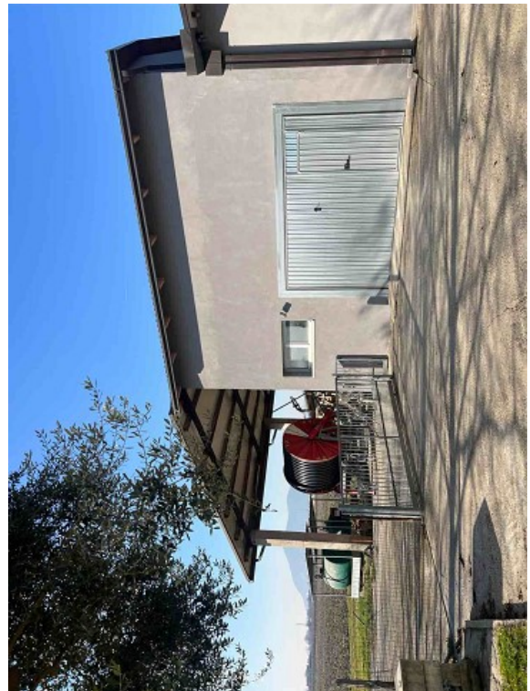
Vista ESTERNA ANNESSO RUSTICO