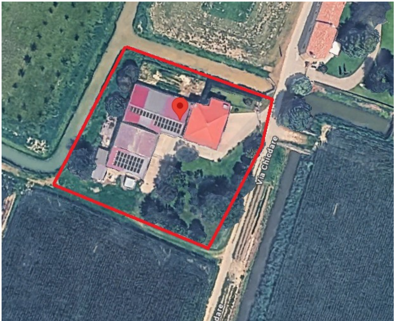
Vista ORTOFOTO (via VIA CHIODARE 43/B)