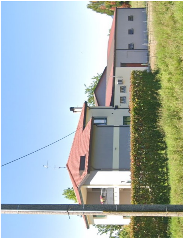
Vista ESTERNA ABITAZIONE (piano primo)