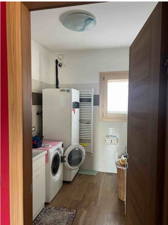
Vista INGRESSO APPARTAMENTO