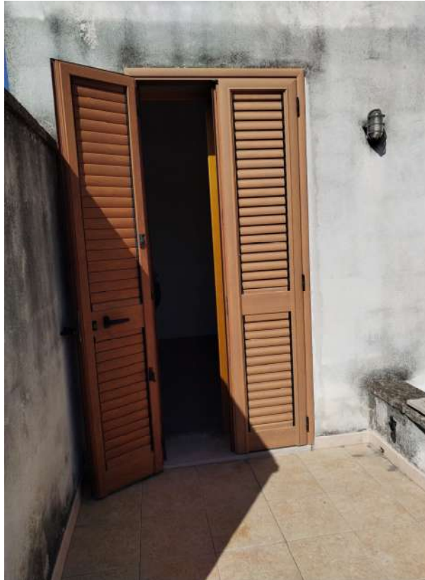
Foto n.22 – ( terrazza scoperta comunicante con il piano terra di altra proprietà )