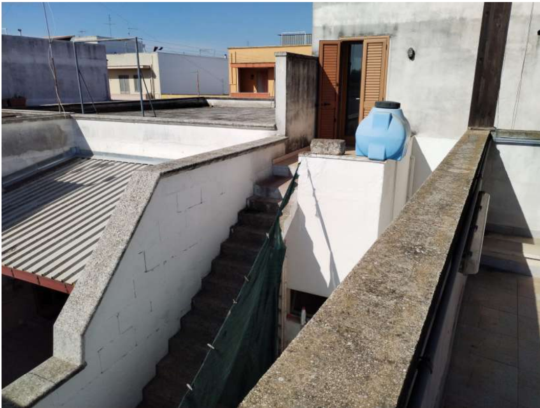
Foto n.24 – (tettoia in legno realizzata sulla terrazza scoperta “esclusiva”)