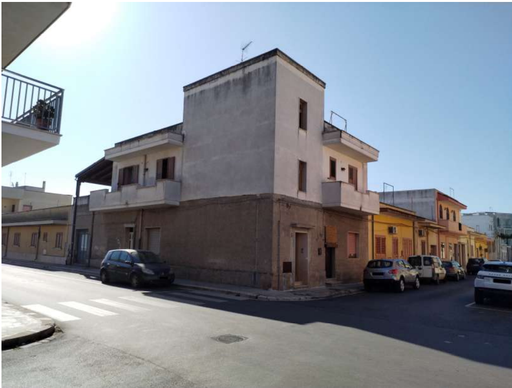
Foto n.4 – (vista esterna dell'edificio a piano primo da via Foggia)