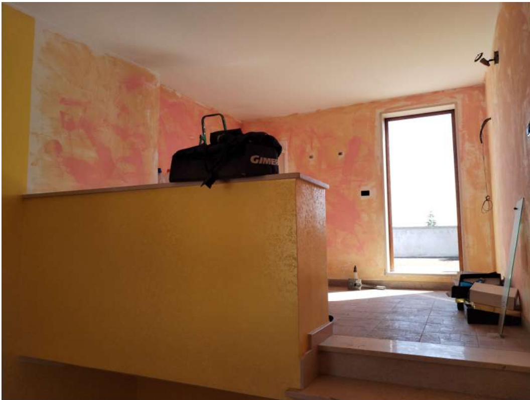
Foto n.30 – (lavanderia nel torrino scale al piano delle coperture)