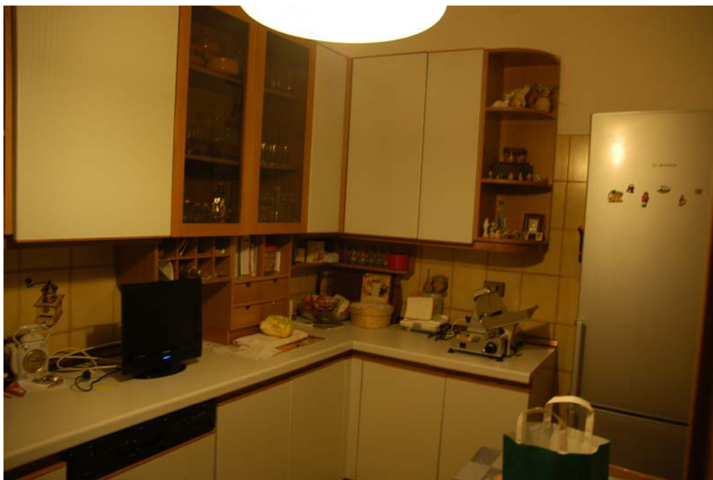
COMUNE di ANZIO Via Giunone, 12 Piano Rialzato - Cucina