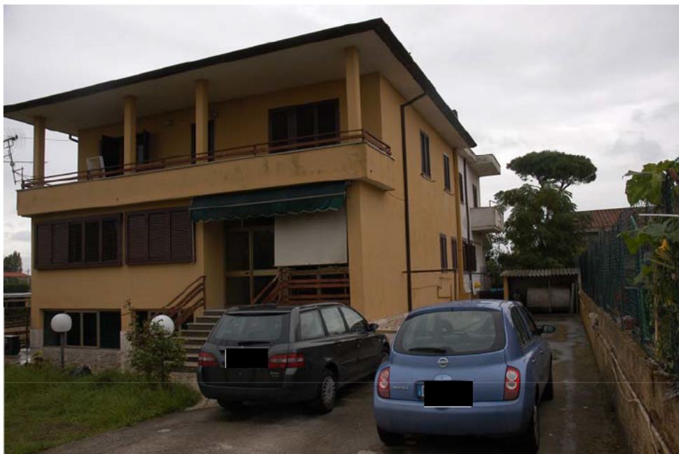
COMUNE di ANZIO Via Giunone, 12 Accesso alla Proprietà