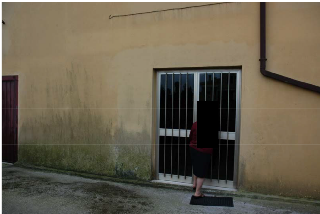
COMUNE di ANZIO Via Giunone, 12 Piano Seminterrato Accesso alla ex Cantina