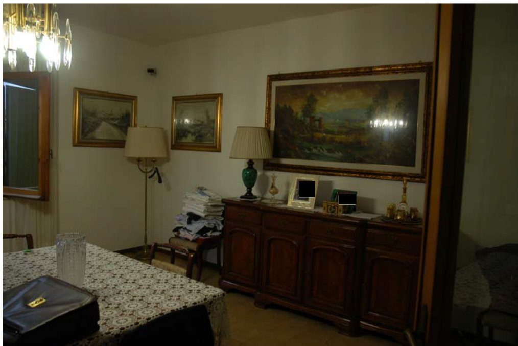
COMUNE di ANZIO Via Giunone, 12 soggiorno