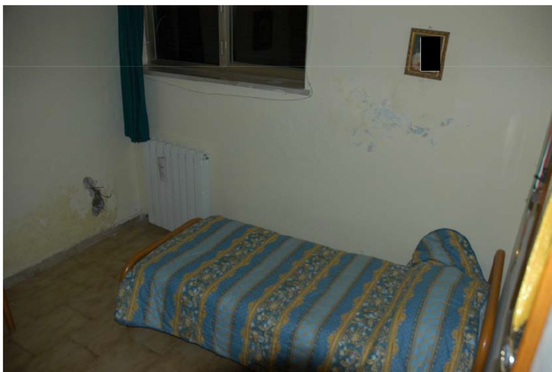
COMUNE di ANZIO Via Giunone, 12 Piano Seminterrato - Letto