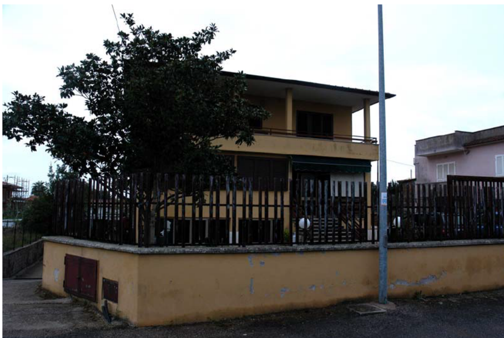
COMUNE di ANZIO Via Giunone, 12 Accesso alla Proprietà