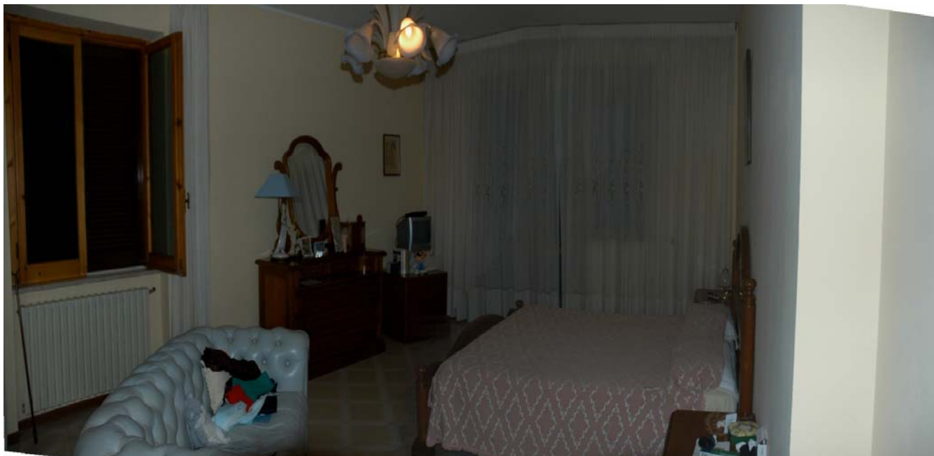
COMUNE di ANZIO Via Giunone, 12 Piano Primo - Letto