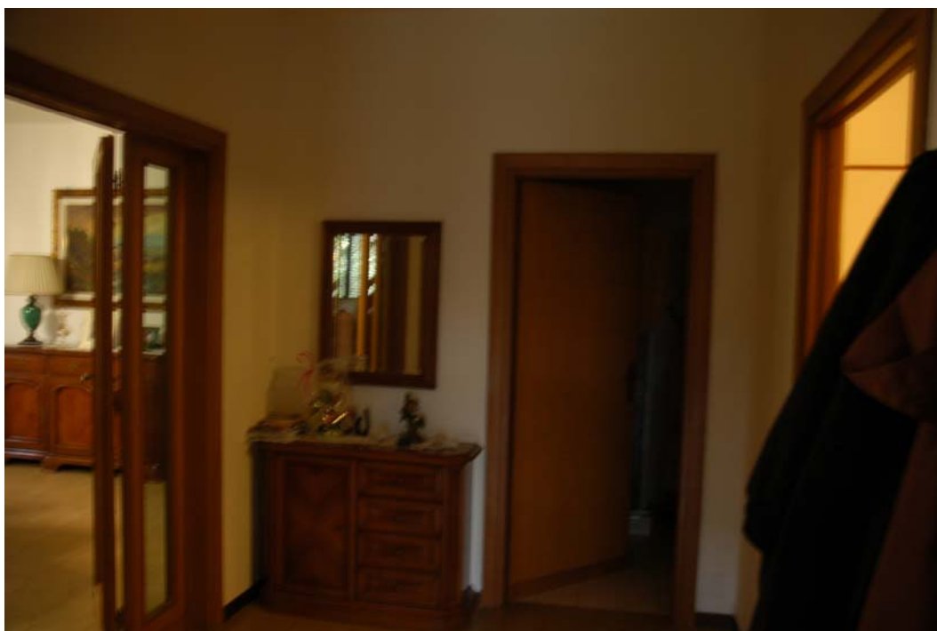
COMUNE di ANZIO Via Giunone, 12 Piano Rialzato - disimpegno