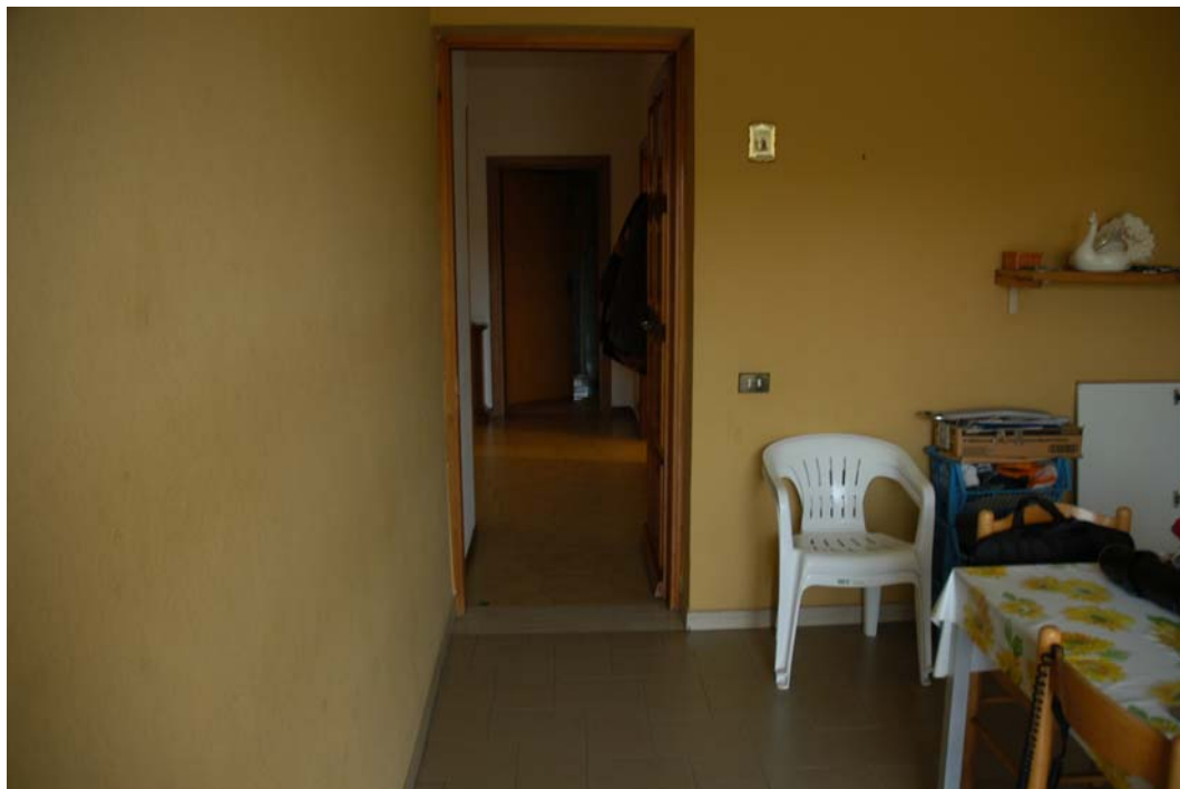
COMUNE di ANZIO Via Giunone, 12 Ingresso al piano rialzato