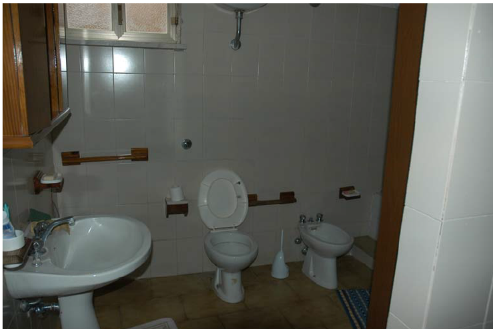
COMUNE di ANZIO Via Giunone, 12 Piano Seminterrato - bagno