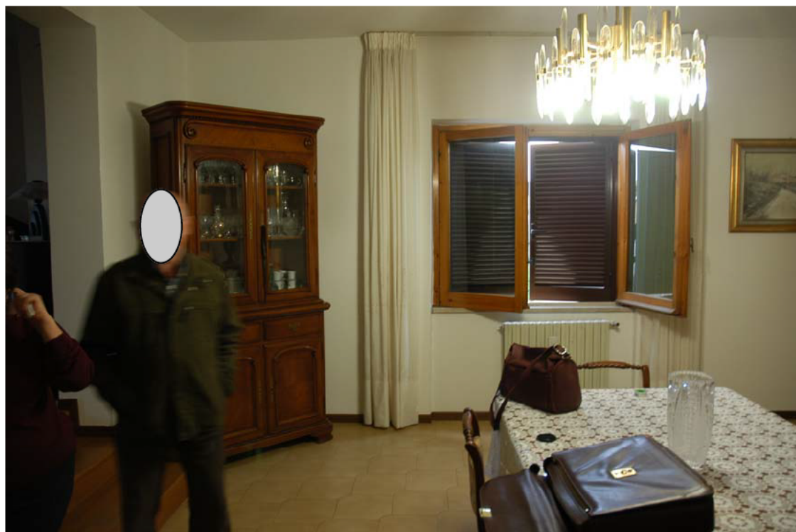
COMUNE di ANZIO Via Giunone, 12 soggiorno