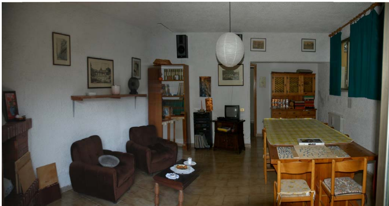
COMUNE di ANZIO Via Giunone, 12 Piano Seminterrato - Soggiorno ex Cantina