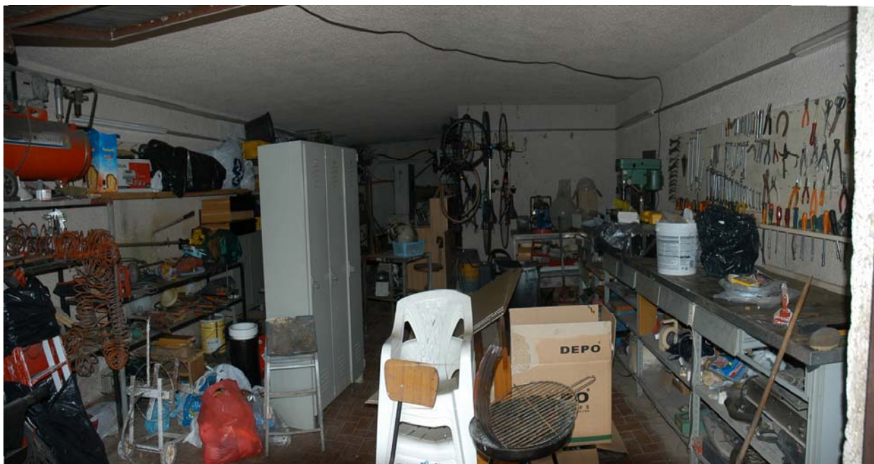
COMUNE di ANZIO Via Giunone, 12 Garage