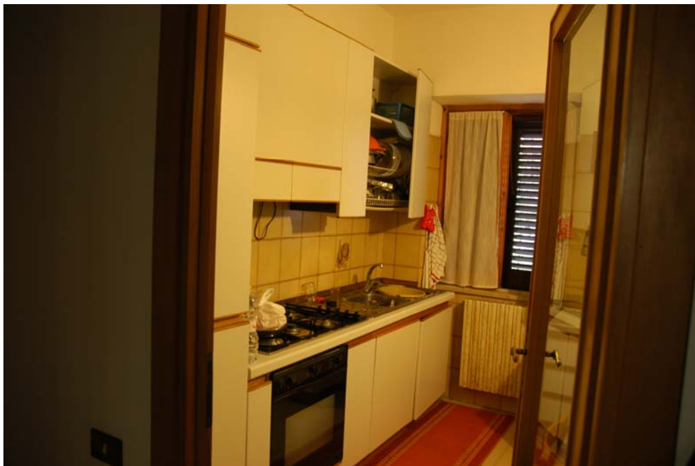
COMUNE di ANZIO Via Giunone, 12 Piano Rialzato - Cucina