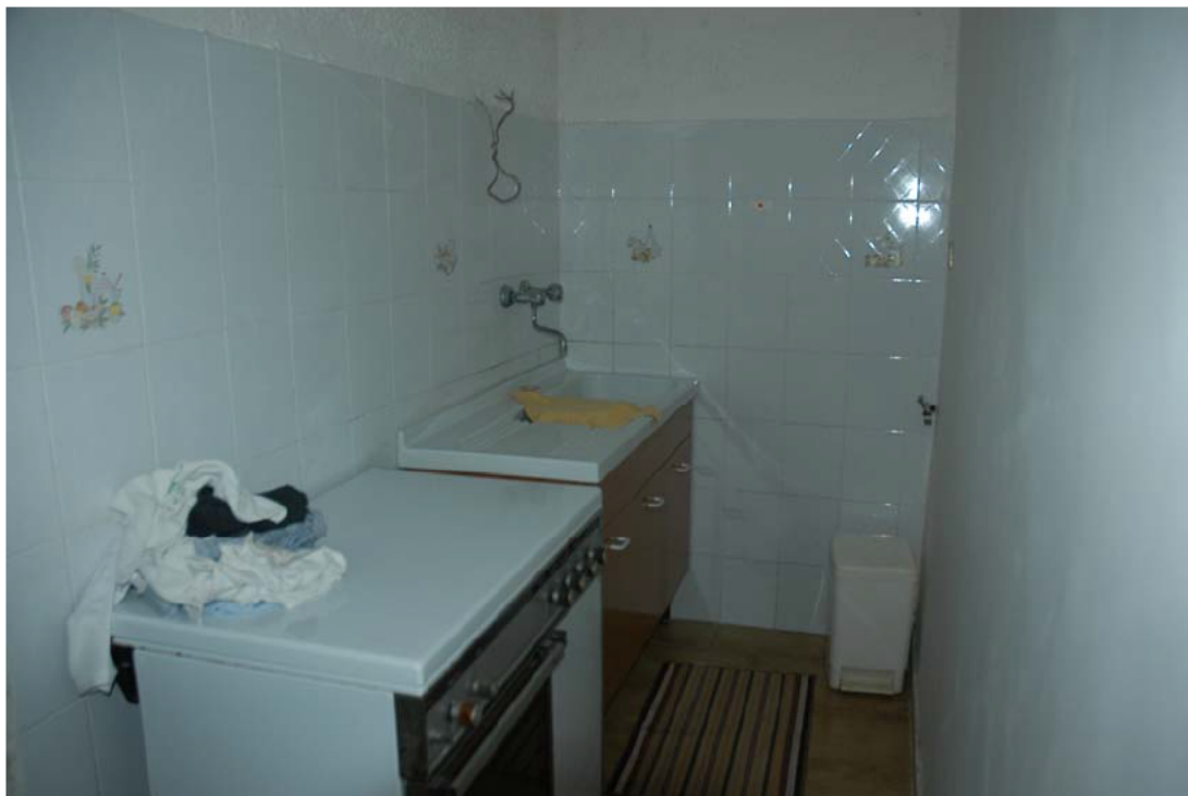
COMUNE di ANZIO Via Giunone, 12 Piano Seminterrato - Cucinino