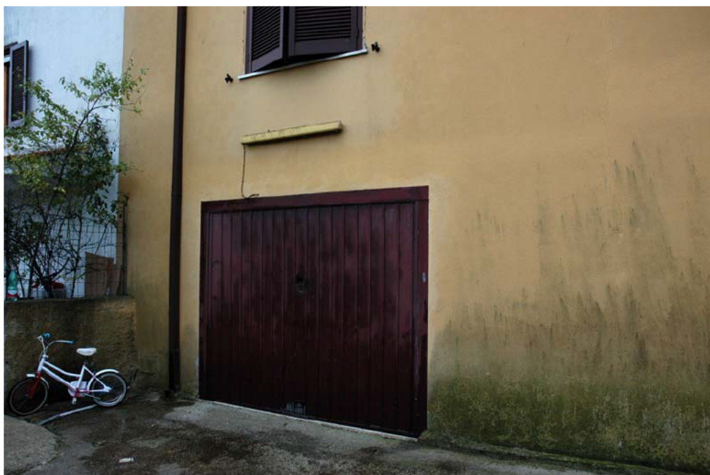
COMUNE di ANZIO Via Giunone, 12 Piano Seminterrato Accesso al Garage