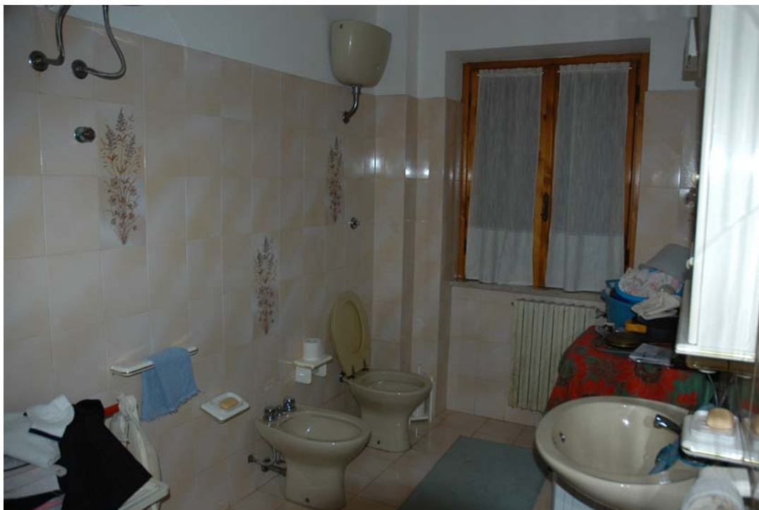
COMUNE di ANZIO Via Giunone, 12 Piano Rialzato -Bagno