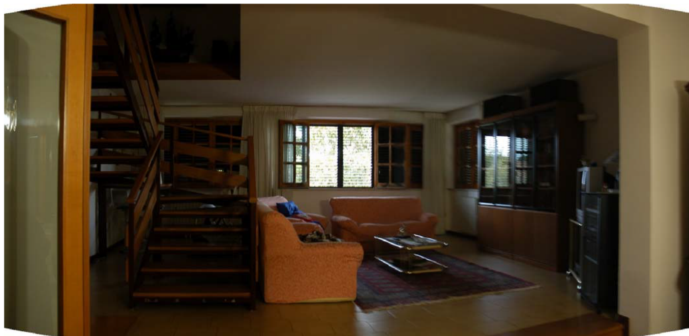
COMUNE di ANZIO Via Giunone, 12 Soggiorno