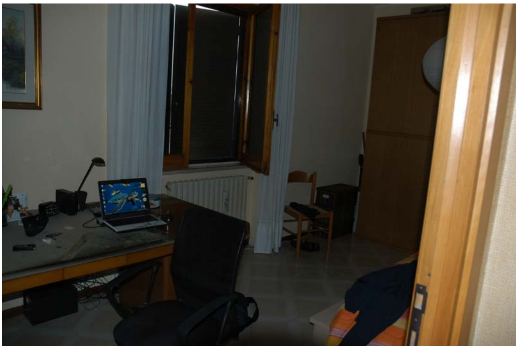
COMUNE di ANZIO Via Giunone, 12 Piano Primo - Letto