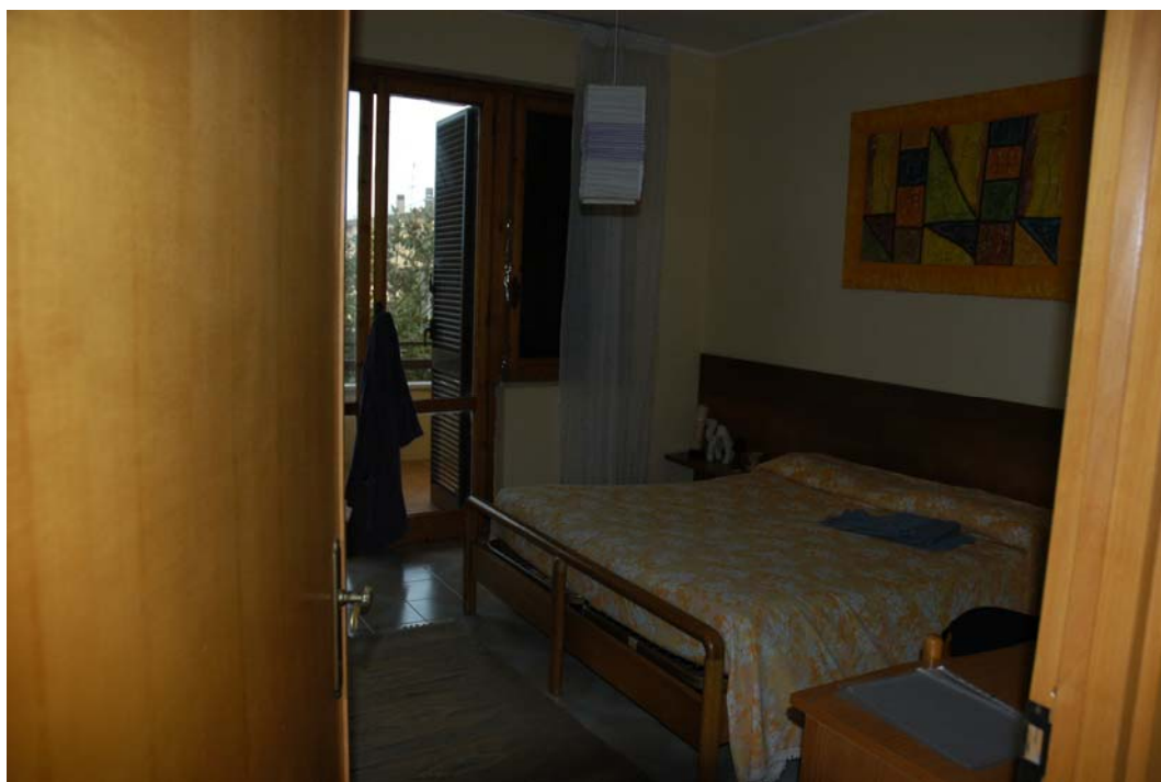
COMUNE di ANZIO Via Giunone, 12 Piano Primo - Letto