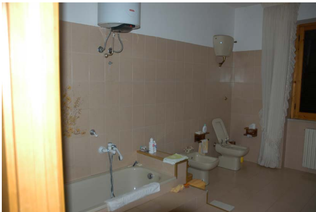
COMUNE di ANZIO Via Giunone, 12 Piano Primo - Bagno