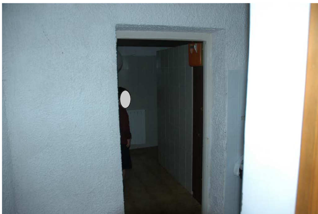
COMUNE di ANZIO Via Giunone, 12 Piano Seminterrato - disimpegno