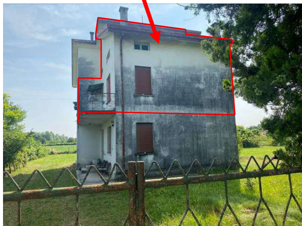
prospetto nord/est dell'appartamento oggetto di E.I.

appartamento oggetto di esecuzione immobiliare