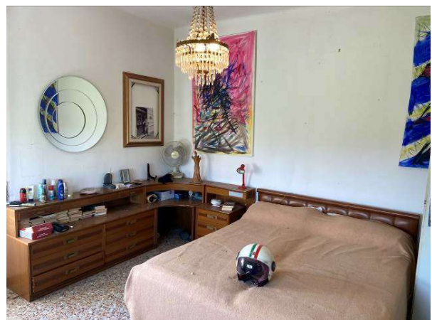
vista camera a est/sud