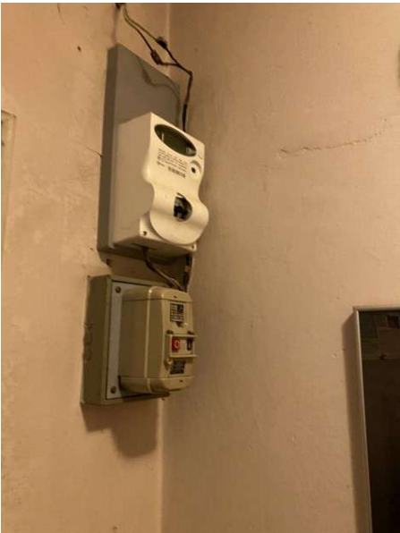
vista unico contatore elettrico