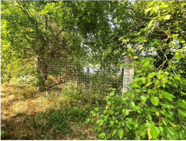
ulteriore vista accesso carraio non terminato