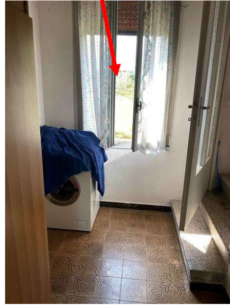
vista "ingresso e vano scala" sub 3 comune al sub 1 di proprietà terzi e sub 2 di proprietà