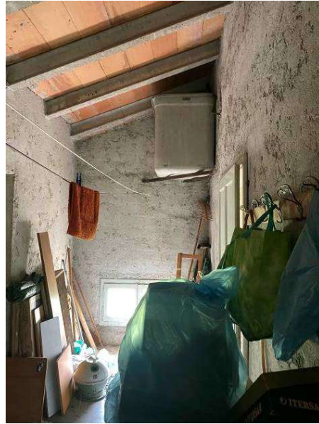
viste vano scala sub 3 comune al sub 1 di proprietà terzi e sub 2 di proprietà al secondo piano soffitta