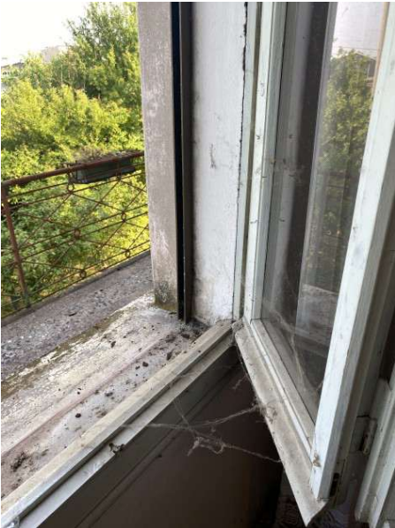
vista degrado serramenti