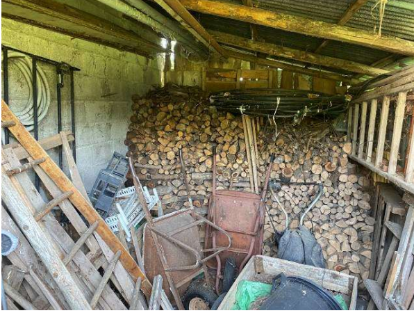
vista interna deposito