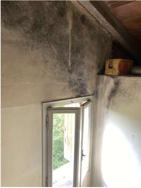
vista interna muratura nel vano scala con presenza di muffa