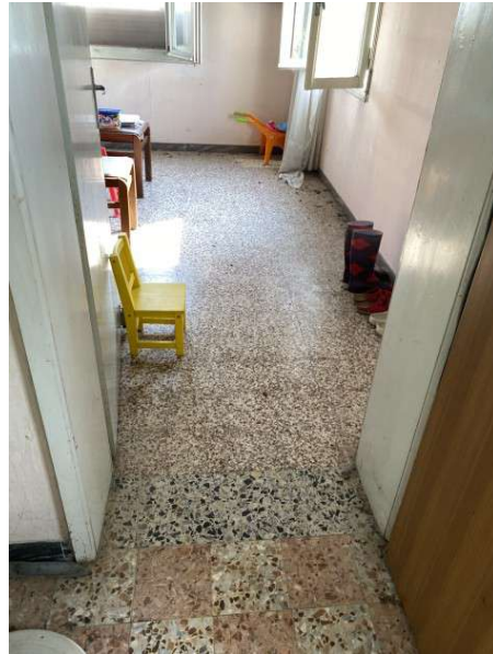
vista pavimento mediocre al primo piano