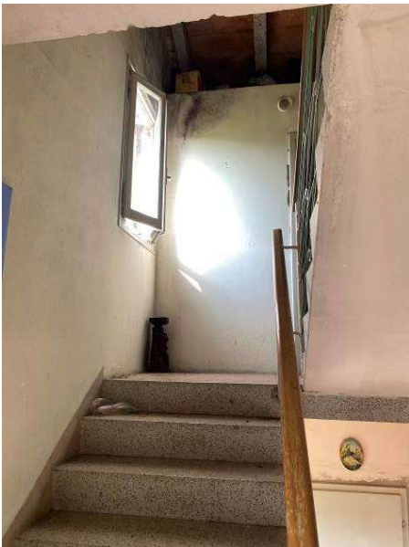
viste vano scala comune tra primo piano e secondo piano