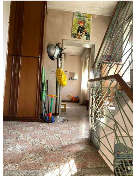
vista vano scala comune al primo piano