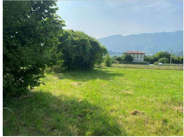
vista terreno agricolo mappale 529