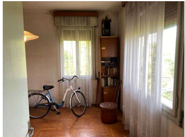
vista interna muffa nella camera a nord/est