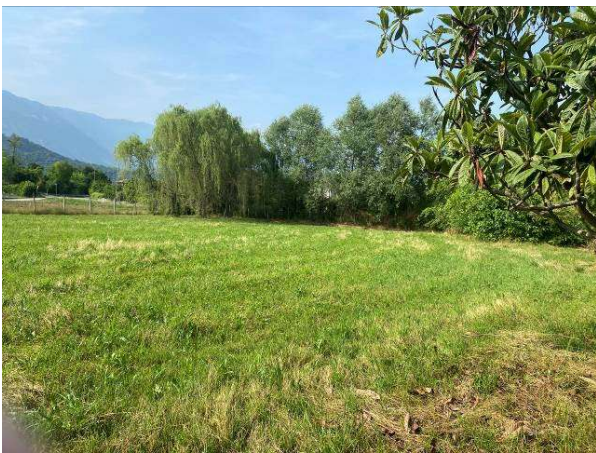
ulteriore vista terreno agricolo mappale 529