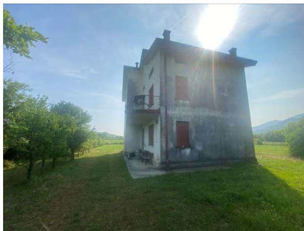
ulteriore prospetto nord/est dell'immobile