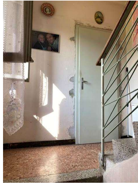
vista vano scala comune tra il piano terra e primo piano