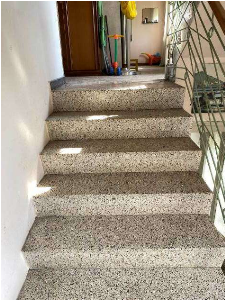
vista vano scala comune al primo piano