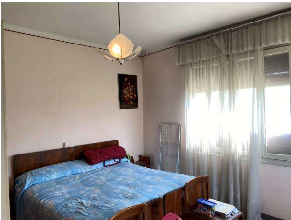
ulteriore vista camera a sud/ovest