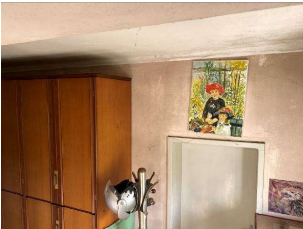
vista interna muffa nell' ingresso/corridoio