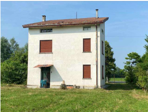
prospetto sud/est dell'immobile