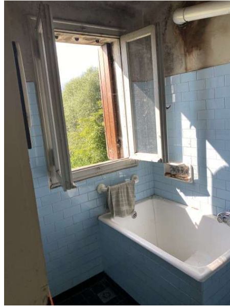
vista interna muffa nel bagno