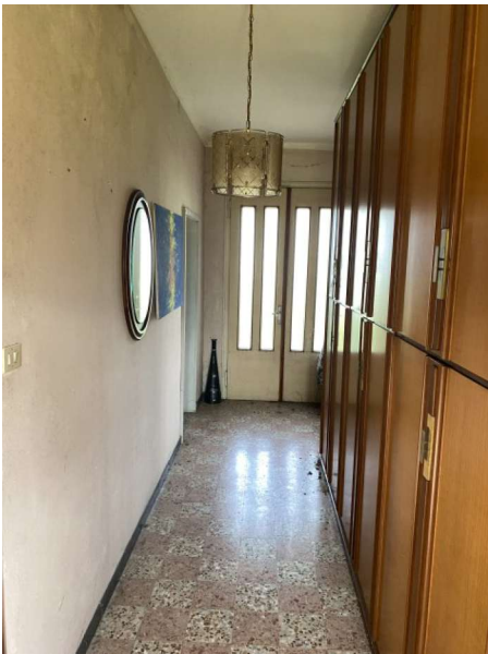
vista interna ingresso/corridoio al secondo piano