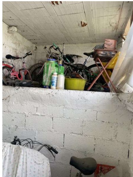
vista interna pollaio