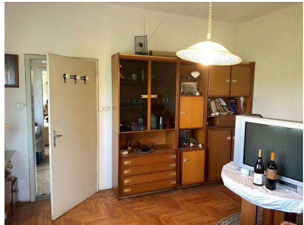
vista camera a nord/est