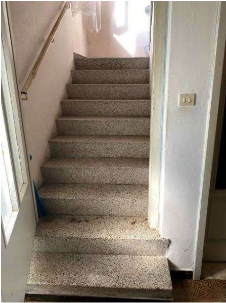
ulteriore vista vano scala comune al piano terra