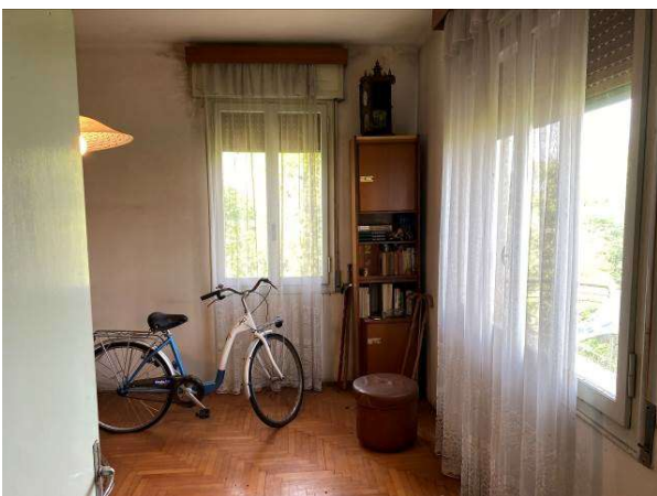
ulteriore vista camera a nord/est