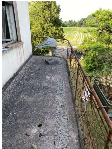
viste esterne terrazza