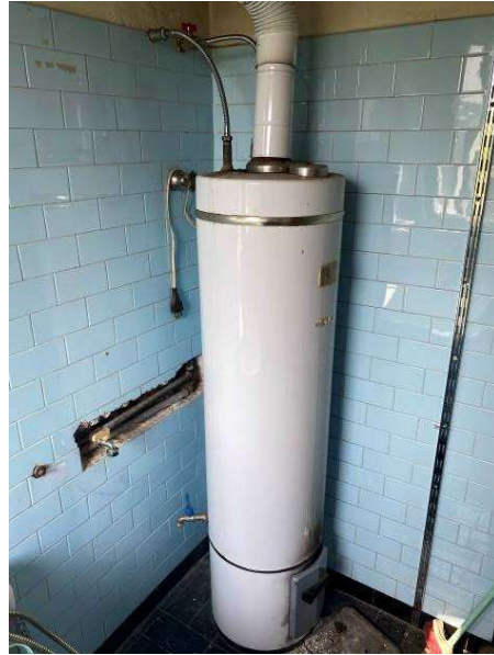
viste bagno tra primo e secondo piano