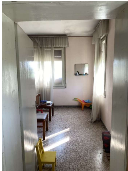
vista camera a sud/ovest del fabbricato