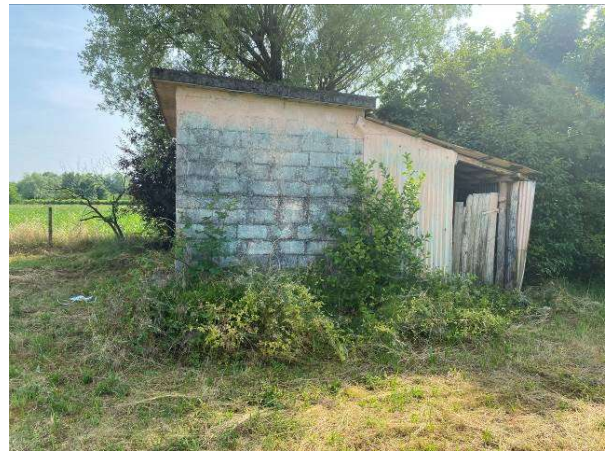
viste adiacenza esterna ad uso wc, pollaio e deposito