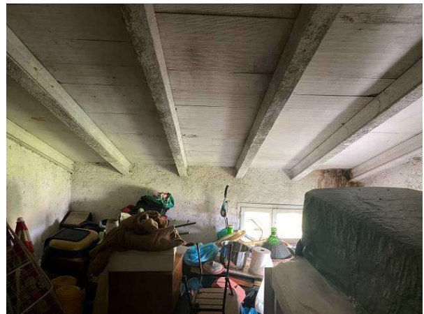
viste interne soffitta al secondo piano