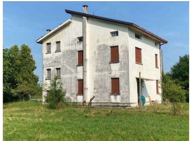
prospetto sud/ovest dell'immobile