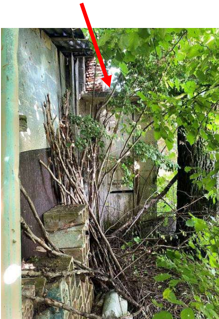
ulteriore vista esterna wc