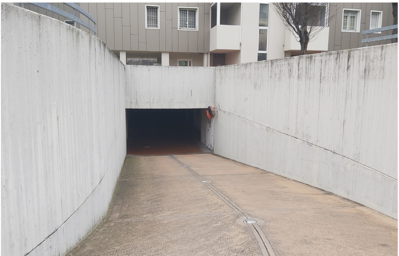
Vista su rampa carrabile di accesso al piano interrato