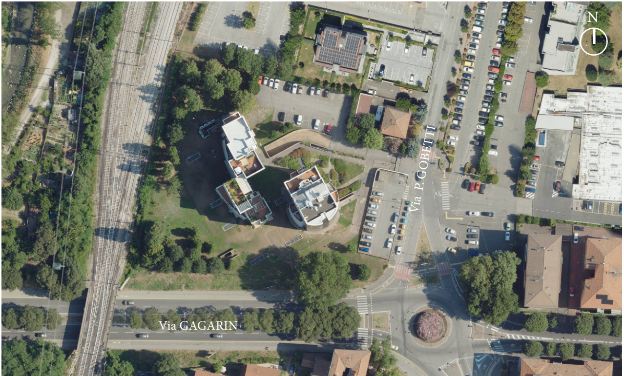
Vista area (Cartografia SIT Bologna)