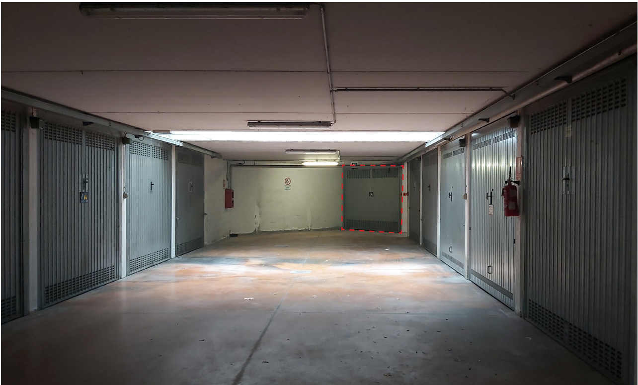
Vista su corsello carrabile al piano interrato e autorimessa in oggetto