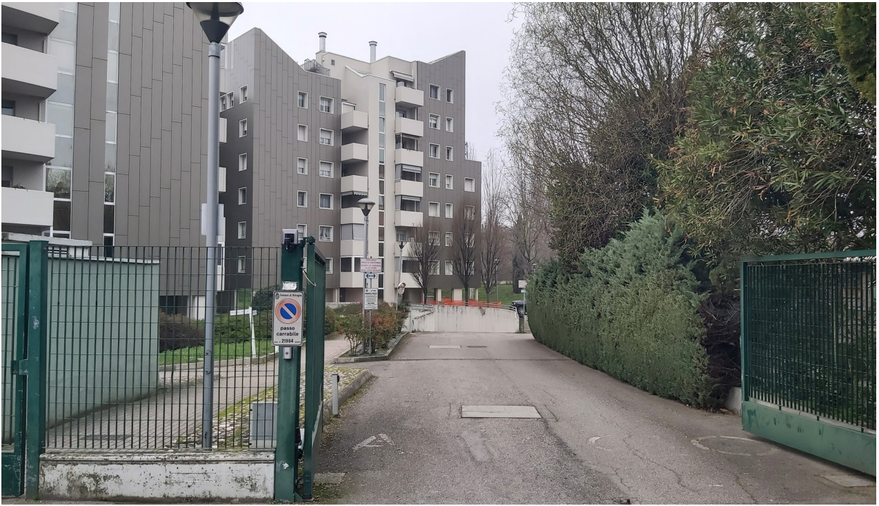
Vista sul corsello carrabile di accesso al civico 36