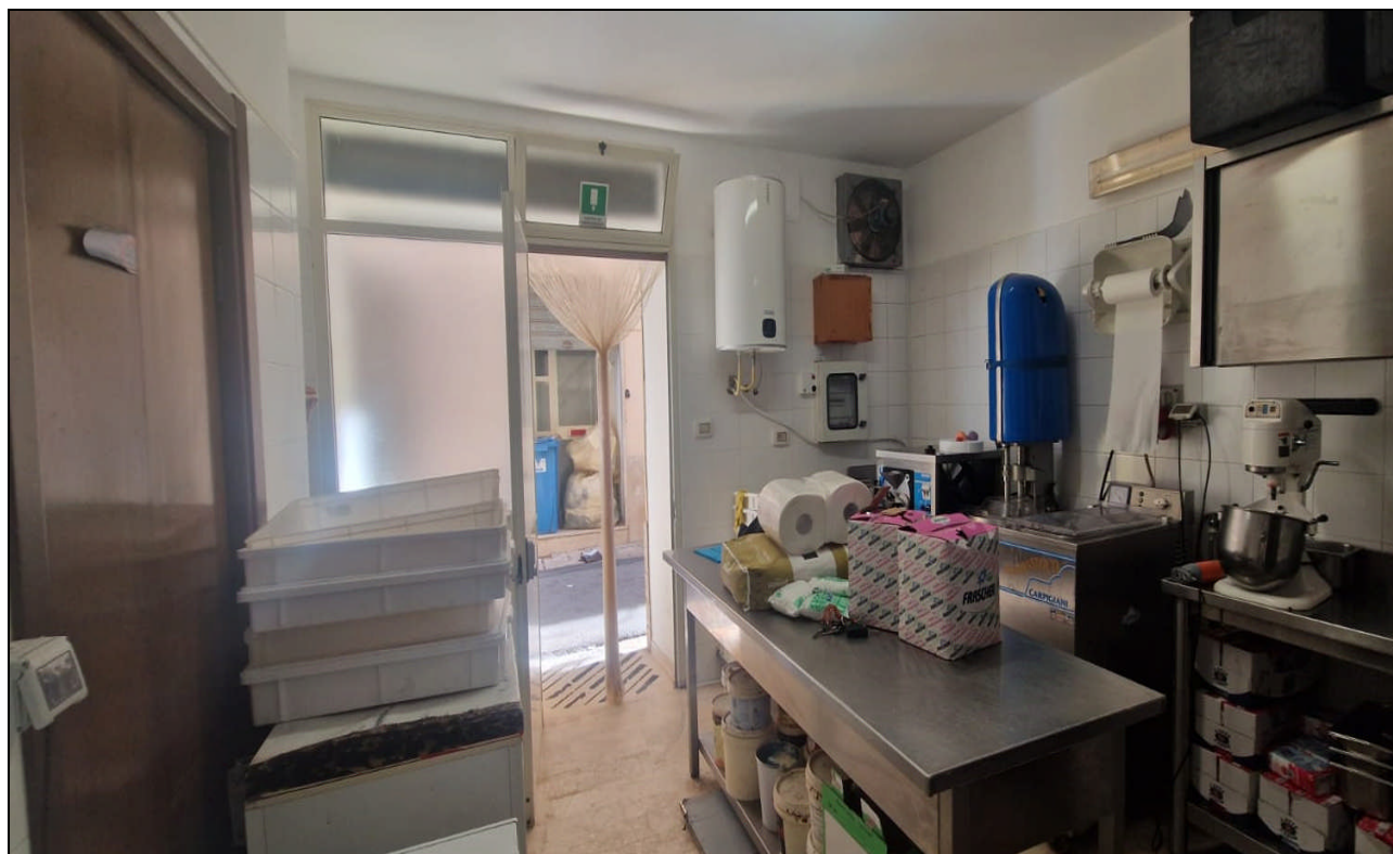
Foto 8: Particolare interno – Vano Laboratorio lato via L. P. Cangelosi n. 13 – ALCAMO