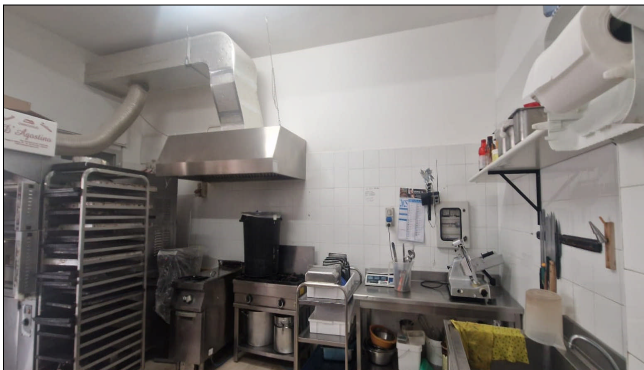
Foto 10: Particolare interno – Vano Laboratorio lato via Sant’Oliva n. 10-12 – ALCAMO