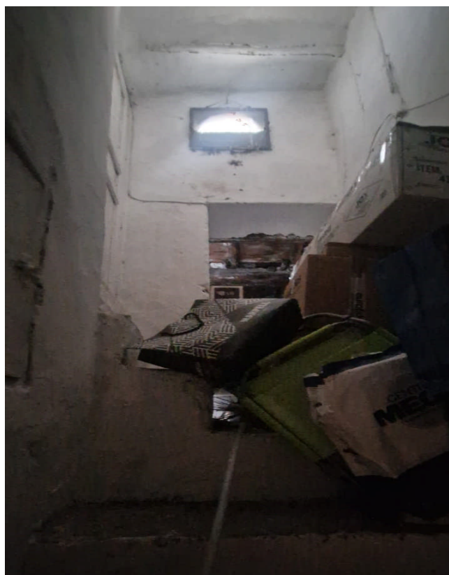
Foto 19: Particolare vecchia scala interna di accesso ai piani secondo e terzo