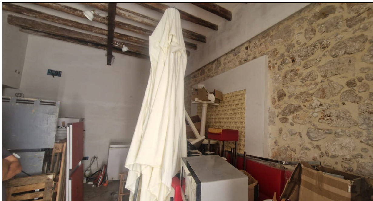
Foto 3: Panoramica interna vano principale via Leonardo Pipitone Cangelosi n. 9 – ALCAMO