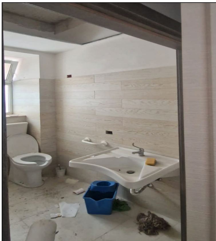
Foto 5: Panoramica interna vano w.c. locale via Leonardo Pipitone Cangelosi n. 9 – ALCAMO