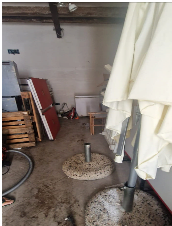
Foto 4: Panoramica interna vano principale via Leonardo Pipitone Cangelosi n. 9 – ALCAMO