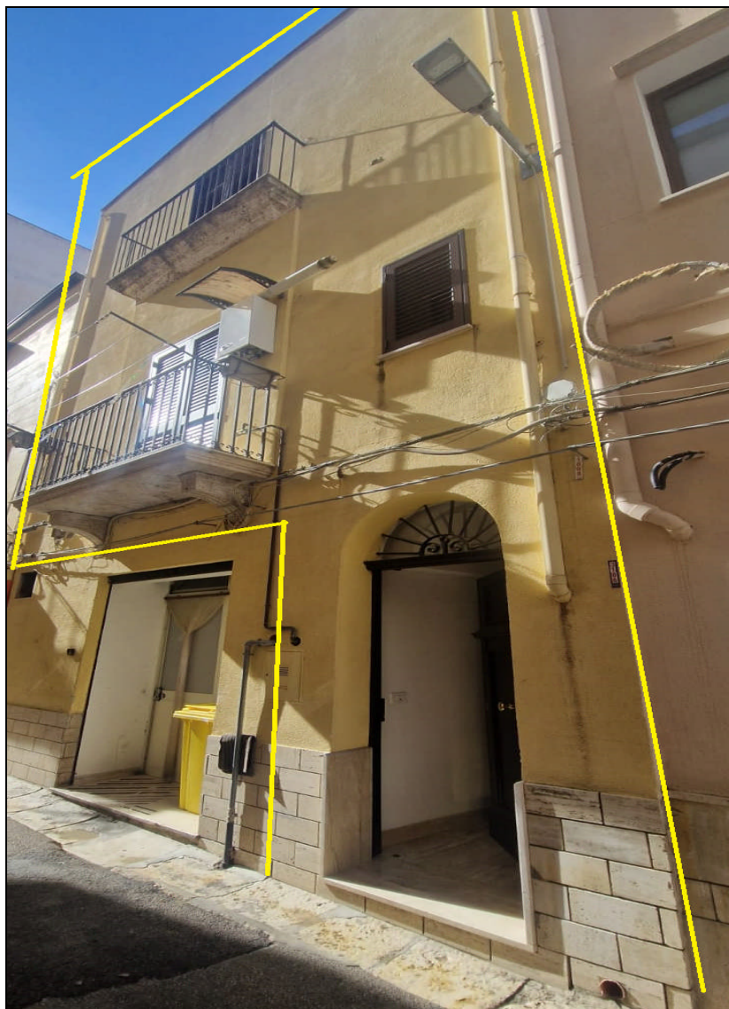
Foto 13: Panoramica Appartamento piano 1-2-3 con ingresso via L.P. Cangelosi n. 11 – ALCAMO