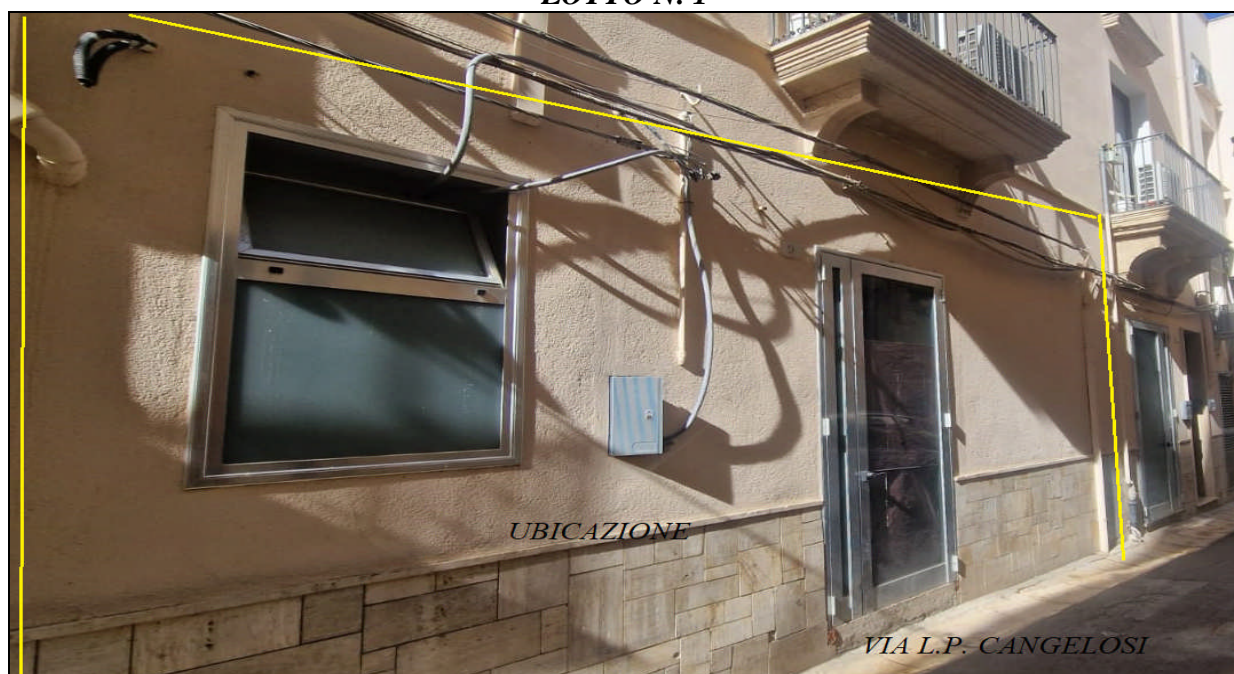
Figura 2: Panoramica esterna locale artigianale via Leonardo Pipitone Cangelosi n. 9 – ALCAMO