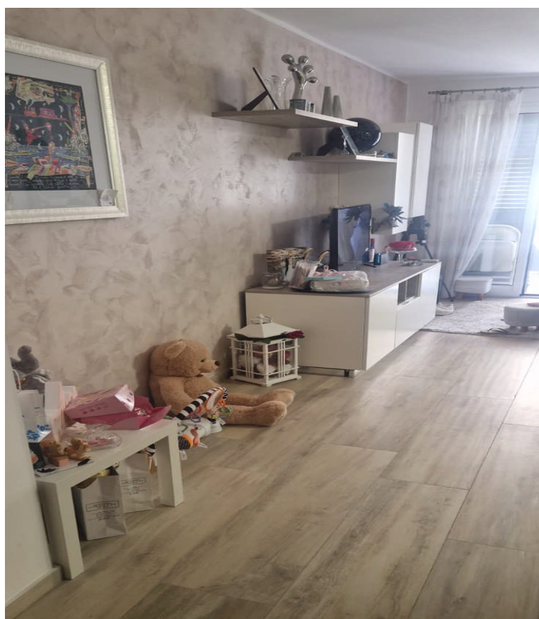
Foto 15: Particolare interno zona pranzo Appartamento piano primo