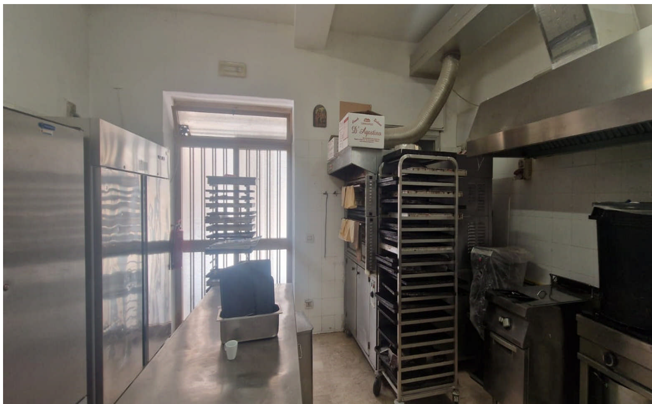
Foto 9: Particolare interno – Vano Laboratorio lato via Sant’Oliva n. 10-12 – ALCAMO