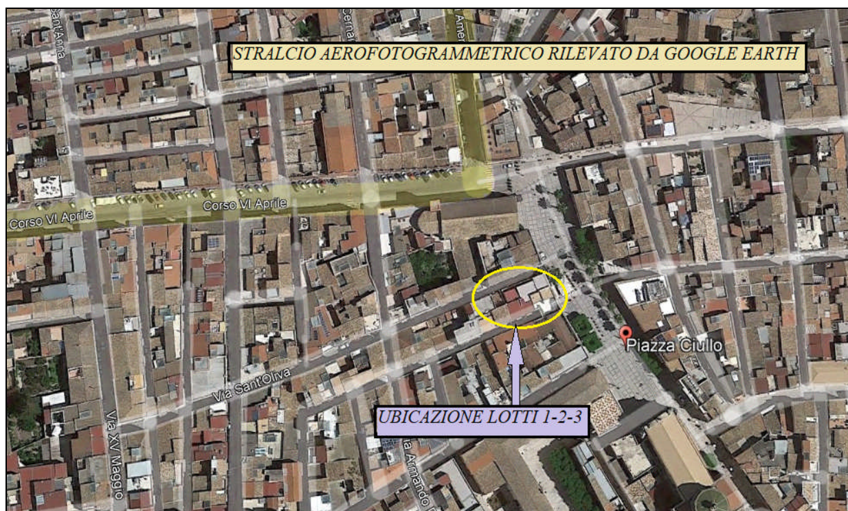
Foto 1: Panoramica rilevata da Google Earth – Ubicazione LOTTI 1-2-3 – Comune di ALCAMO