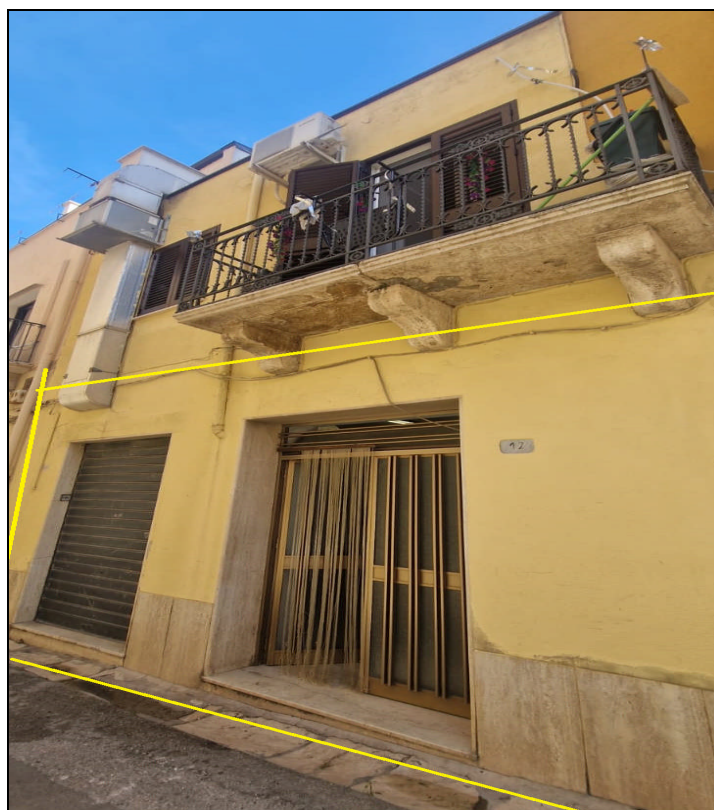
Foto 7: Panoramica ingresso locale Artigianale lato via Sant'Oliva n. 10-12 – ALCAMO