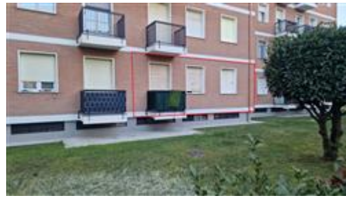
Foto esterna retro camere bagno