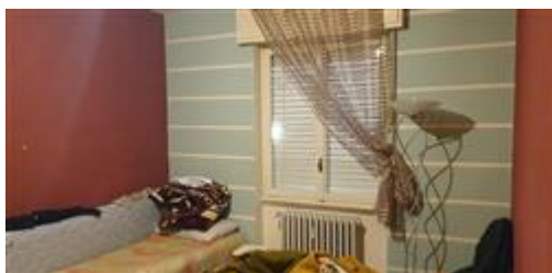
camera da letto