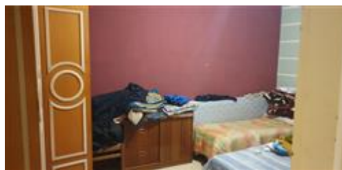
camera da letto