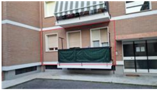
Foto esterna fronte cucina soggiorno