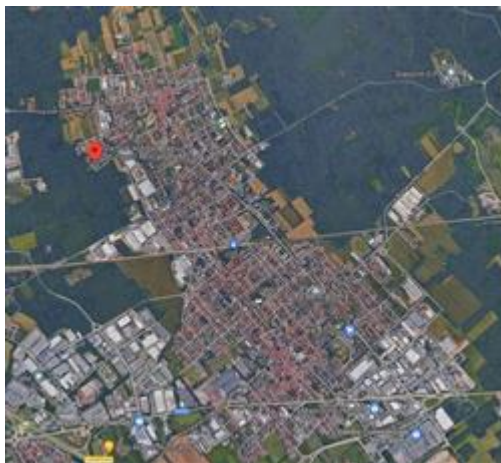
Inquadramento nel territorio comunale

I beni sono ubicati in zona periferica in un'area residenziale, le zone limitrofe si trovano in un'area residenziale. Il traffico nella zona è locale, i parcheggi sono sufficienti. Sono inoltre presenti i servizi di urbanizzazione primaria e secondaria.