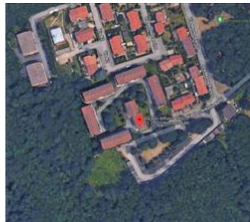
Inquadramento nel quartiere