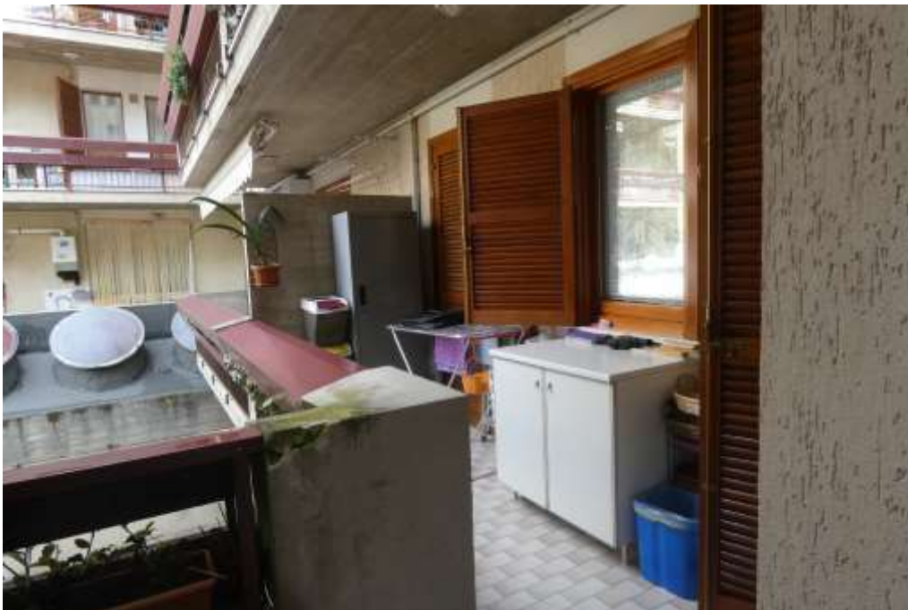
Foto 6 l'ampio balcone sul lato ovest in cui si affacciano le porte-finestre della cucina e della cameretta, oltre alla finestra del bagno principale