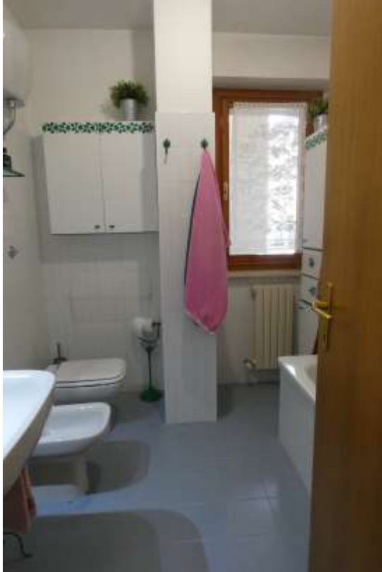
Foto 5 il bagno principale