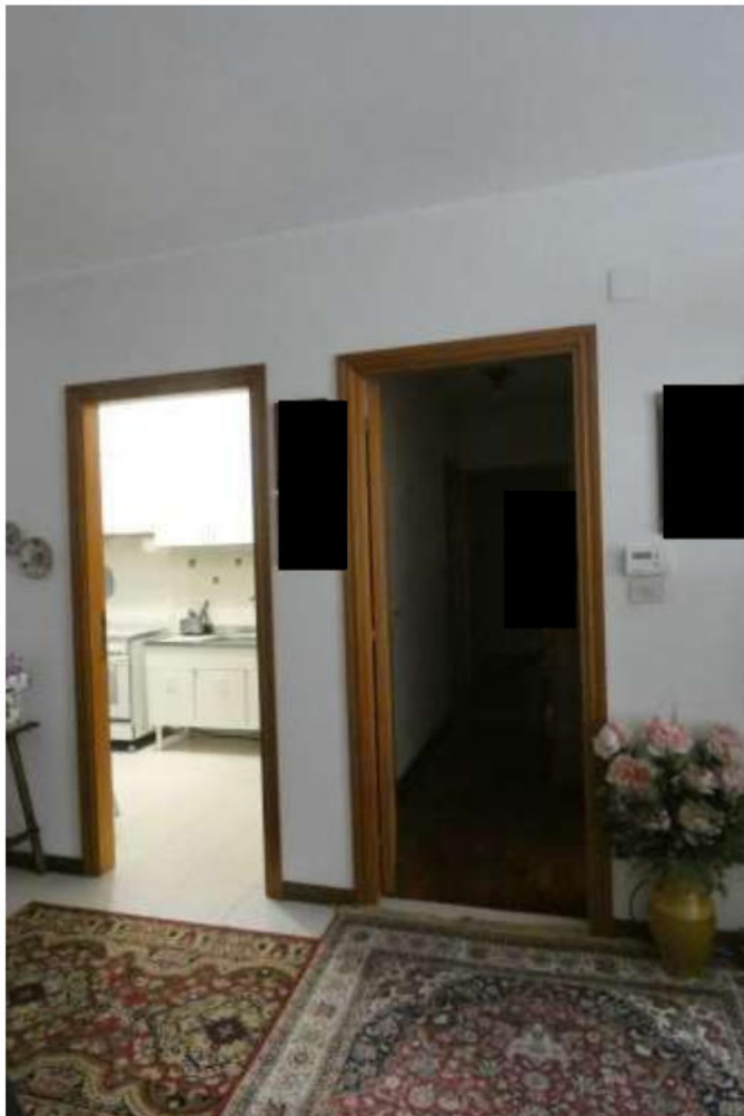
Foto 4 sulla sinistra la porta della cucina e a fianco quella che immette nella zona notte