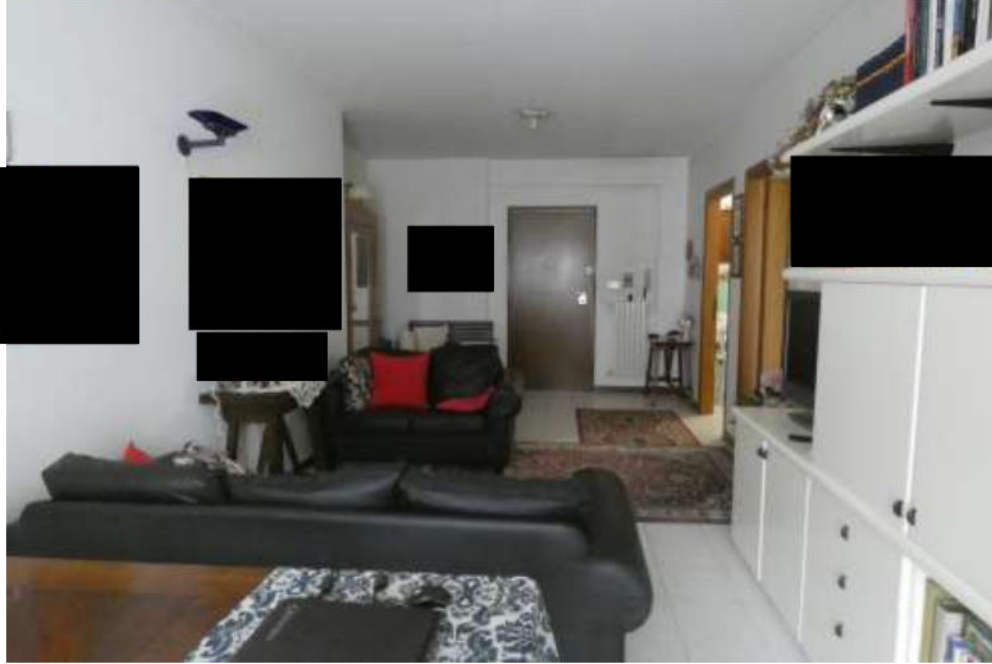
Foto 3 la foto inquadra la sala e l'ingresso, in cui è visibile il portoncino blindato, sulla destra sono appena visibili le porte della cucina e quella che immette nella zona notte