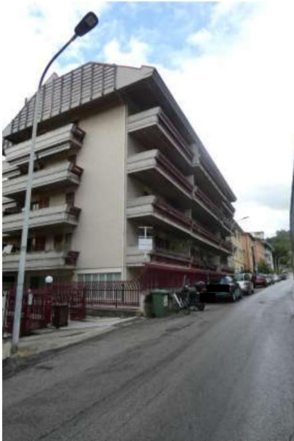
Foto 1 vista dei luoghi la via Faiano e il fabbricato in cui insistono le due u.i. oggetto di esecuzione