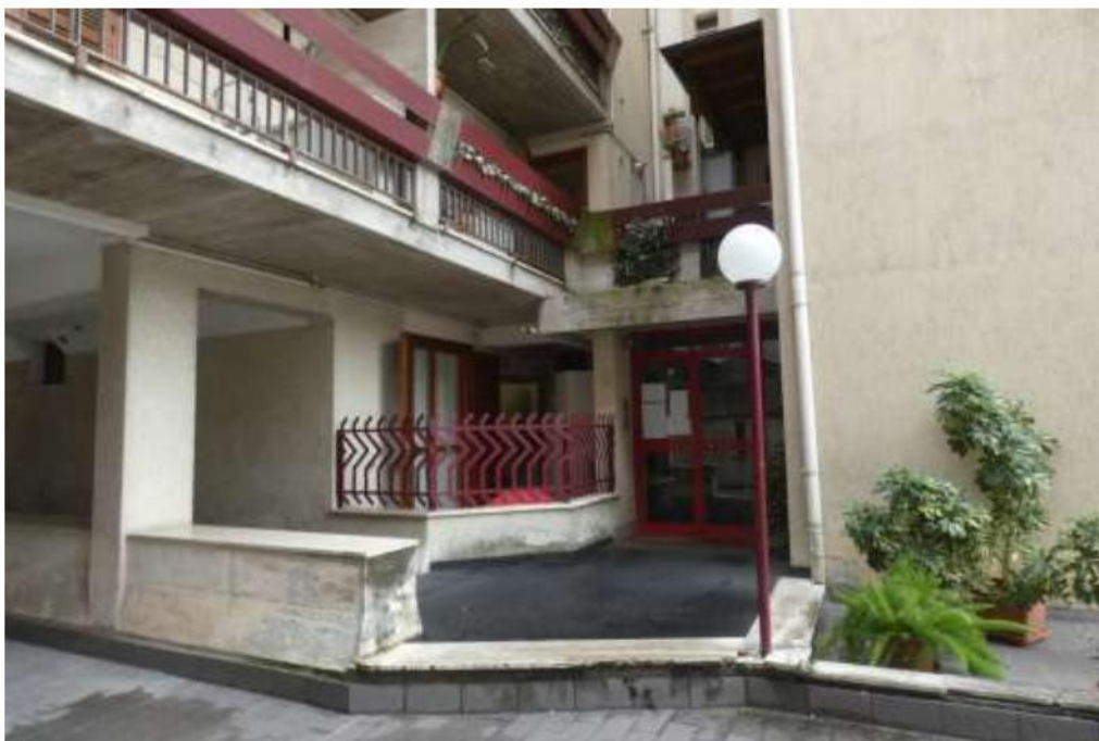
Foto 7 uno dei portoni di accesso alle scale condominiali