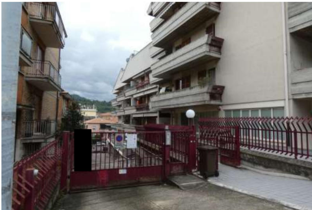
Foto 2 vista dei luoghi il cancello carrabile che immette sulla rampa a servizio dei piani seminterrati e a fianco, sul lato destro, il cancelletto per l'ingresso pedonale al civico 5/B; in fondo alla rampa si intravede la via Paciotti