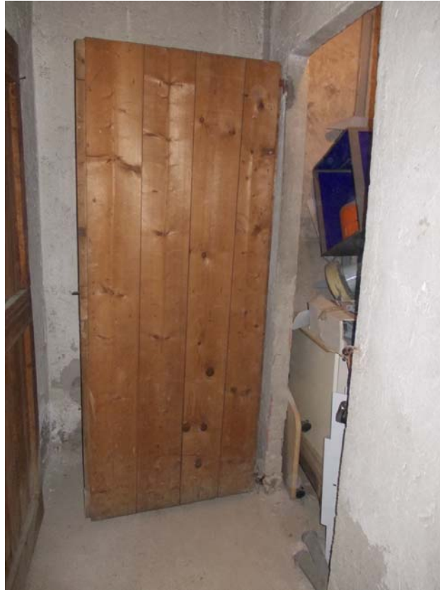
CANTINA ANNESSA N. 8

Immobile ubicato in Comune di Milano VIA ANNA NEERA N. 14 TRIBUNALE DI Milano RGE 945-2025 LOTTO 002