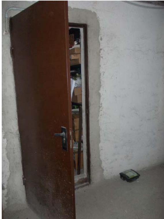
Porta fronte retro

Immobile ubicato in Comune di Milano VIA ANNA NEERA N. 14 TRIBUNALE DI Milano RGE 945-2025 LOTTO 002