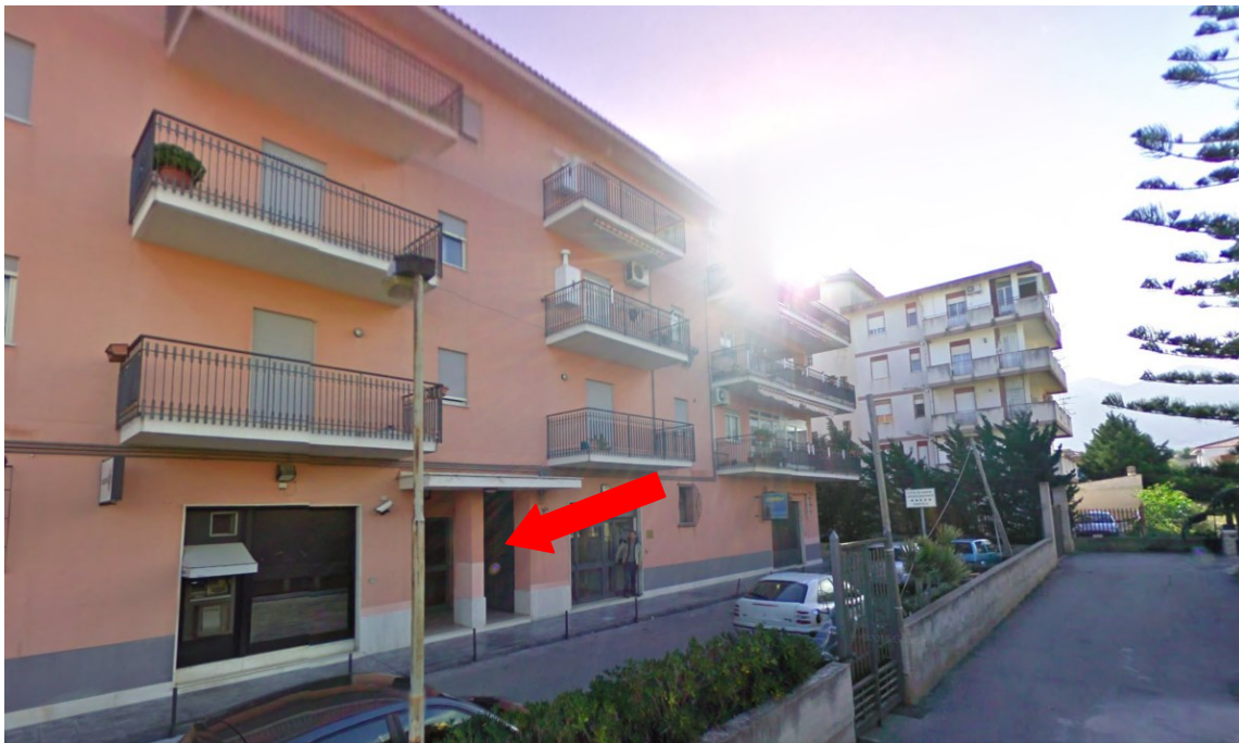
Foto n. 2 - Vista del prospetto del fabbricato ed ingresso condominiale dell'immobile oggetto della presente.