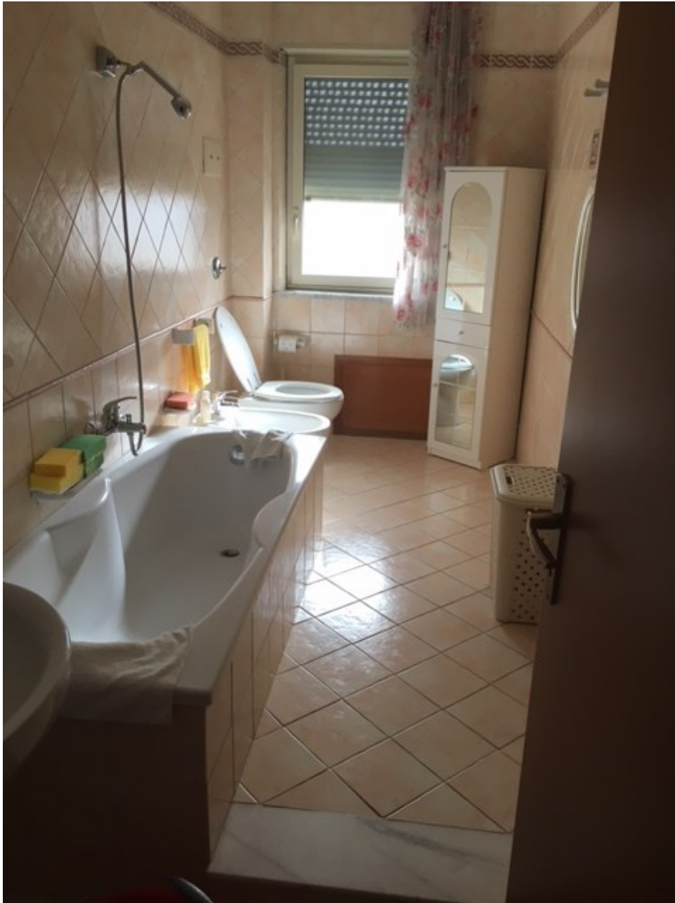
Foto n. 6 - Servizio igienico piastrellato e rivestito in ceramica dotato di vasca da bagno.