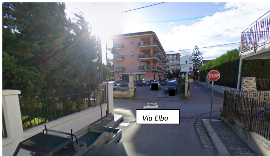
Foto n. 1 - Vista delle vie urbane che conducono al fabbricato ove è sito l'immobile oggetto della presente.