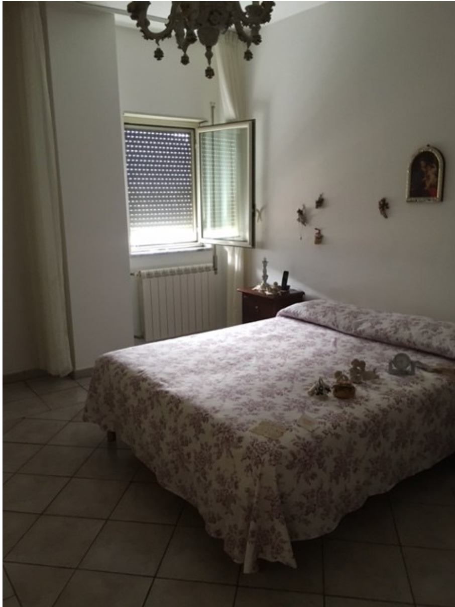
Foto n. 7 - Camera da letto patronale.