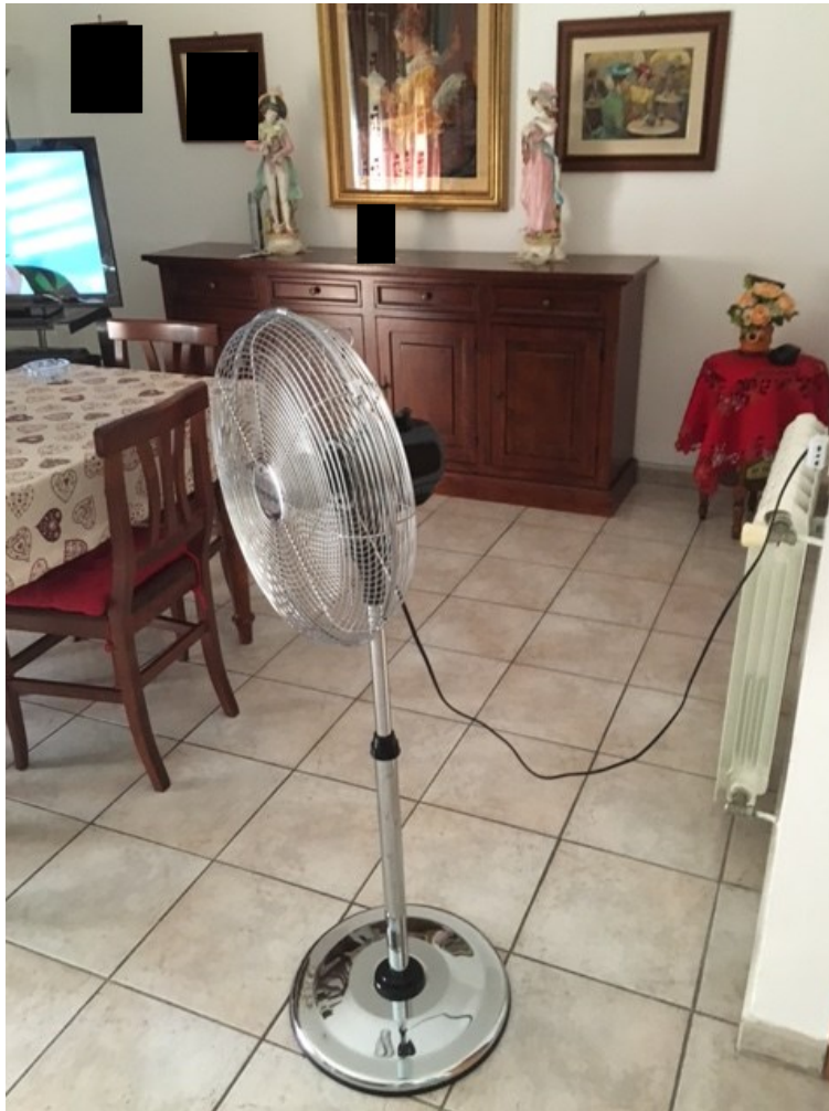
Foto n. 5 - Vista della Cucina/soggiorno, posta a destra dell'ingresso .