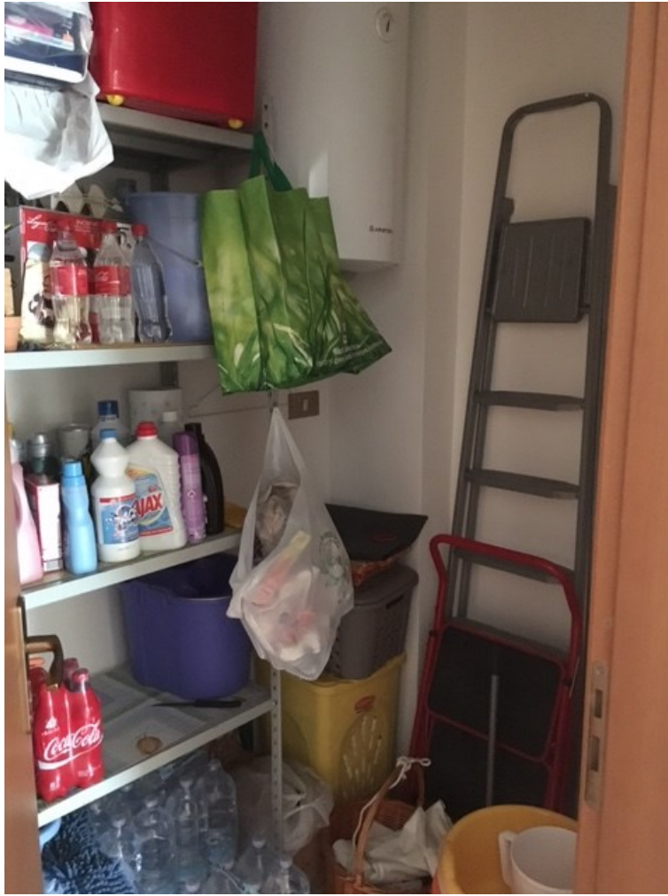
Foto n. 9 - Vista del ripostiglio, dove è ubicato lo scaldabagno a servizio dell'unità immobiliare.