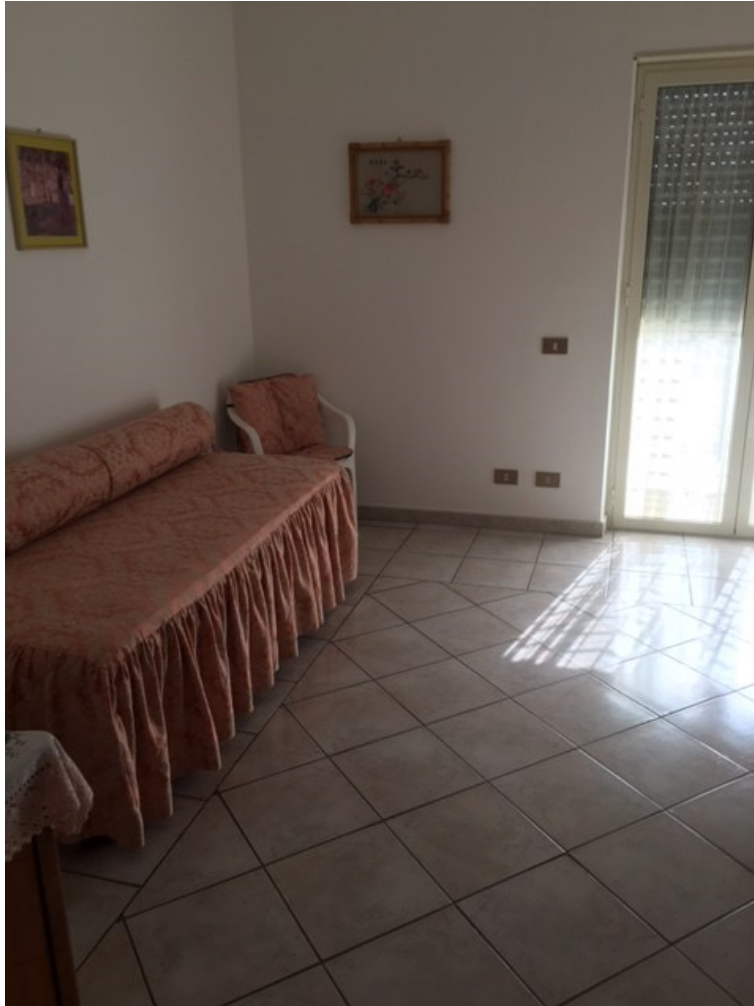
Foto n. 8 - Vano posto a sinistra dall'ingresso, con annesso balcone.