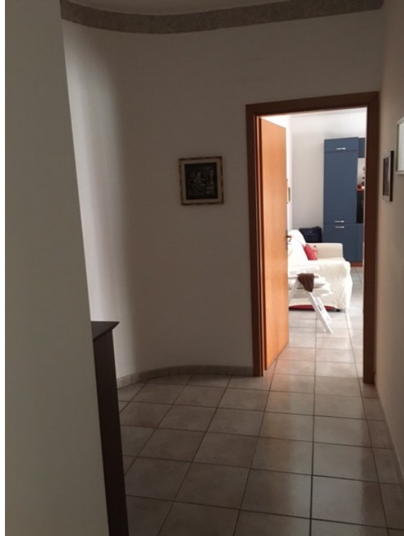
Foto n. 4 - Corridoio che disimpegna l'ingresso ai vani dell'immobile.