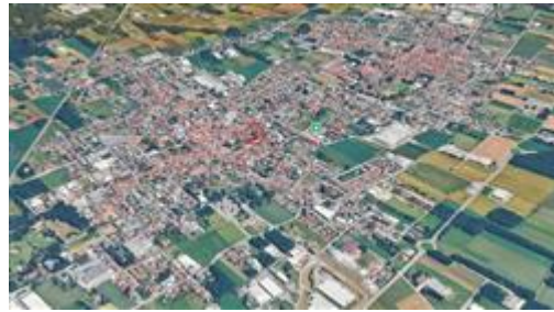
VISTA AEREA DEL COMUNE