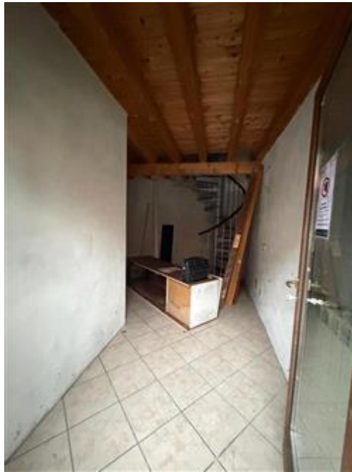
INGRESSO CAMERA A PRIMO PIANO