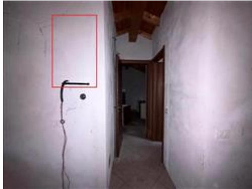
posizione allaccio caldaia