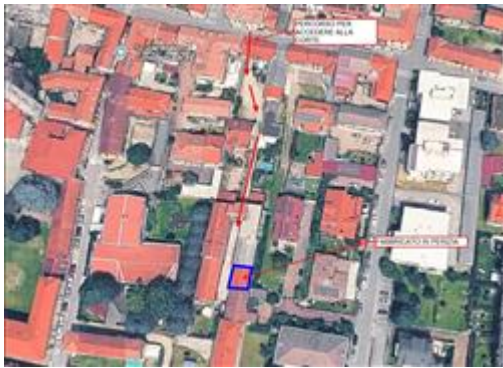
DETTAGLIO PERCORSO DI ACCESSO ALL'UNITA' IN PERIZIA