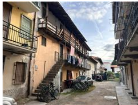
VISTA DELLA CORTE