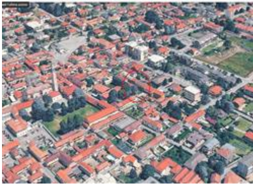
ORTOFOTO DELLA ZONA IN CUI E' UBICATO L'APPARTAMENTO IN PERIZIA