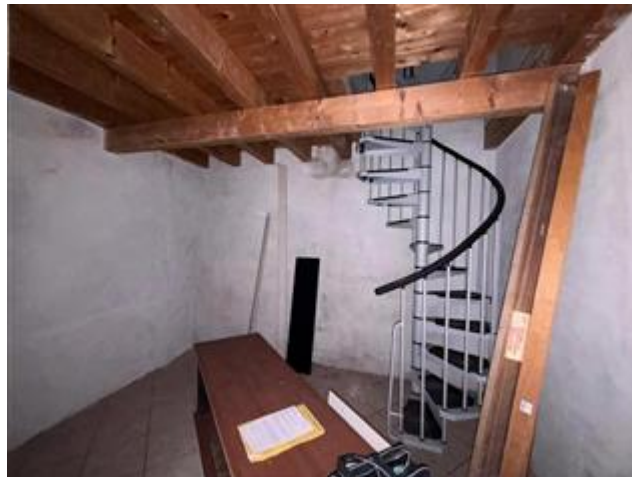
CAMERA PRIMO PIANO