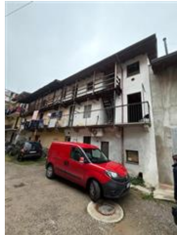
VISTA DELLA CORTE