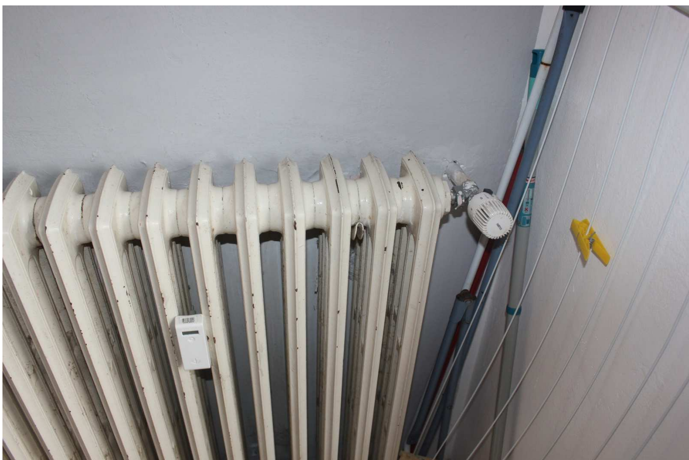
Foto 10 – Radiatori in ghisa con termovalvole e contabilizzatore di calore