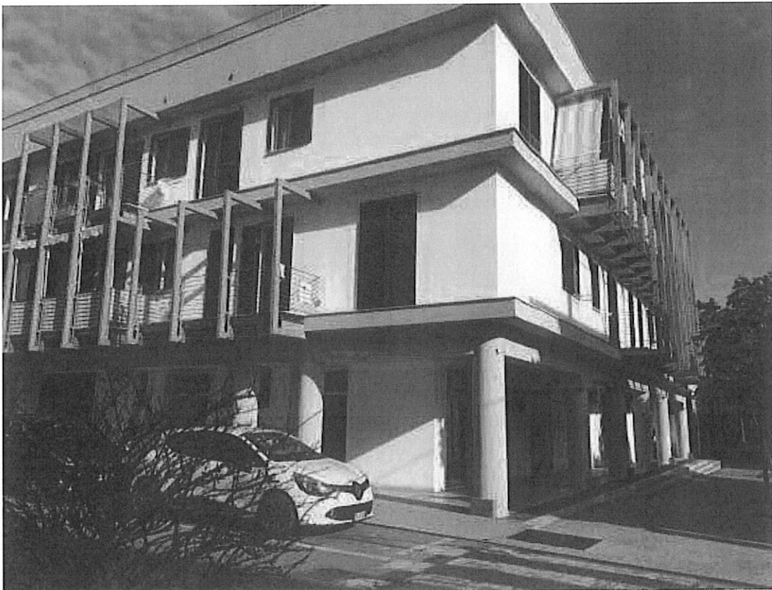
Figura 2 vista dell'edificio da via Cesare Arzelà