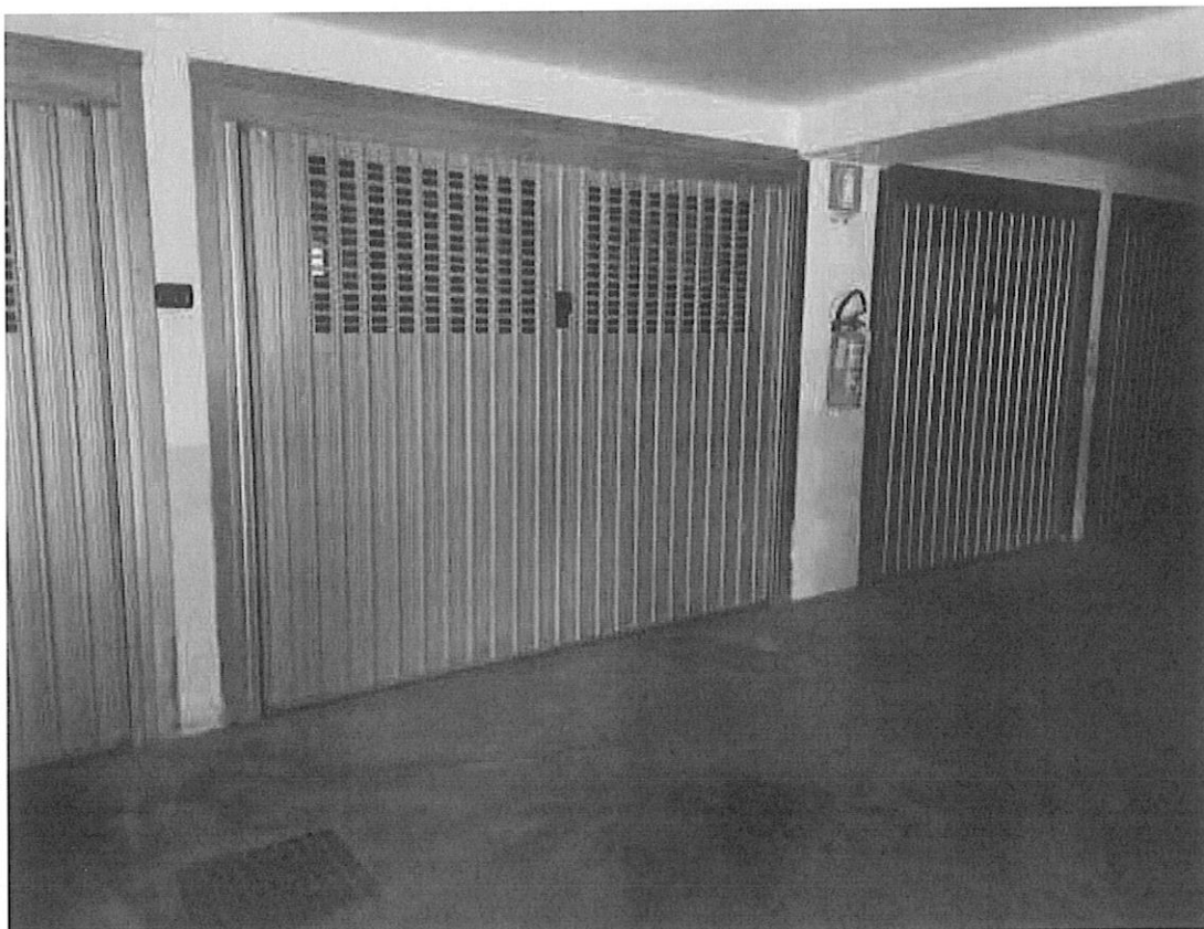
Figura 6 l'ingresso all'autorimessa