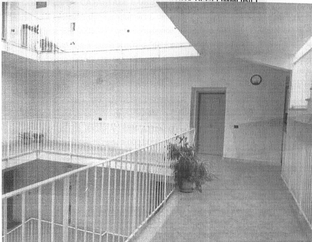
Figura 7 il portoncino di ingresso all'abitazione