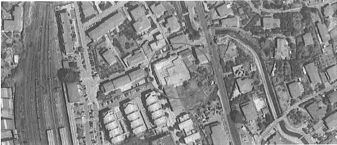
Figura 1 vista aerea foglio 8 mappale 1306