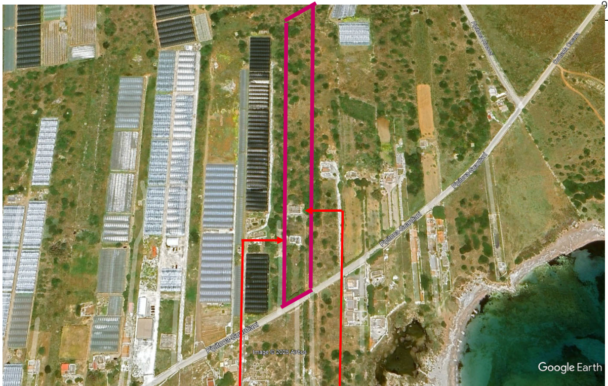
sub 2 e 3