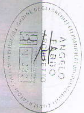
Foto n.11-12 - IDEM