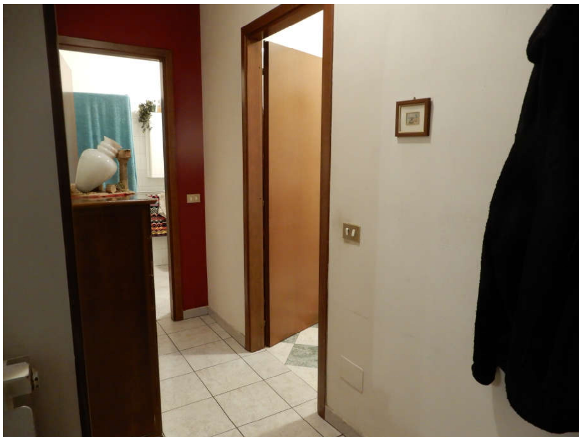
Piano terra – disimpegno bagni