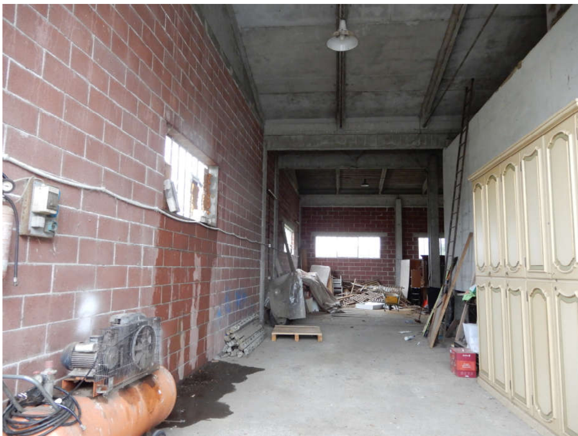
Ingresso capannone – ripresa da portone d'accesso insistente su corte