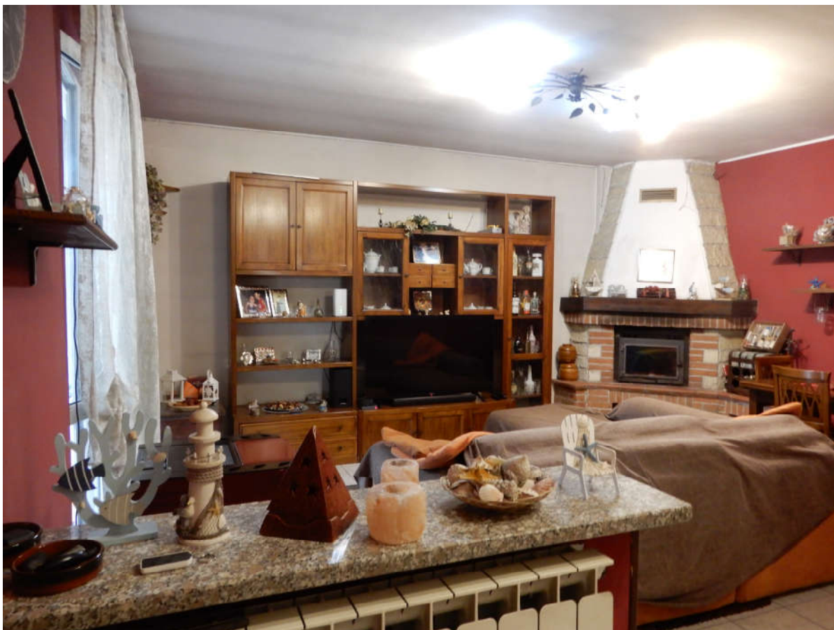
Piano terra – soggiorno