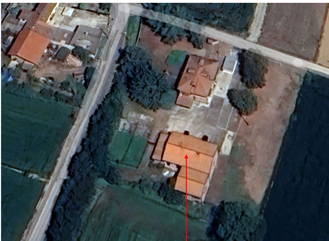
Vista zenitale – compendio pignorato