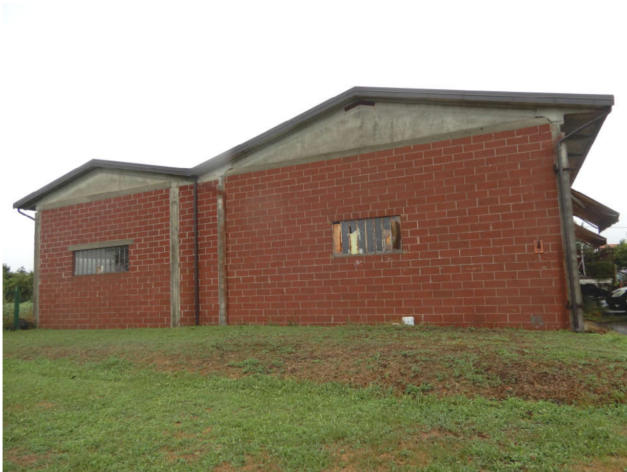
Prospetto Est – Capannone