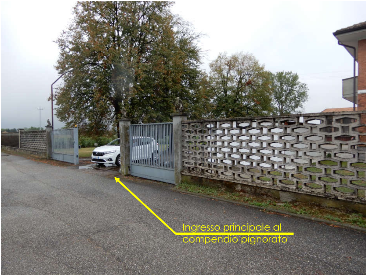
Ripresa da Via Cantone Cerreto