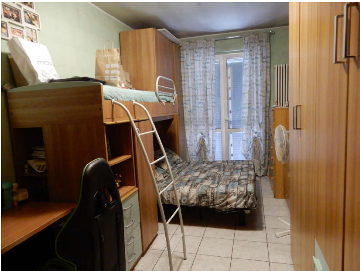
Piano terra – camera