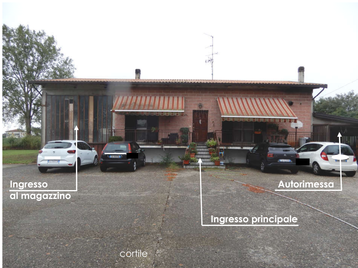
Prospetto Nord – abitazione – ripresa da cortile