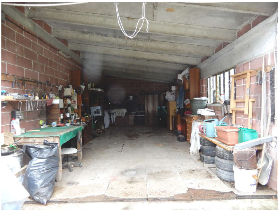
Autorimessa in continuità con il fabbricato residenziale