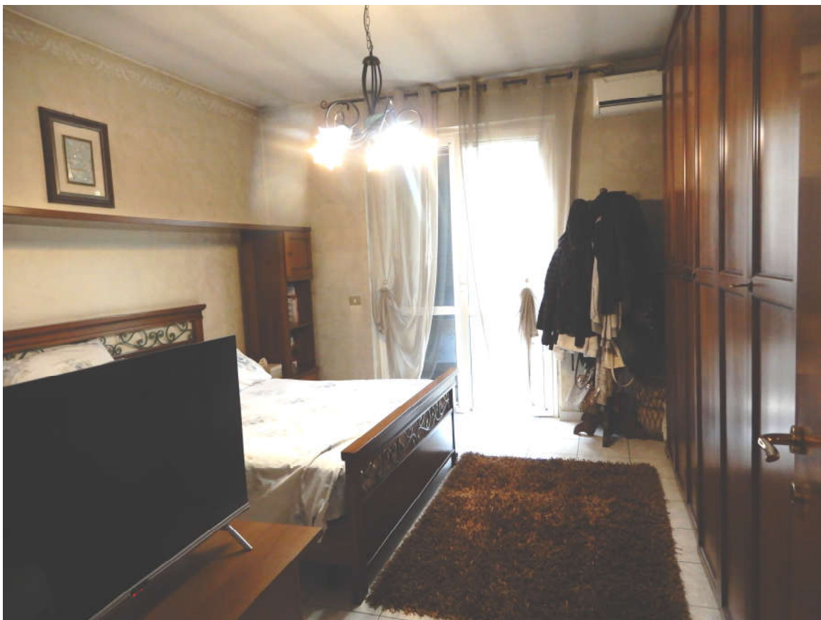
Piano terra – camera padronale