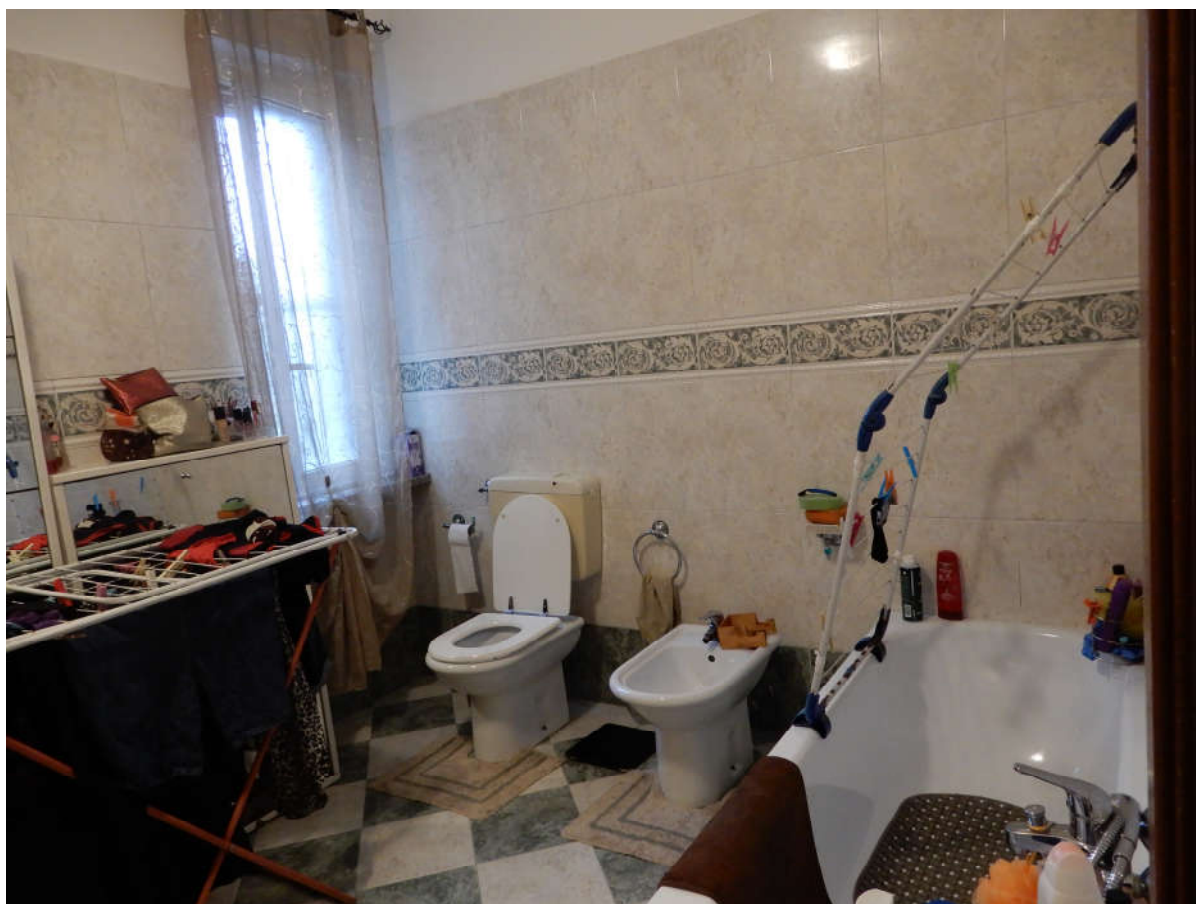
Piano terra – bagno