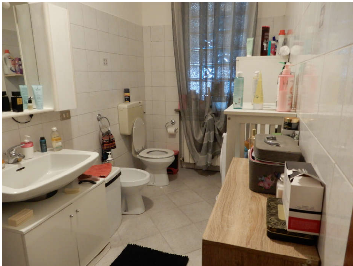
Piano terra – bagno