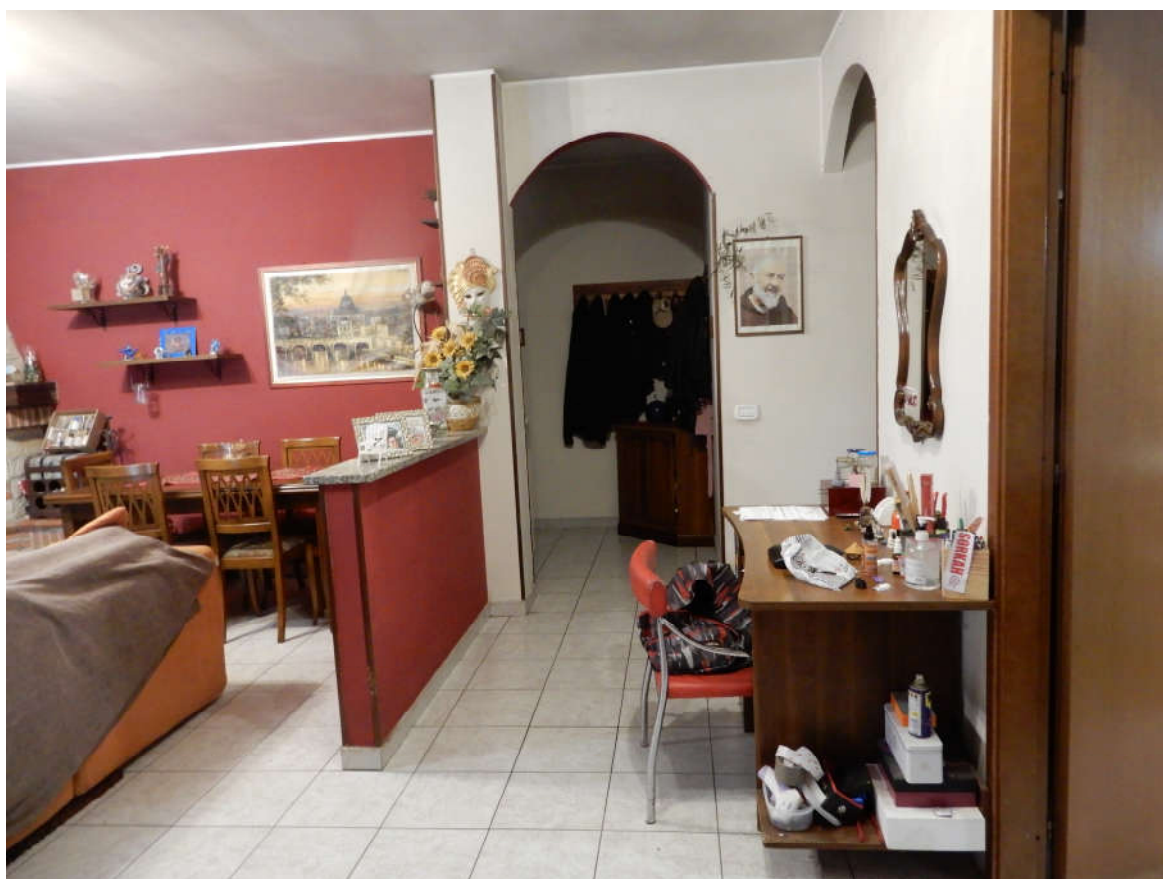
Piano terra - ingresso