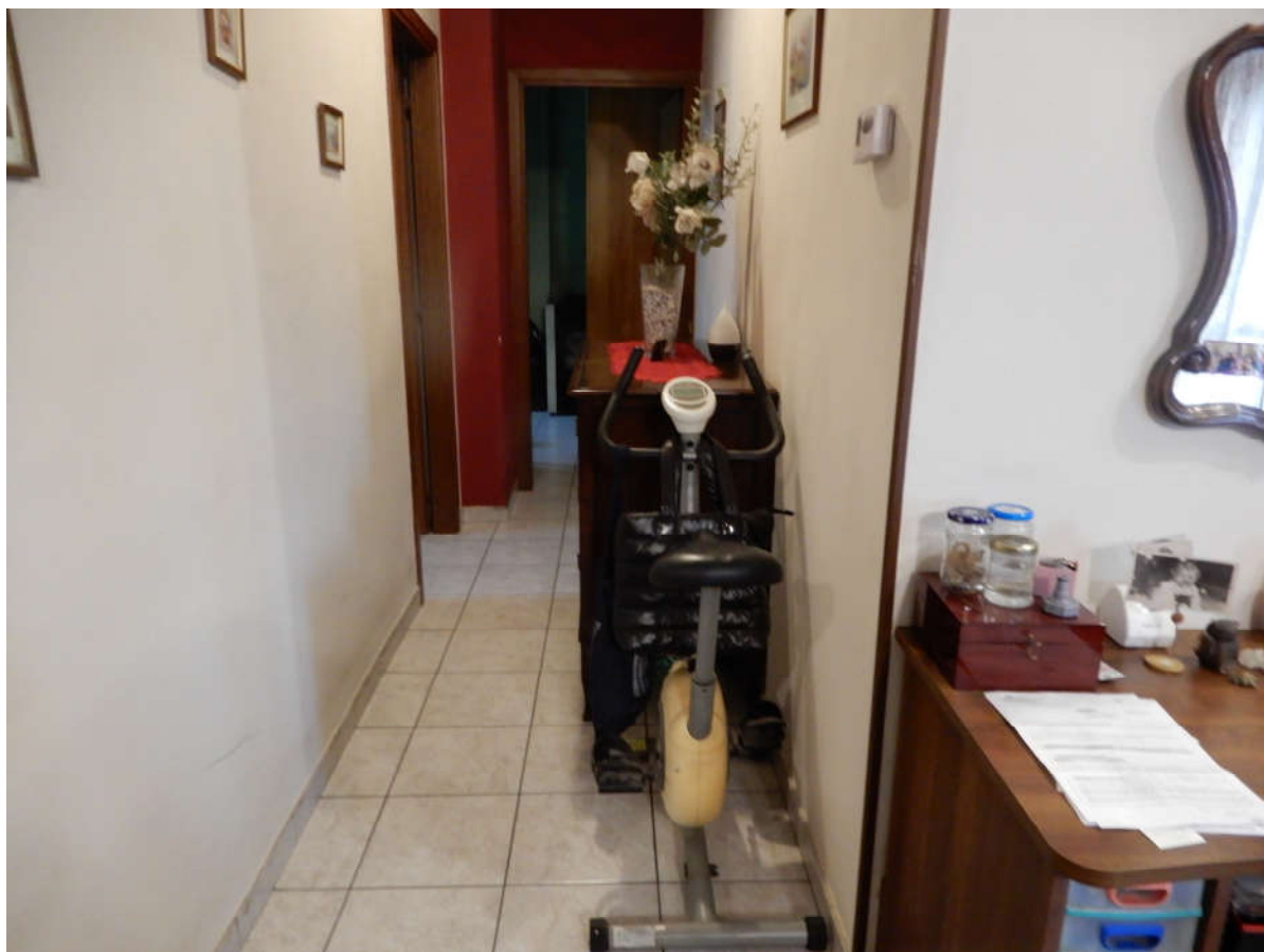
Piano terra – disimpegno camere