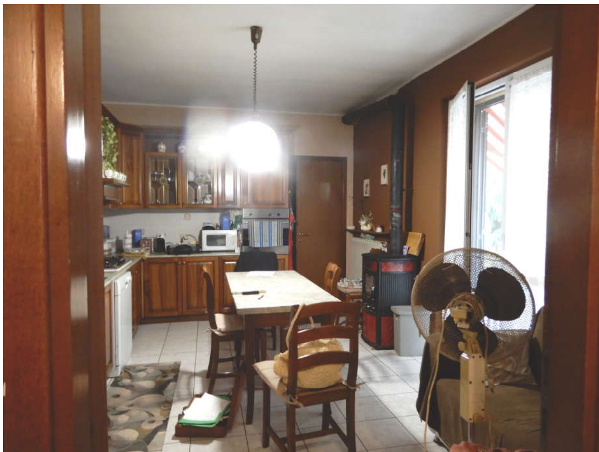
Piano terra - cucina