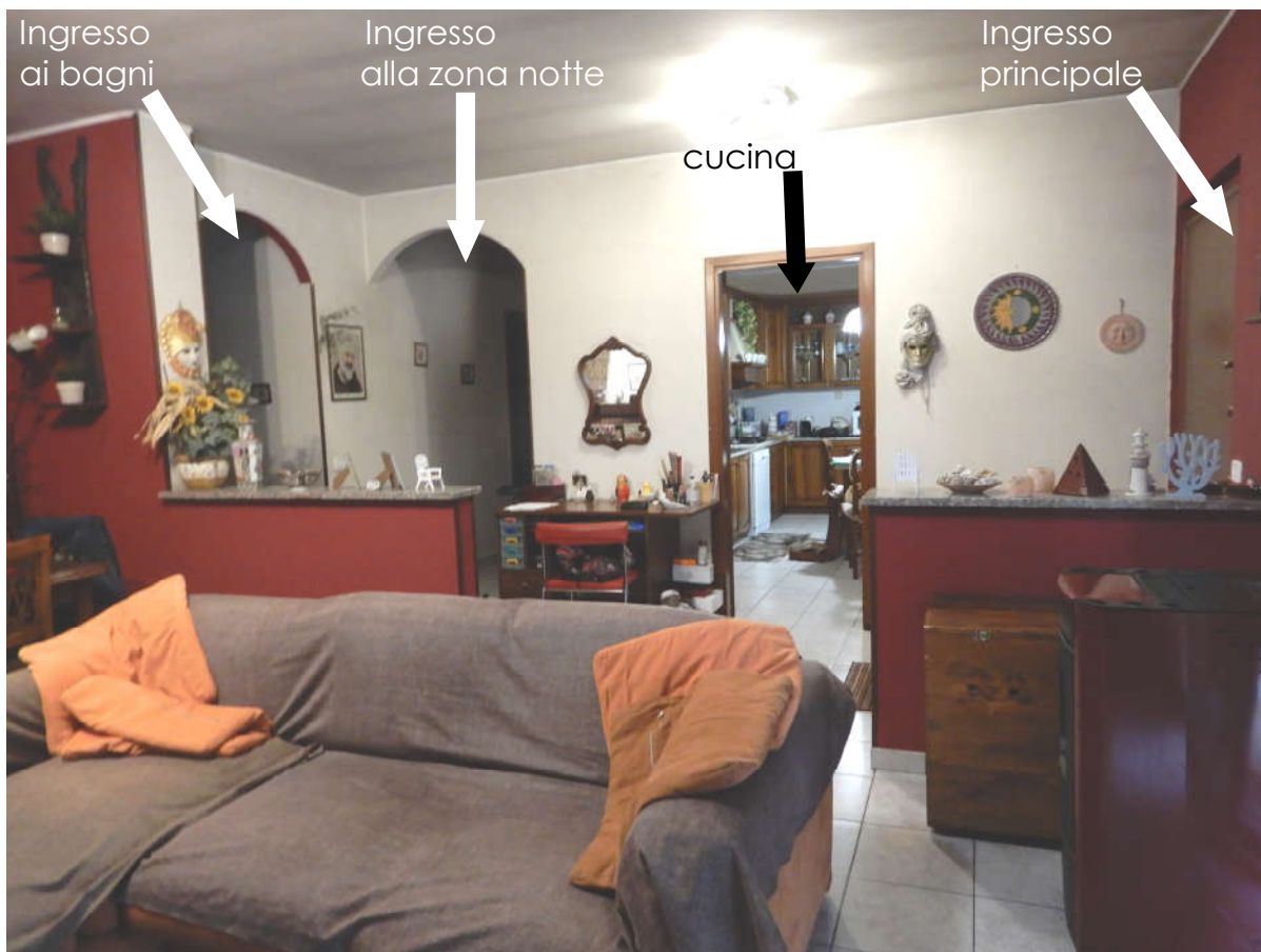
Piano terra - soggiorno