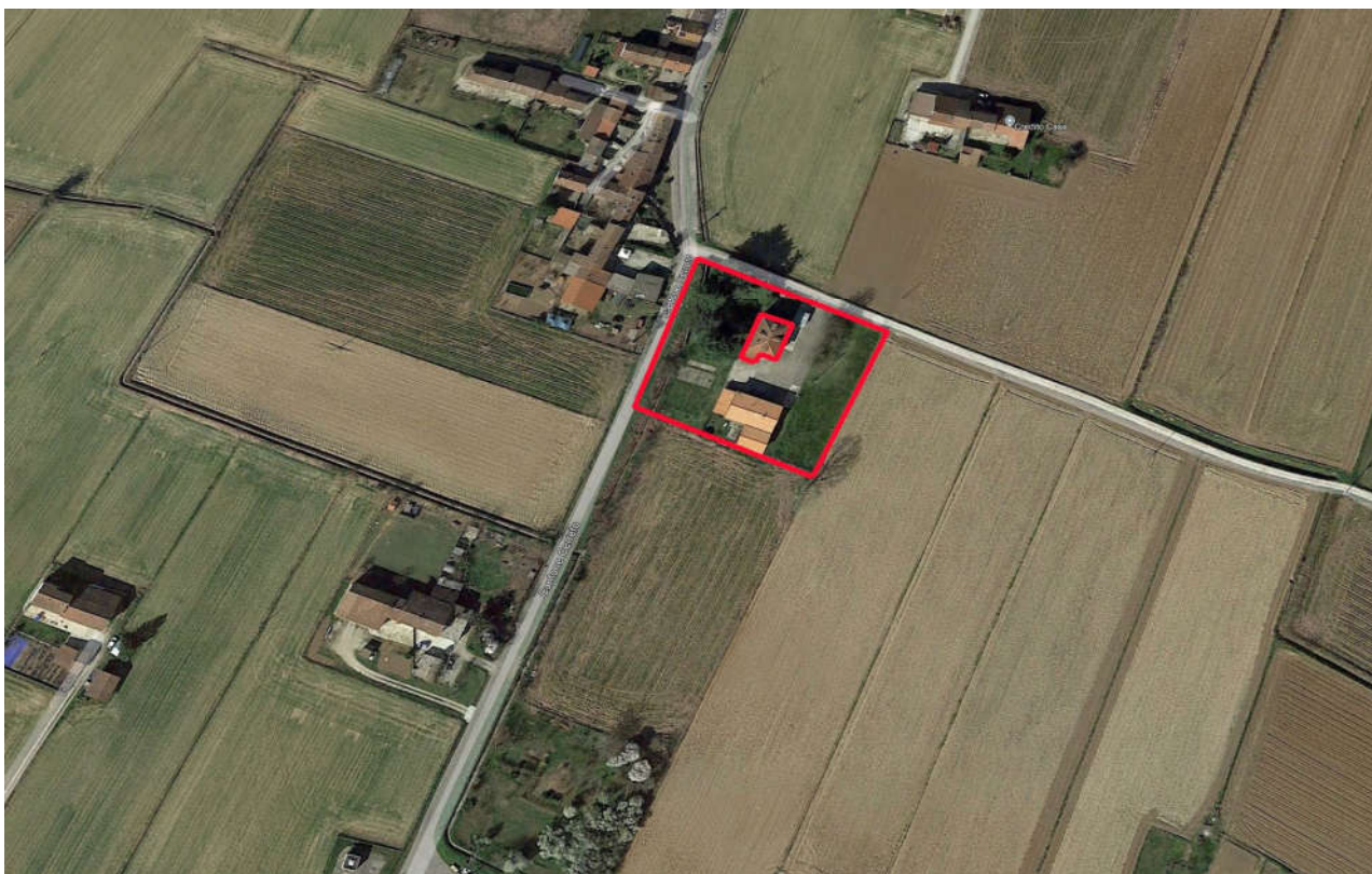
Vista zenitale ed inquadramento del bene oggetto di perizia – area recintata