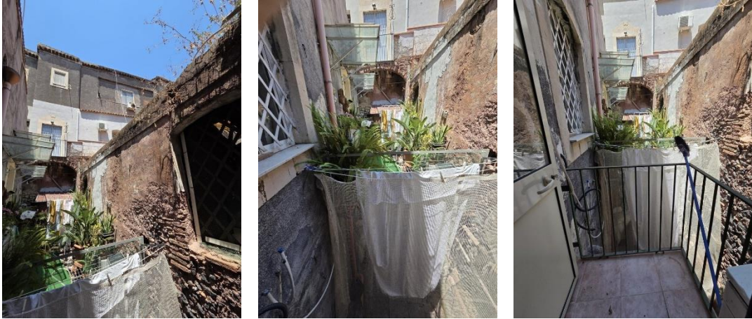
Vista della corte interna di altre ditte