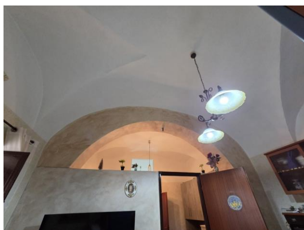
Vista della parete di divisione cucina/vano centrale e dettaglio delle strutture voltate