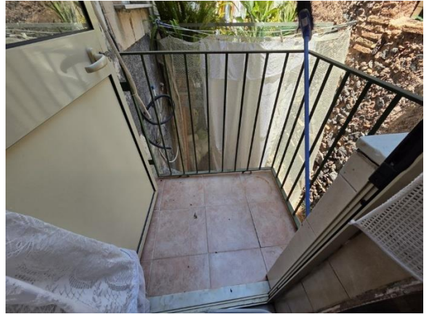
Vista accesso al wc/lavanderia ed alla cucina a Dx e del balconcino