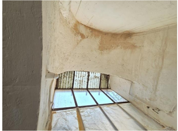
Vista di alcuni stati patologici