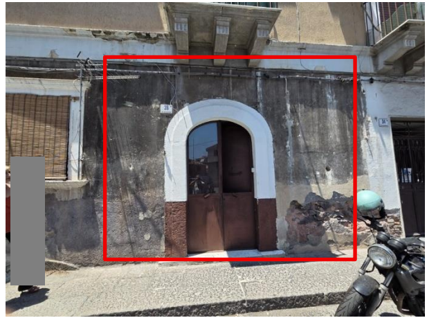
Vista dell'ingresso dal civ.36 della via Gramignani