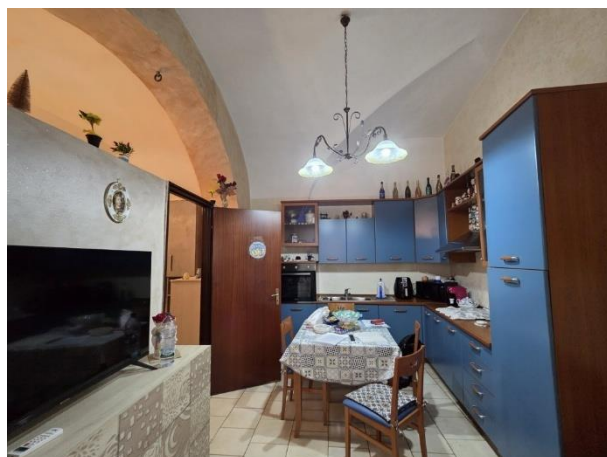
Vista della cucina