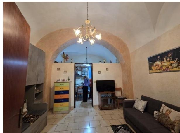
Vista del vano centrale