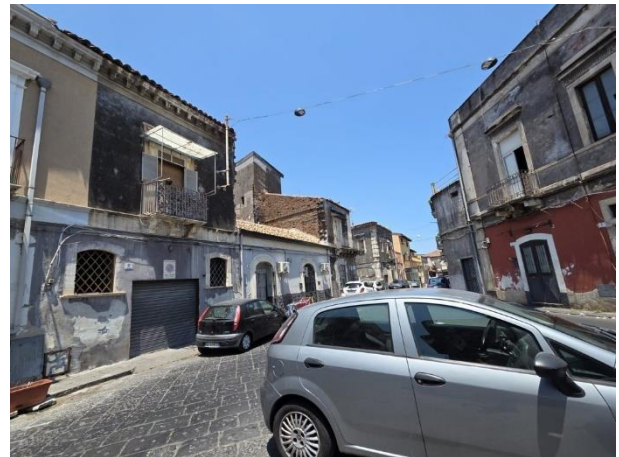
Vista del contesto