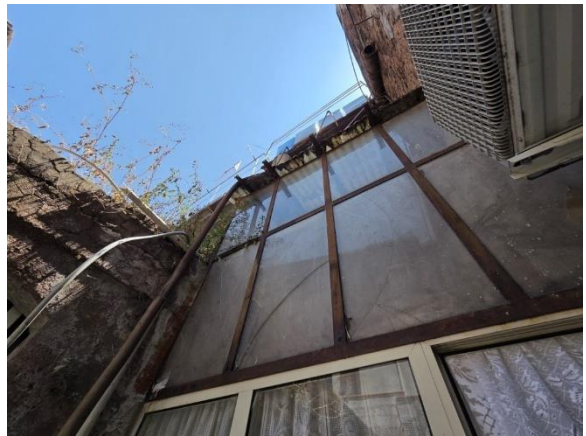
Vista del terrazzino e della struttura verandata a chiusura dello stesso