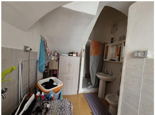
Vista del WC/lavanderia