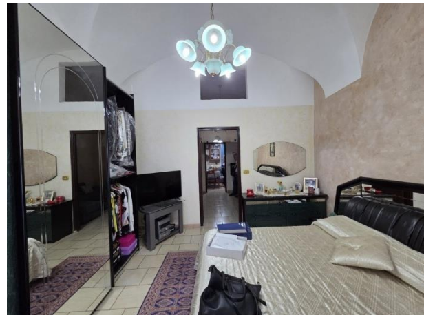
Vano a sud (ingresso-camera)