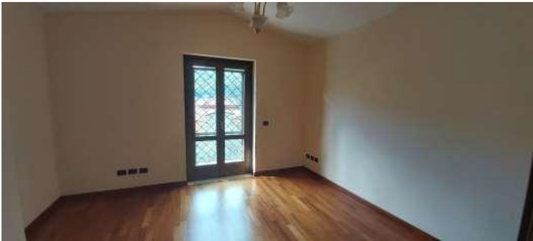
Foto 6. La terza camera da letto.