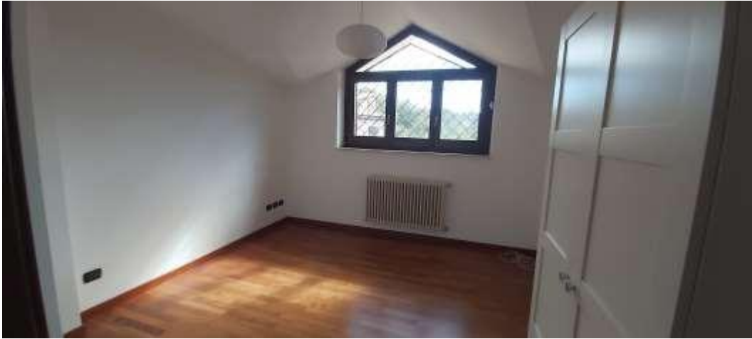
Foto 5. La seconda camera da letto.