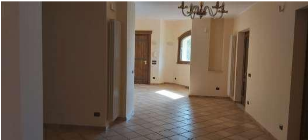
Foto 9. Il ripostiglio cieco.