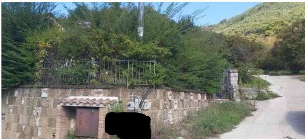
Foto 5. Il tratto della strada comunale Via Annarumma, sul lato sud, di accesso al piano primo sottostrada ed all'annesso garage.