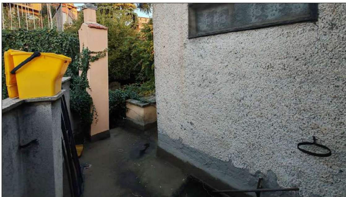
foto 45 - vista dell'accesso al giardino.