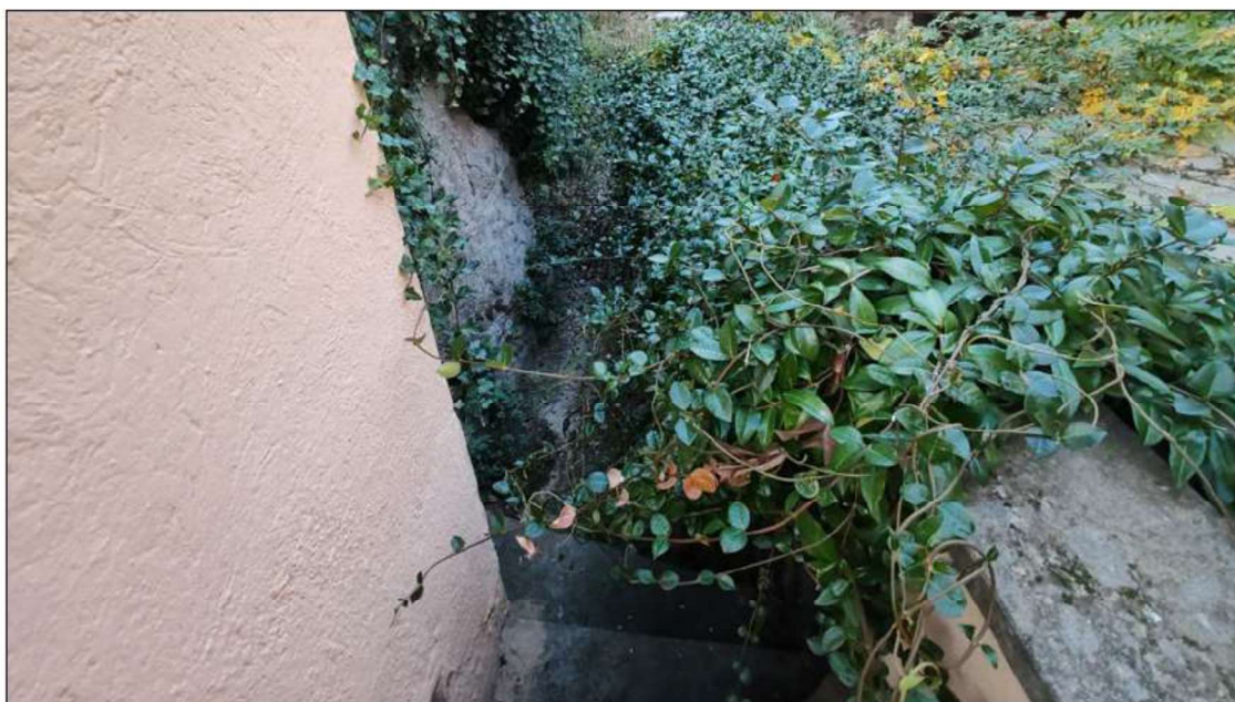
foto 47 - particolare della scala di accesso al giardino coperta da vegetazione.