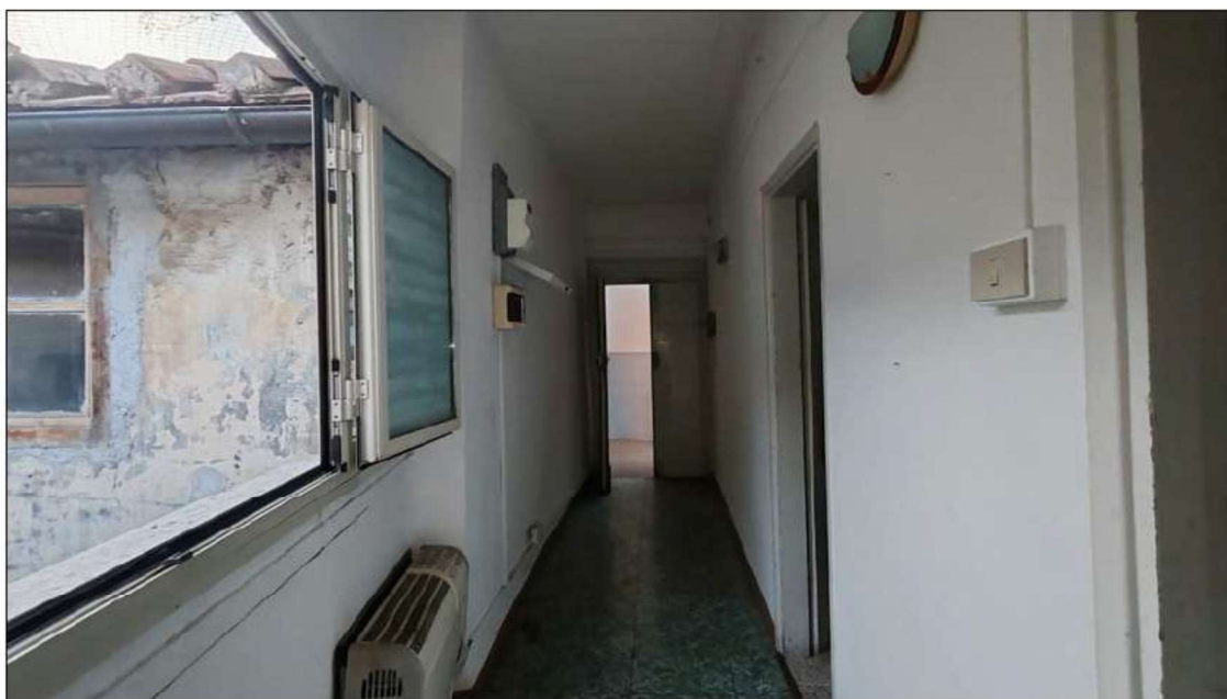
foto 27 - vista del corridoio e della porta d'ingresso del sub 23 (LOTTO 2).