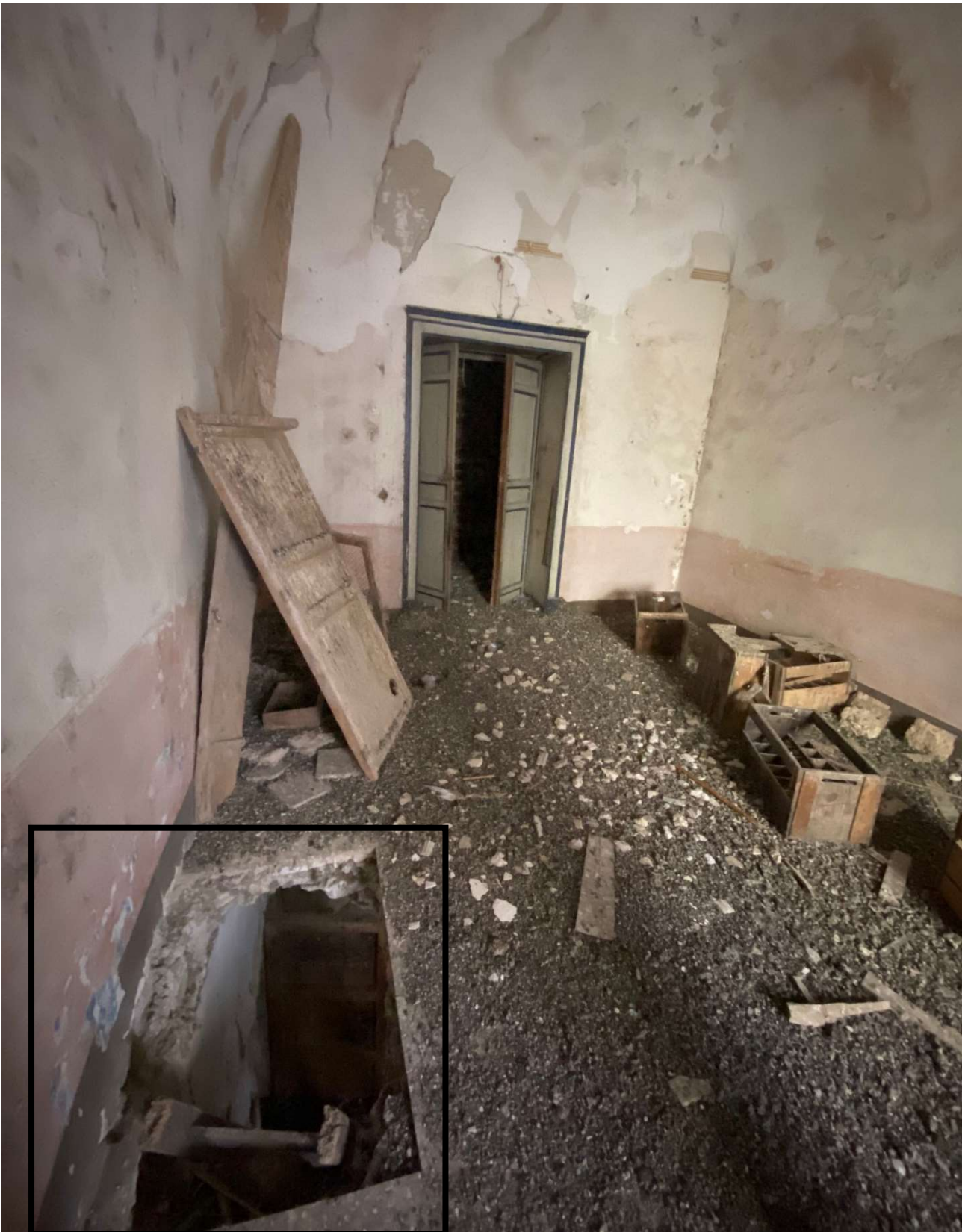
Porzione di solaio crollato, da cui si accede al Piano Primo (tramite scala in legno)