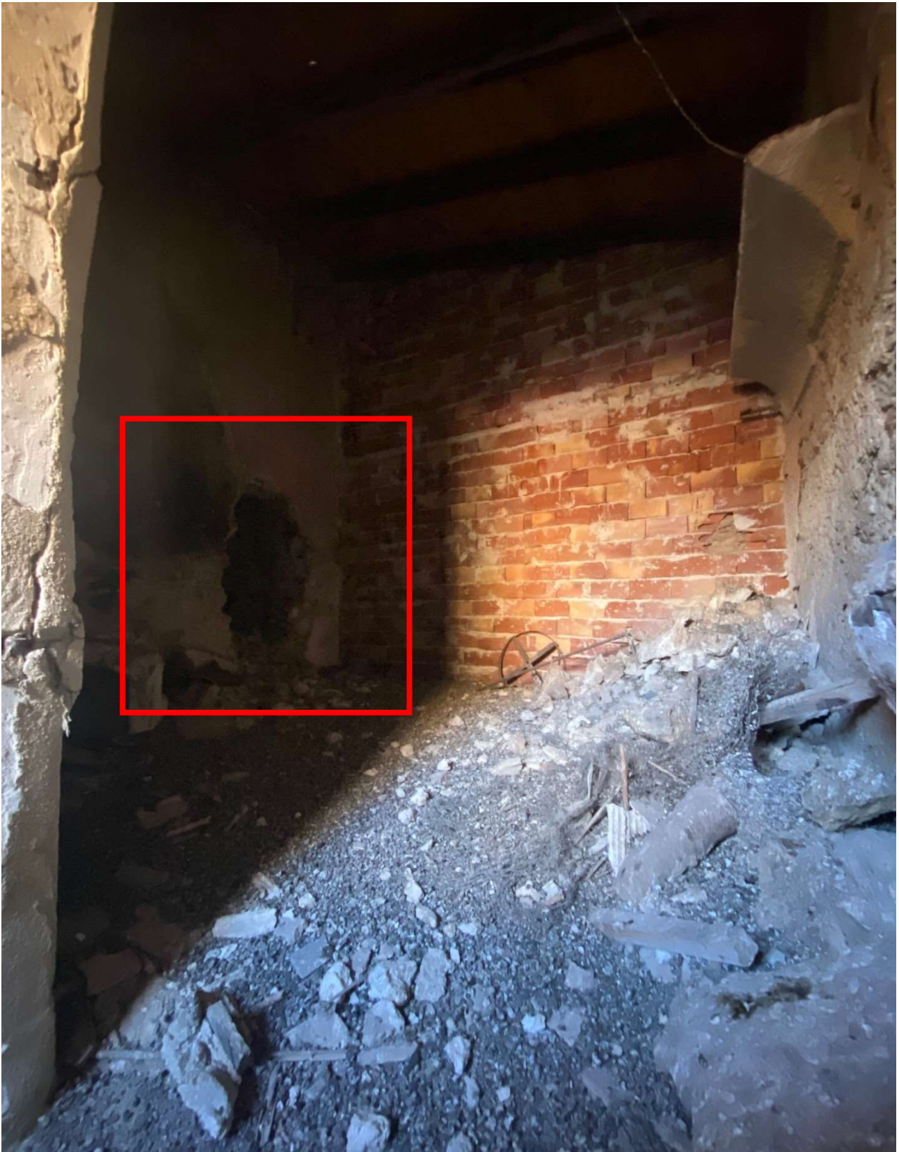
Sbarramento fisico al prosieguo delle operazioni peritali nel piano secondo