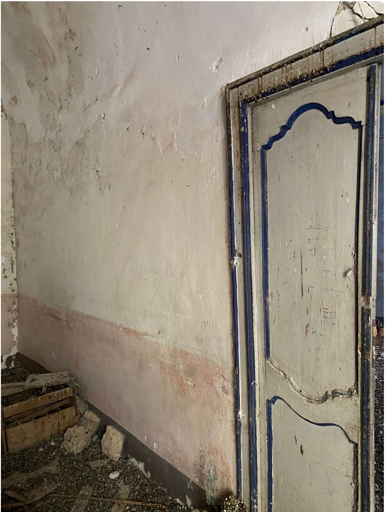
Piano Primo – stanza 2