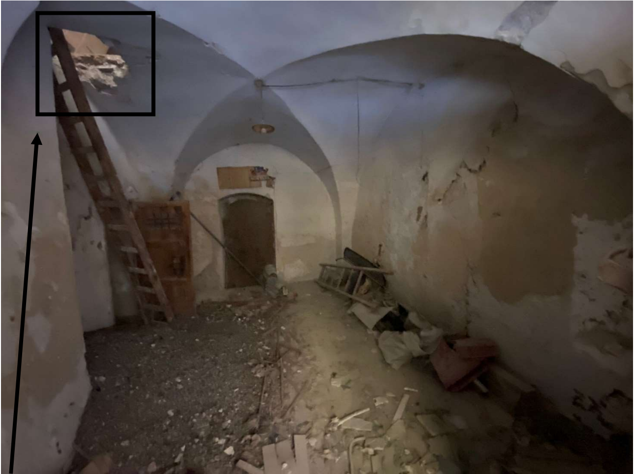
Porzione di solaio crollato, da cui si accede al Piano Primo (tramite scala in legno)