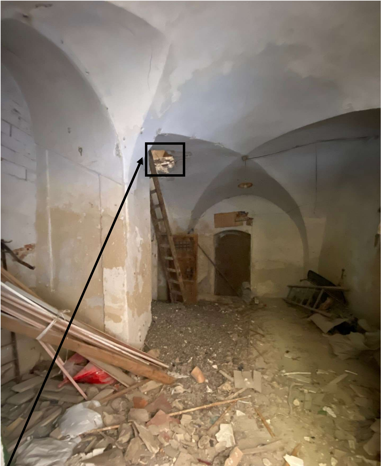
Porzione di solaio crollato, da cui si accede al Piano Primo (tramite scala in legno)