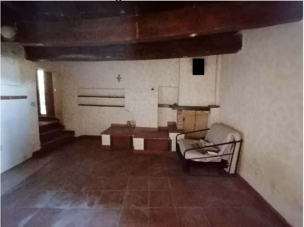
FOTO N°08: Soggiorno – dettaglio dell'angolo cottura (predisposizione).