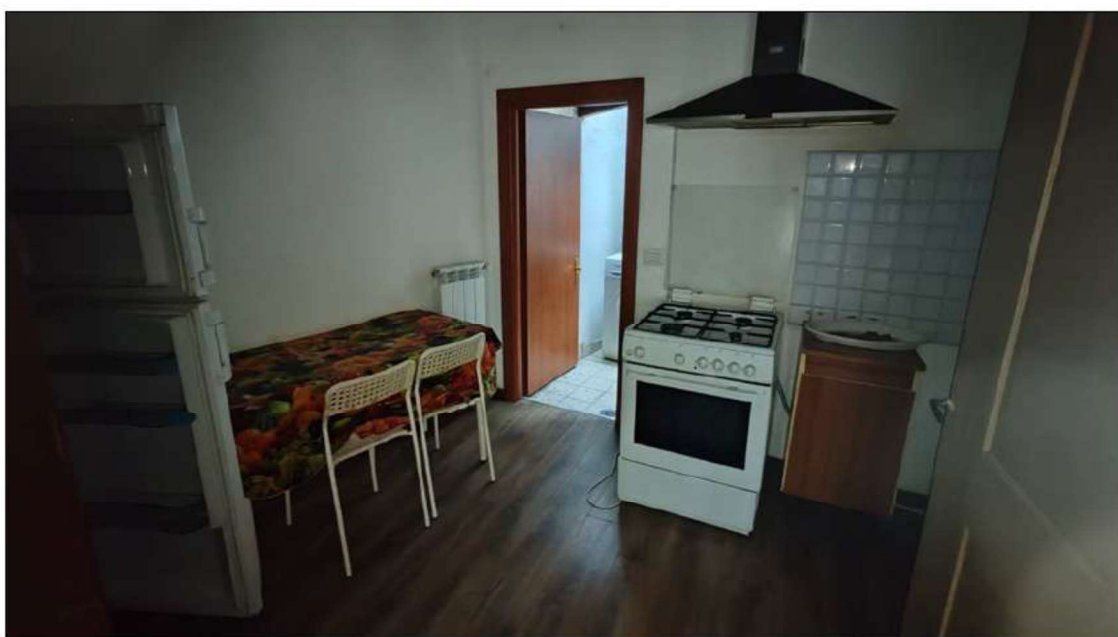
foto 36 - altra vista del locale cucina.