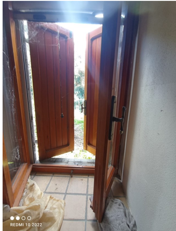
Figura 9 gli infissi