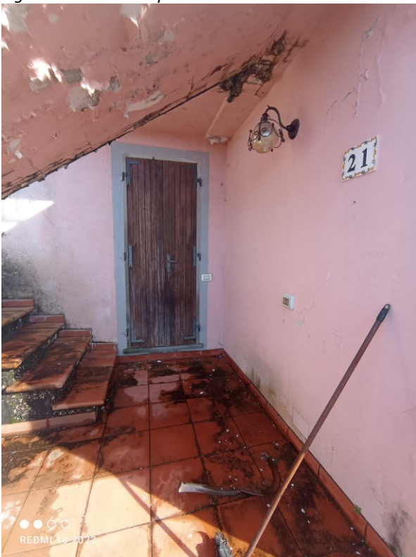
Figura 5 ingresso al piano terra lato sud