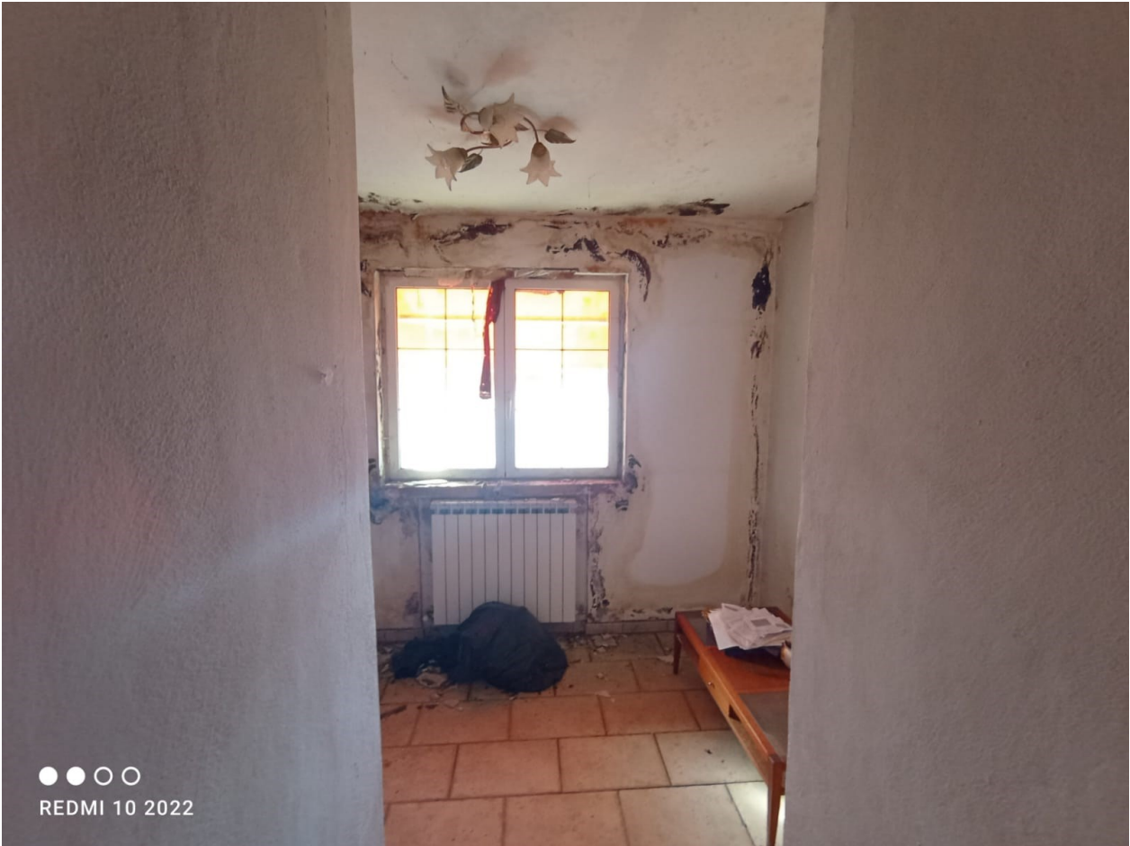
Figura 7 il locale sottostante la terrazza