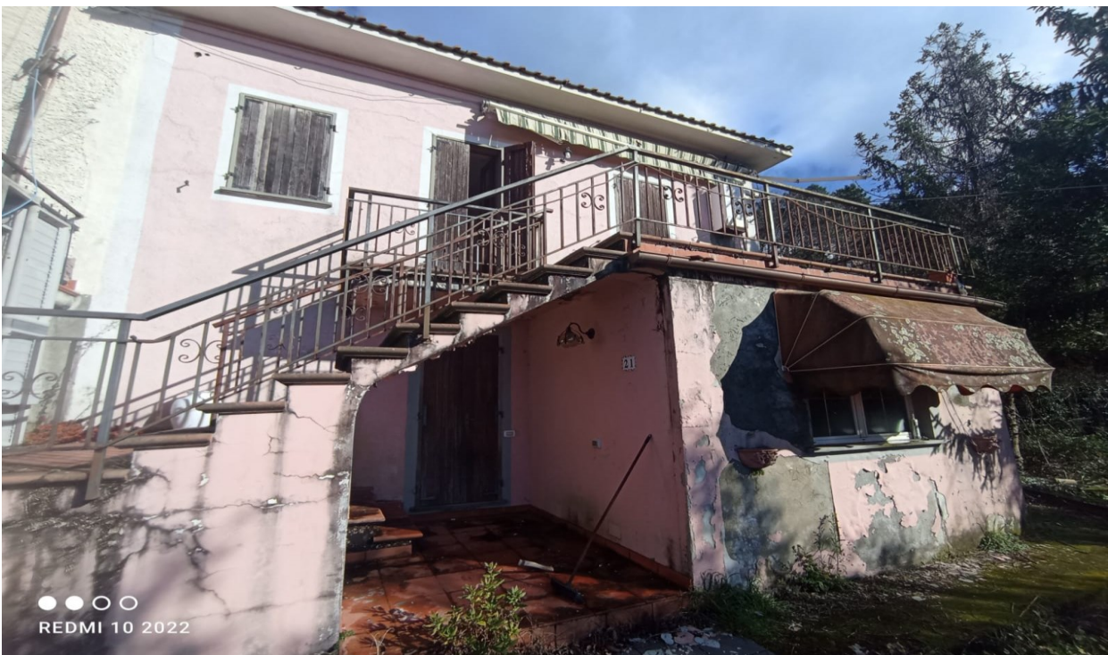
Figura 3 prospetto sud dell'edificio (mappale 35 del foglio 6)