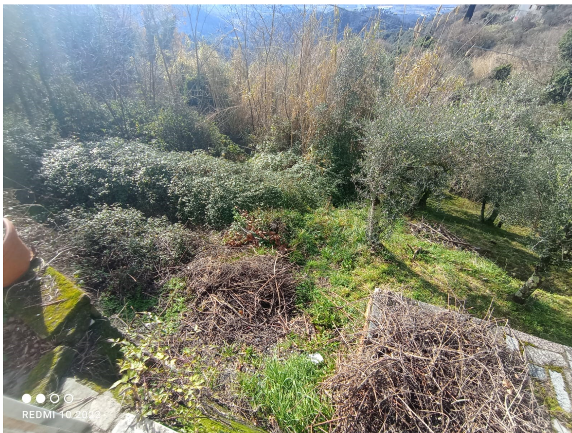
Figura 10 il terreno mappale 263 del Foglio 6