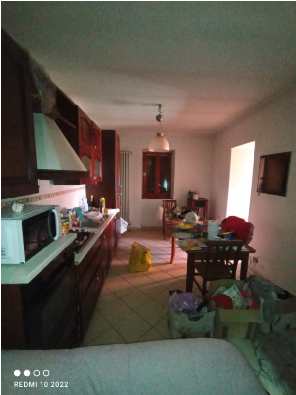
Figura 8 il locale cucina/soggiorno al piano terra