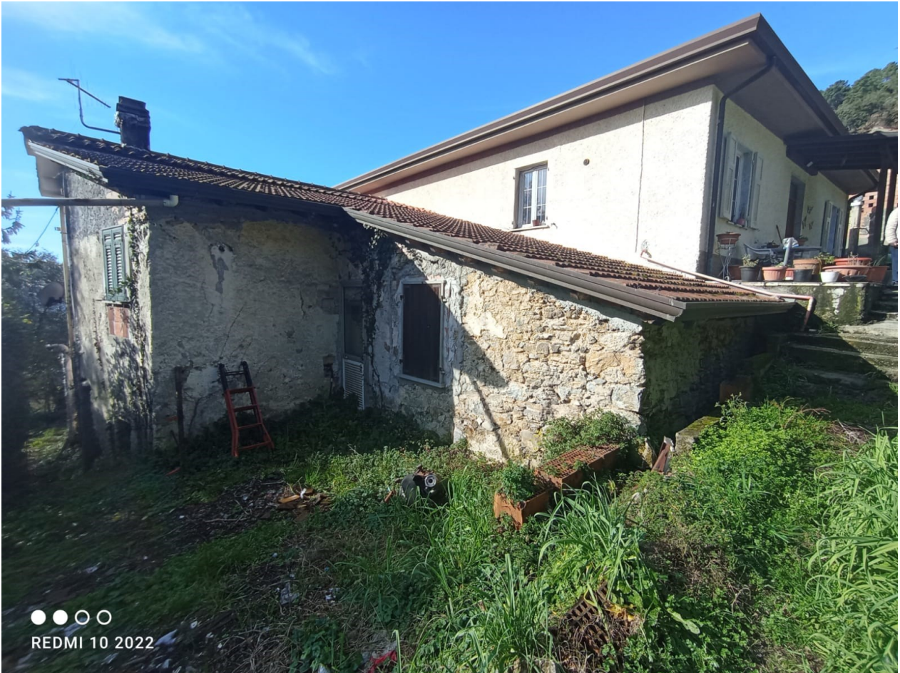
Figura 4 locale di deposito