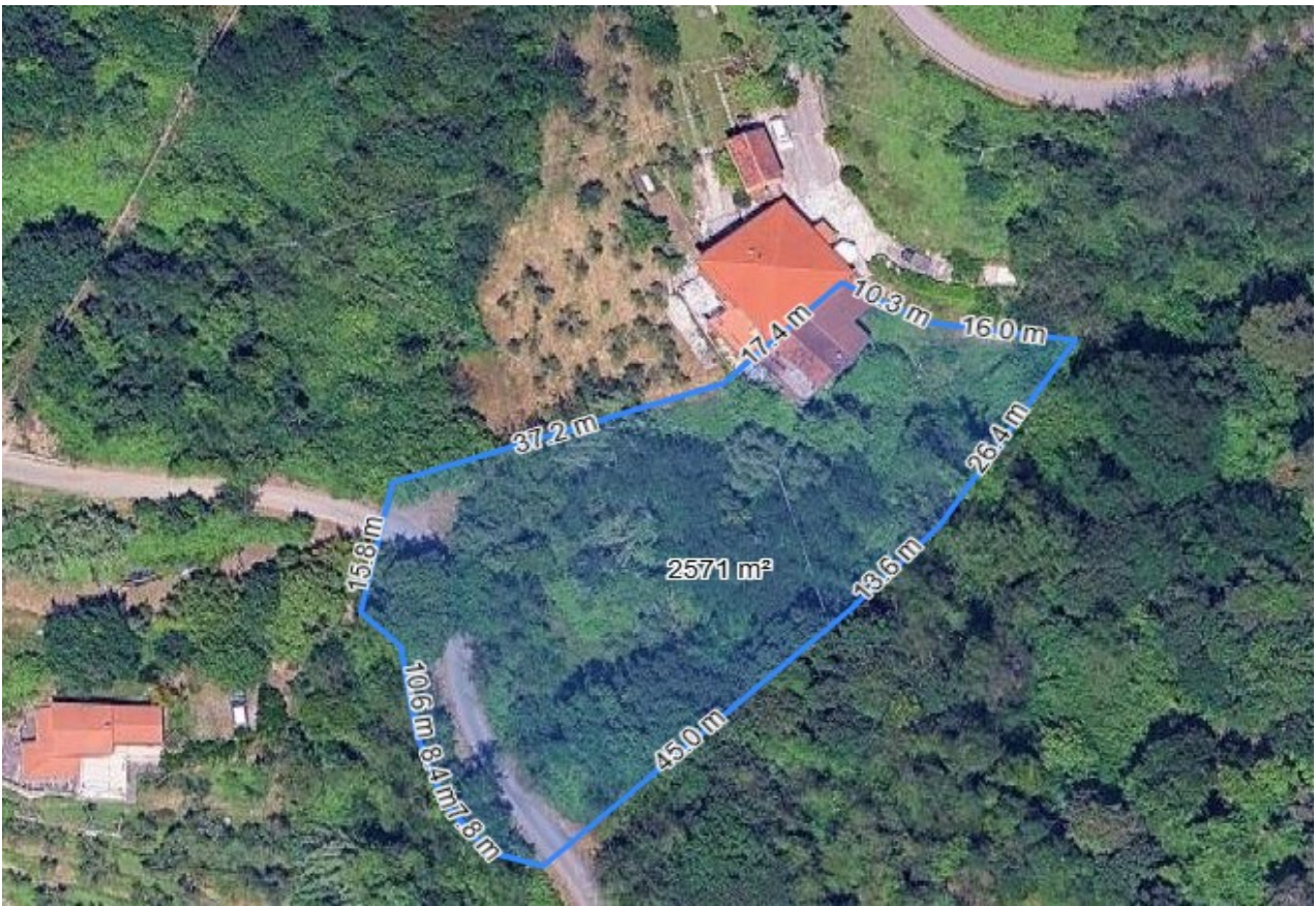
Figura 2 vista aerea da Stimatrix ForMaps