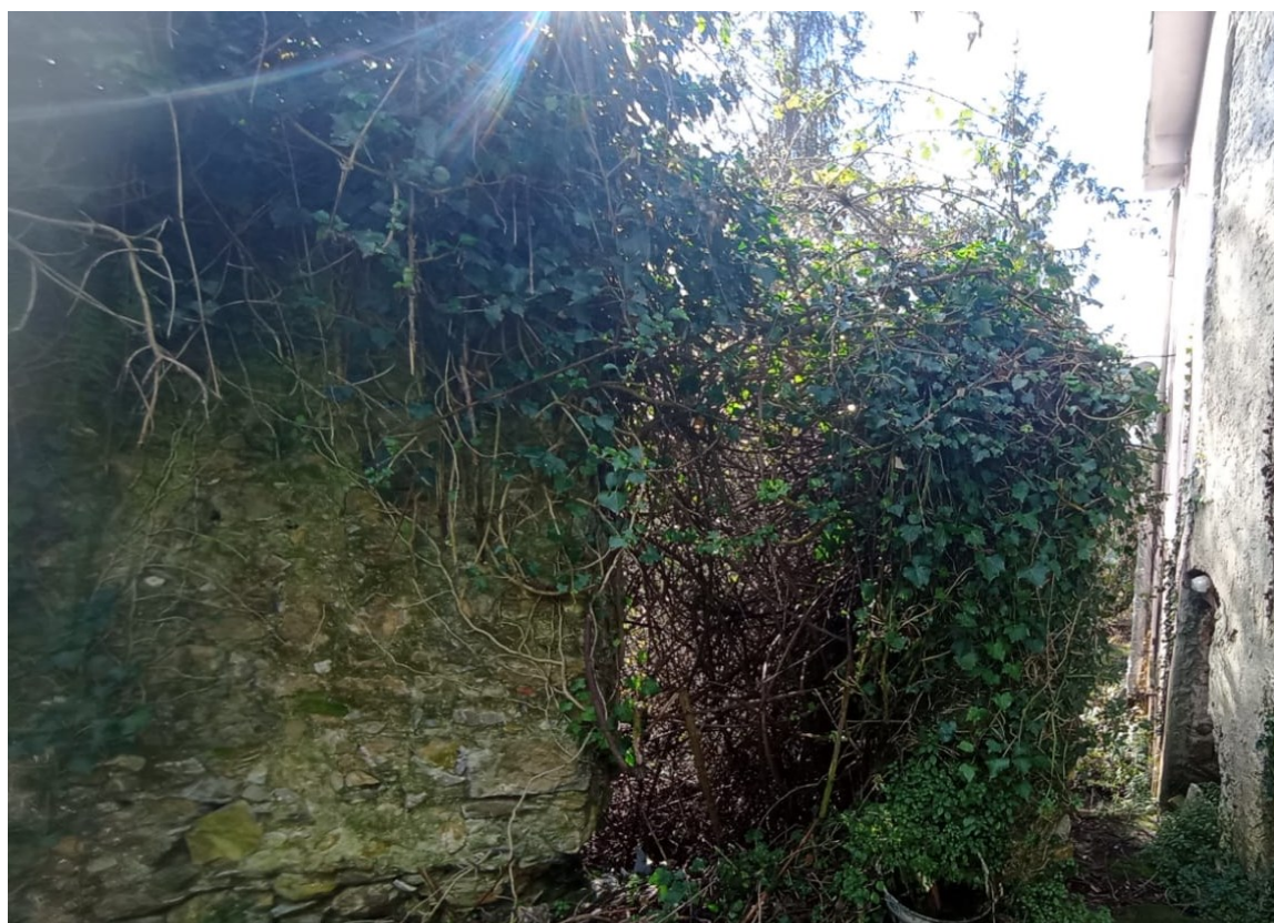
Figura 11 il fabbricato diruto