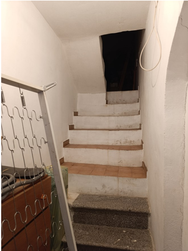
Foto n. 16 Scala accesso sottotetto