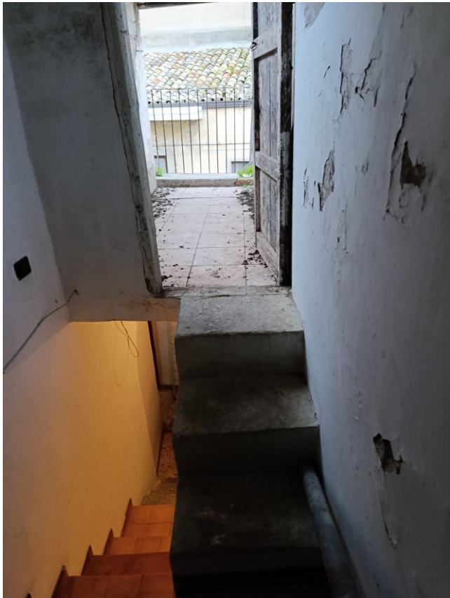
Foto n. 19 Scala accesso copertura