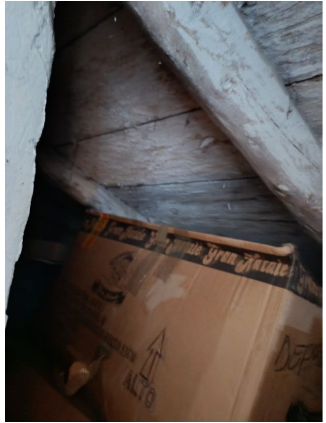
Foto n. 17 Sottotetto