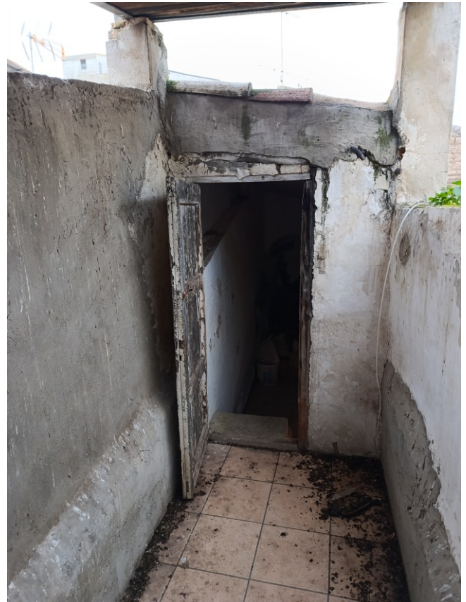
Foto n. 20- Arrivo terrazza copertura