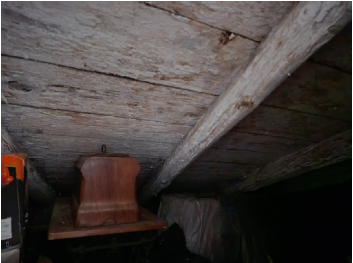
Foto n. 18 - Sottotetto