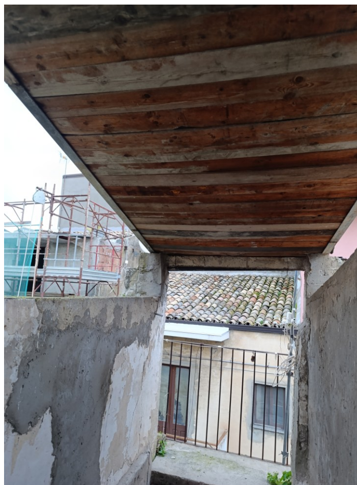
Foto n. 21 - Terrazza piana coperta